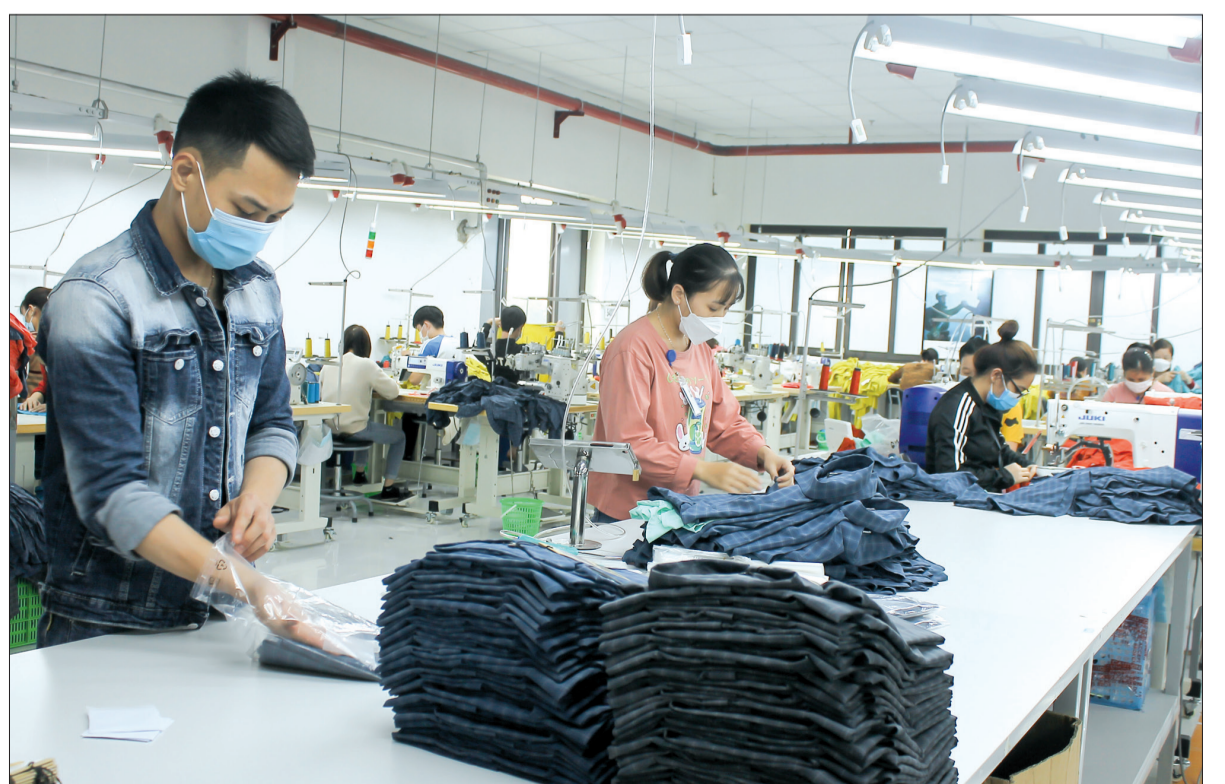
Các doanh nghiệp tăng cường các biện pháp phòng, chống dịch trong thời điểm này.

chức 3 lượt test nhanh sàng lọc Covid-19 cho 100% giáo viên, học sinh đến trường. Thay vì đón, trả trẻ tập trung như trước, Trường phân chia khu vực, thời gian đón, trả trẻ khác nhau để bảo đảm giãn cách. Thậm chí trong mỗi lớp học, trẻ được phân chia theo các nhóm cố định, từ 4 - 5 trẻ/nhóm, trẻ trong cùng nhóm tham gia các hoạt động như ăn, chơi, ngủ độc lập với các nhóm khác nhằm giảm tối đa tiếp xúc, nguy cơ lây nhiễm dịch. Đối với các bé có biểu hiện