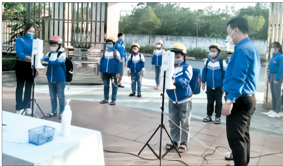
Trường Tiểu học Vũ Phúc (thành phố Thái Bình) thực hiện nghiêm các biện pháp phòng, chống dịch Covid-19 khi học sinh đến trường.

Hơn 2 tuần đi học lại sau kỳ nghỉ tết Nguyên đán, tình hình dịch Covid-19 tại nhiều trường học trên địa bàn tỉnh có những diễn biến phức tạp khi phát hiện nhiều giáo viên và học sinh là F0. Trước tình hình đó, ngành giáo dục đã chủ động, linh hoạt trong việc triển khai các hoạt động dạy học, bảo đảm an toàn cho giáo viên và học sinh, đồng thời hoàn thành chương trình đề ra.