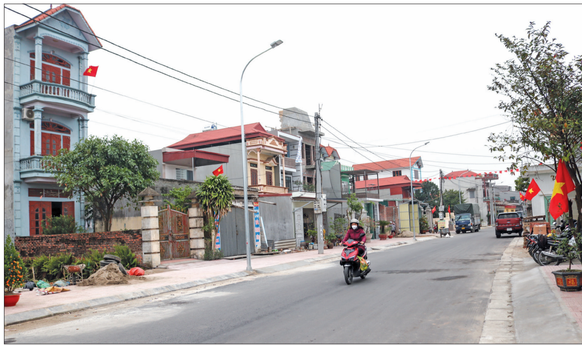
Tuyến đường nâng cấp, cải tạo qua địa bàn xã An Thái (Quỳnh Phụ) ngày càng khang trang, sạch đẹp.

thức đúng đắn về chủ trương mở đường, đồng thuận góp đất cho nhà nước giải phóng mặt bằng thực hiện tuyến đường đi qua địa bàn. Với tổng chiều dài toàn tuyến qua địa bàn xã 1,7km; tổng diện tích cần giải phóng mặt bằng 3.243m 2 (đất ở 784m 2 , đất nông nghiệp 2.459m 2 ), riêng thôn Hạ có 45 hộ đều viết đơn xin góp đất. Nhờ được tuyên truyền, vận động, thấy được lợi ích của việc mở rộng tuyến đường, chỉ sau 3 ngày vận động, tất cả người dân thôn Hạ đồng thuận góp đất. Ông Nguyễn Văn Đợi, Trưởng thôn Hạ chia sẻ: Thực hiện Thông báo kết luận số 220, cán bộ thôn Hạ tích cực tuyên truyền, vận động để nhân dân hiểu được lợi ích trong việc mở rộng đường, từ đó tự nguyện góp đất. Mặc dù giá trị thời điểm triển khai dự án là trên 20 triệu đồng/m 2 đất ở nhưng nhận thức được lợi ích mang lại sau khi mở rộng đường nên chỉ trong 3 ngày, các hộ dân của thôn ở giáp trực đường đều tự nguyện góp đất, hộ góp nhiều nhất lên đến 20m 2 , hộ thấp cũng từ 5 -