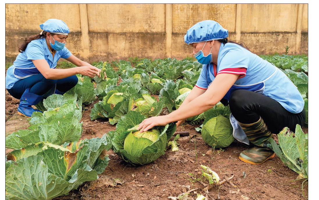
Cô nuôi Trường Mầm non Duyên Hải (Hưng Hà) thu hoạch rau bắp cải tại vườn rau nhà trường.