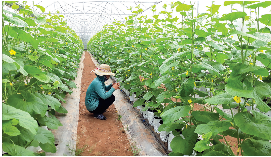
Nông dân xã Tiến Đức (Hưng Hà) chuyển đổi cơ cấu cây trồng phát triển mang lại hiệu quả cao.

xã hội, chăm sóc sức khỏe nhân dân. Xã đã quy hoạch 4 vùng sản xuất hàng hóa tập trung với diện tích 280ha. Giá trị sản xuất tại những vùng này đạt bình quân 500 triệu đồng/ha/năm. Thu nhập bình quân đầu người của xã đến nay ước đạt 47,67 triệu đồng/năm, tỷ lệ hộ nghèo giảm còn 1,4%. Nhóm tiêu chí về văn hóa, xã hội, môi trường, hệ thống chính trị của xã đều đạt chuẩn nâng cao theo quy định. Tuy nhiên, đến tháng 1/2021 Hồng