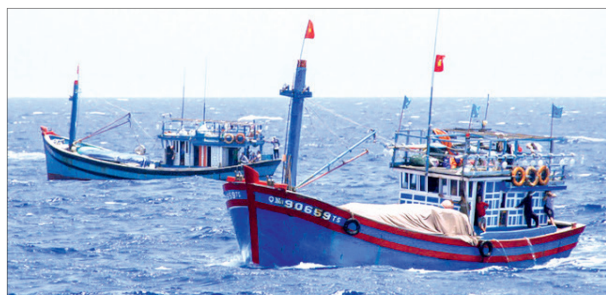
Miễn lệ phí cấp giấy phép sử dụng tần số vô tuyến điện đối với đài vô tuyến điện đặt trên phương tiện nghề cá.

(chinhphu.vn) Bộ Tài chính vừa ban hành Thông tư số 11/2022/TT-BTC sửa đổi, bổ