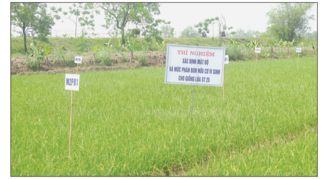
Vùng sản xuất lúa hữu cơ kết hợp nuôi rươi ở xã Hồng Tiến.

Những năm qua, huyện Kiến Xương tăng cường thực hiện tích tụ ruộng đất, chú trọng xây dựng và phát triển vùng sản xuất hàng hóa tập trung gắn với liên kết tiêu thụ sản phẩm nhằm nâng cao hiệu quả sản xuất và thu nhập cho người dân.