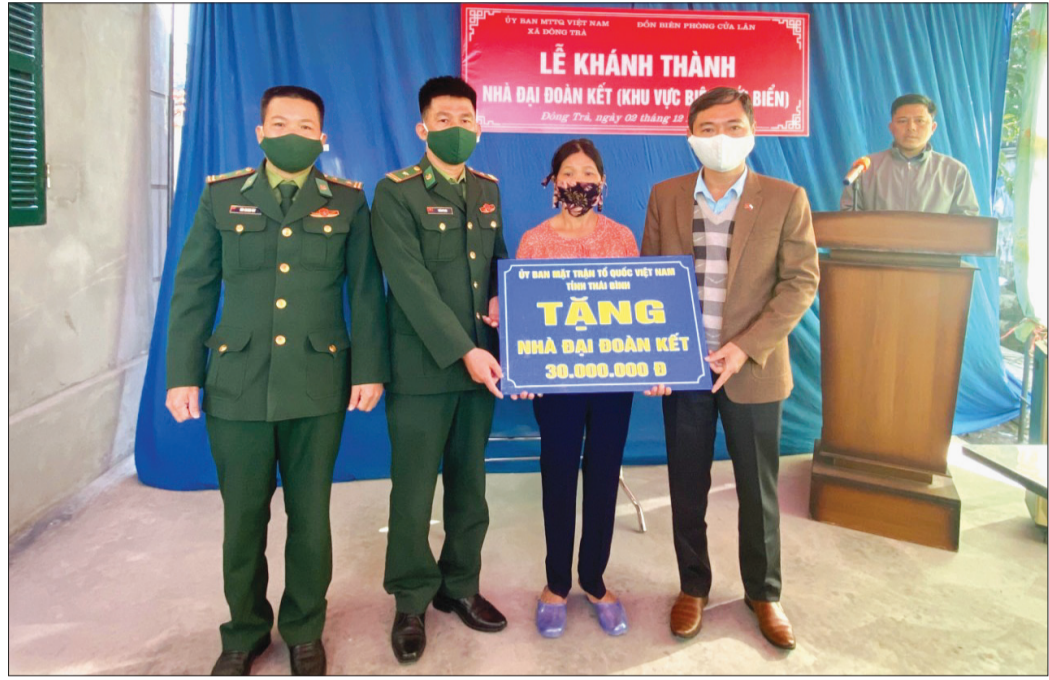
Ủy ban MTTQ huyện Tiên Hải phối hợp với Đồn Biên phòng Cửa Lân ủng hộ xây nhà đại đoàn kết cho hộ nghèo tại xã Đông Trà.

Nhằm hỗ trợ sinh kế cho người nghèo tại các xã ven biển, thời gian qua, Ủy ban MTTQ huyện Tiên Hải phối hợp với các ngành, đơn vị vận động các tổ chức, cá nhân tham gia hỗ trợ, đồng thời triển khai các chính sách, chương trình hỗ trợ người nghèo đạt hiệu quả cao, góp phần lan tỏa tinh thần đoàn kết trong người dân, gia đình, cộng đồng để thực hiện chính sách giảm nghèo bền vững tại địa phương.