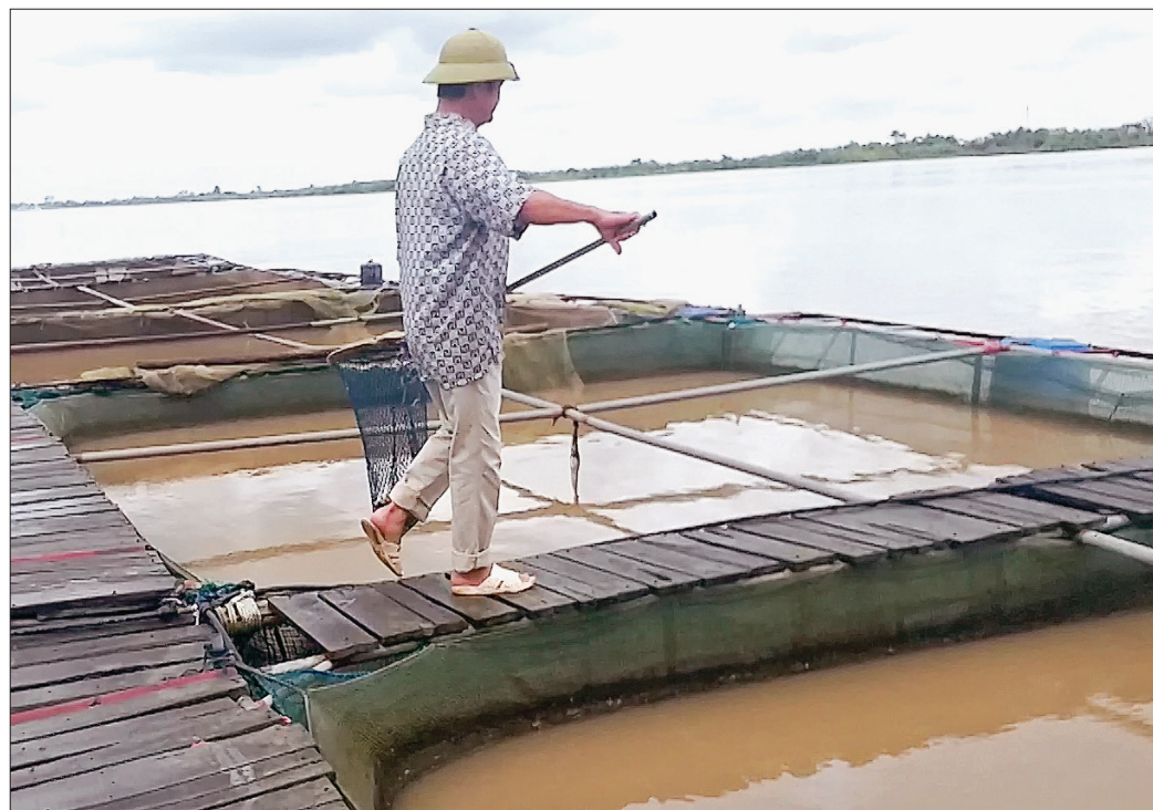
Ông Chiếu vớt cá chết trong lồng để tránh phát sinh dịch bệnh cho cá.