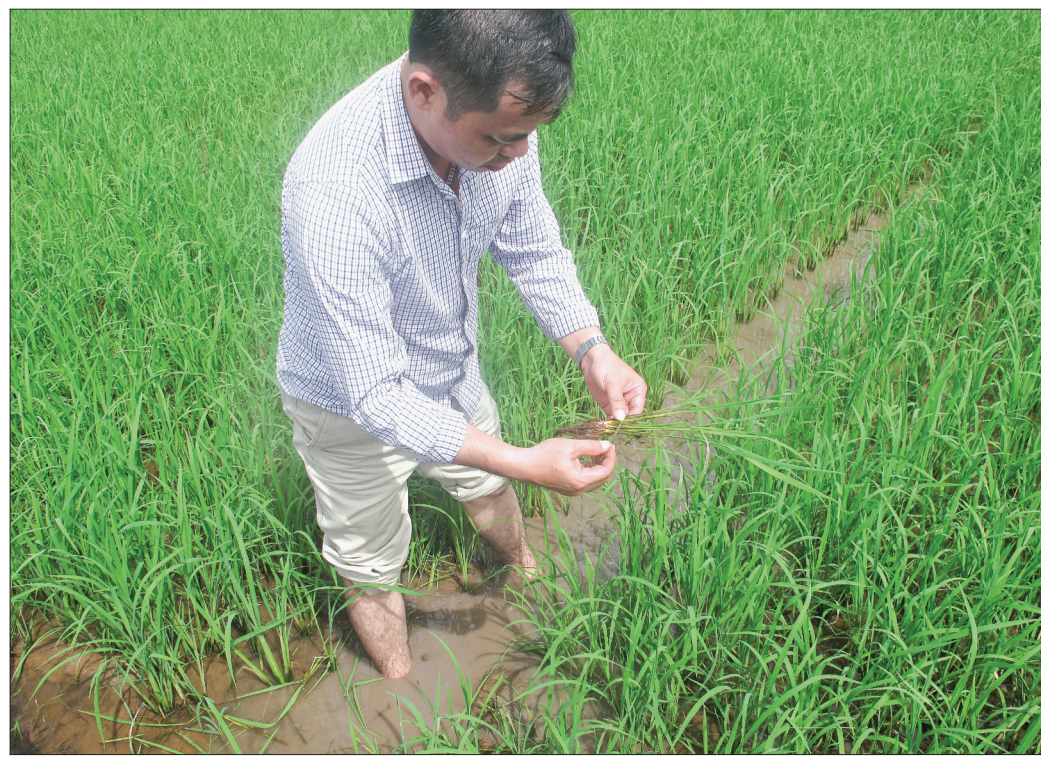
Cán bộ HTX SXKD DVNXX Lê Lợi (Kiến Xương) kiểm tra sinh trưởng, phát triển của lúa mùa.

tích được phun trừ khoảng trên 50.000ha. Vụ mùa năm nay, rầy lưng trắng ở giai đoạn đầu vụ phát sinh với mật độ cao, diện phân bố rộng, đặc biệt sau bão số 3, mật độ rầy nâu, rầy lưng trắng gia tăng. Từ đầu vụ đến nay, Chi cục Trồng trọt và Bảo vệ thực vật đã tiến hành 6 đợt phân tích mẫu rầy với tổng số 311 mẫu; 4 mẫu lúa; trong đó 38/311 mẫu dương tính với virus lùn sọc đen, tập trung ở hai huyện Tiên Hải và Thái Thụy. Tuy nhiên, theo đánh giá của ngành Nông nghiệp, hầu hết nông dân chưa áp dụng biện pháp tiêu hủy cây lúa bị bệnh lùn sọc đen, gây khó khăn lớn trong nỗ lực khống chế bệnh lây lan diện rộng. Cùng với đó, mật độ rầy qua kiểm tra ở một số địa phương vẫn còn ở mức cao, nguy cơ truyền bệnh còn rất lớn, nhất là đối với trên 8.500ha lúa gieo cấy sau ngày 20/7 tập