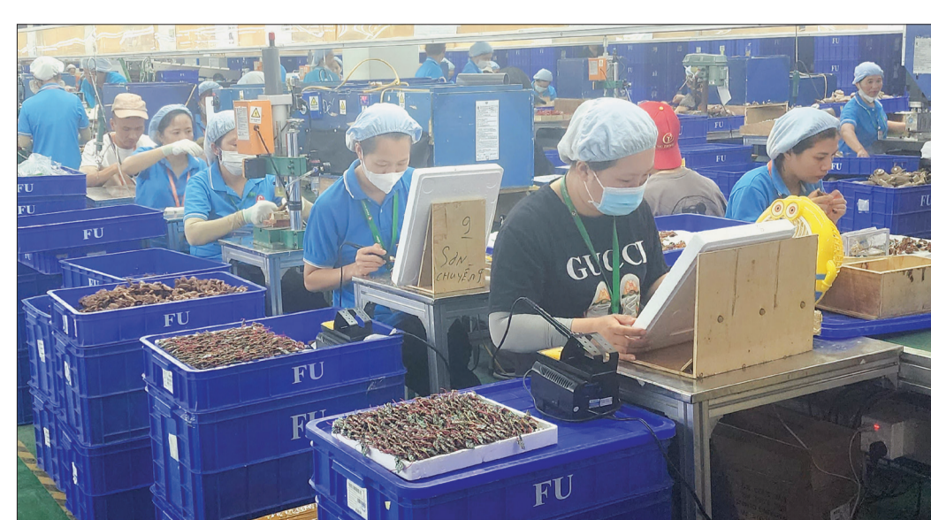
Việc thành lập tổ chức công đoàn giúp Công ty TNHH Kỹ thuật hoạt hình First Union Việt Nam (cụm công nghiệp Thụy Sơn, Thái Thụy) chăm lo tốt hơn cho người lao động.

viên theo hướng linh hoạt, chủ động, đơn giản về thủ tục; kịp thời quan tâm chăm lo, bảo vệ quyền và lợi ích hợp pháp, chính đáng của người lao động. Tổ chức đa dạng các chương trình phúc lợi, các hoạt động nâng cao đời sống tinh thần cho đoàn viên tại cơ sở, từ đó tập hợp, thu hút người lao động tham gia tổ chức công đoàn.