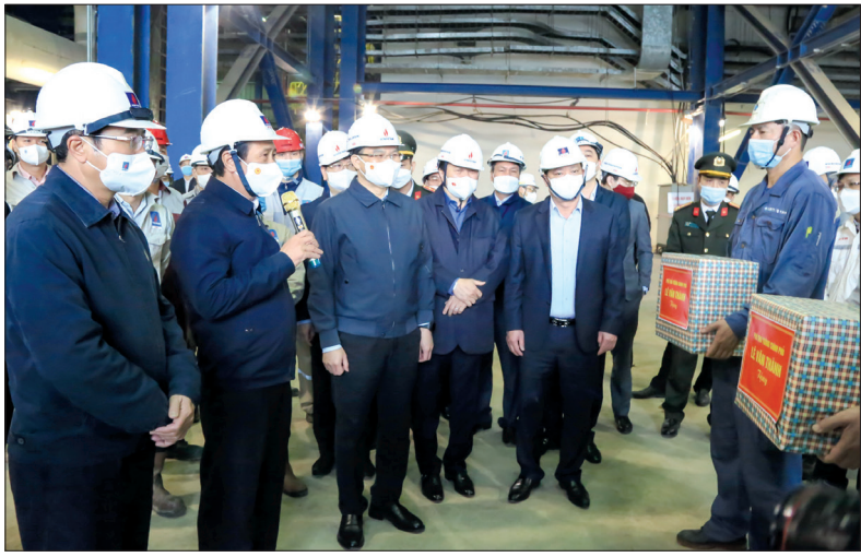
Phó Thủ tướng Lê Văn Thành động viên cán bộ, kỹ sư, công nhân đang thi công Nhà máy nhiệt điện Thái Bình 2.

không được để thiếu vật tư, thiết bị đối với công tác lắp đặt, chạy thử các hệ thống; không được để thiếu tài chính, nhất là khi dự án đang vào giai đoạn nước rút, đẩy nhanh tiến độ. Ban Quản lý dự án Nhà máy nhiệt điện Thái Bình 2 và nhà thầu phải có giải pháp bù tiến độ bằng phương án bố trí thi công 3 ca; đồng thời, cần tập trung chăm lo đời sống cho người lao động; có phương án hợp lý cho công nhân ở lại công trường làm việc và những công nhân về quê ăn tết. Bên cạnh đẩy nhanh tiến độ, các đơn vị phải đặc biệt chú trọng công tác bảo đảm an toàn trong thi công, lắp đặt, chạy thử và vận hành nhà máy. Phó Thủ tướng yêu cầu phải tổ chức lực lượng chuyên về bảo đảm an toàn để thường xuyên kiểm tra tất cả các công đoạn, hệ thống, nếu thấy mất an toàn phải cho dừng ngay bởi an toàn lao động là việc vô cùng quan trọng, quyết định đến tiến độ dự án.