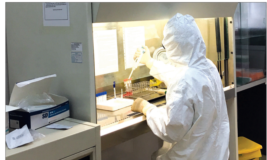
Cán bộ Khoa Xét nghiệm, Chẩn đoán hình ảnh, Thăm dò chức năng (Trung tâm Kiểm soát bệnh tật tỉnh) xử lý mẫu bệnh phẩm.