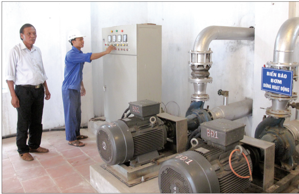
Công nhân nhà máy nước sạch Đông Huy (Đông Hưng) vận hành trạm bơm nước.

Thái Bình là tỉnh đông dân, với gần 1,9 triệu người, trong đó khu vực nông thôn chiếm gần 80%. Tuy được tiếp cận nhiều nguồn vốn như: vốn chương trình mục tiêu quốc gia, vốn vay Ngân hàng Thế giới... để triển khai thực hiện đưa nước sạch về nông thôn nhưng đến năm 2012, toàn tỉnh mới chỉ đầu tư xây dựng được 66 công trình cấp nước sạch, tổng vốn đầu tư hơn 613 tỷ đồng, cấp nước sạch cho 21% dân số. Mặc dù nguồn vốn đầu tư lớn nhưng chỉ sau một thời gian đi vào vận hành và sử dụng, nhiều công trình nước sạch đã bộc lộ hạn chế, một số công trình bỏ không và phải ngừng hoạt động, gây lãng phí ngân sách nhà nước. Vì vậy, mục tiêu để 100% người dân được sử dụng nước sạch luôn là bản khoản, trọng tâm của cấp ủy, chính quyền các cấp. Trước thực trạng đó, Thái Bình đã quyết định thành lập Ban Chỉ đạo triển khai thực hiện dự án đầu tư các công trình cấp nước sạch nông thôn tỉnh, phân công nhiệm vụ cụ thể cho từng thành viên; đồng thời, lựa chọn giải pháp chuyển nhượng các công trình cấp nước sạch tập trung nông thôn được đầu tư từ nguồn vốn vay Ngân hàng Thế giới và vốn chương trình mục tiêu quốc gia nhằm hướng tới mục tiêu nâng cao chất lượng cấp nước sạch cho nhân dân. Cùng với đó, UBND tỉnh đã ban hành Quyết định số 12/2012/QĐ-UBND ngày 2/8/2012, Quyết định số 19/2014/QĐ-UBND ngày 24/9/2014, Quyết định số 1718/QĐ-UBND ngày 31/7/2015 của UBND tỉnh về cơ chế, chính sách