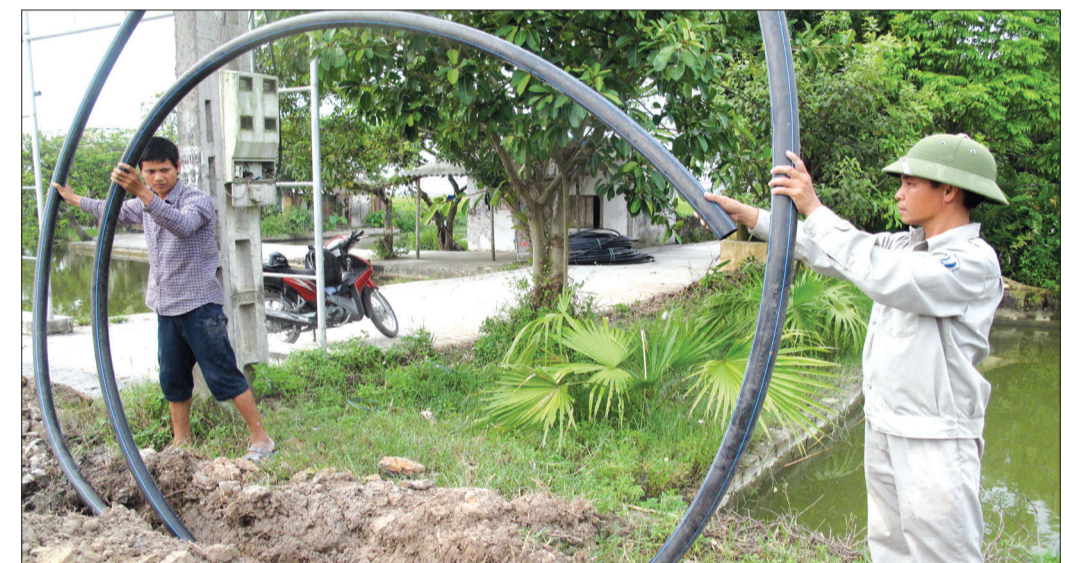
Công ty Cổ phần Nước sạch Hưng Hà tổ chức lắp đặt đường ống cấp nước trong phạm vi vùng dự án.