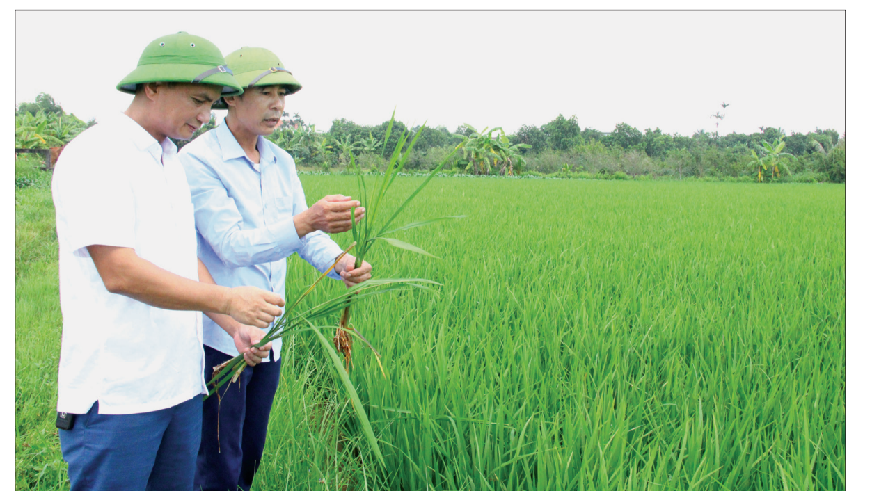
Cán bộ Phòng Nông nghiệp và Phát triển nông thôn và xã Đông Cường kiểm tra tình hình sâu bệnh trên đồng ruộng.