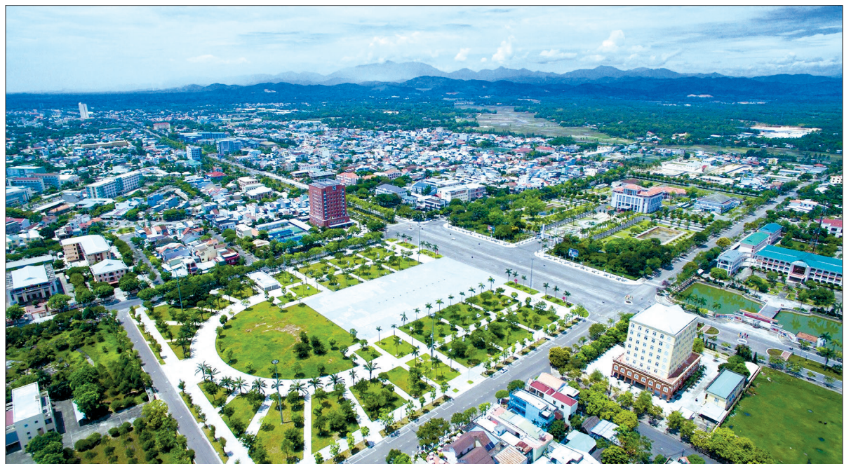
Thành phố Tam Kỳ, tỉnh Quảng Nam.

(chinhphu.vn) Việc phát triển đô thị thông minh, gắn với bảo vệ môi trường đang trở thành xu thế phát triển của thời đại.