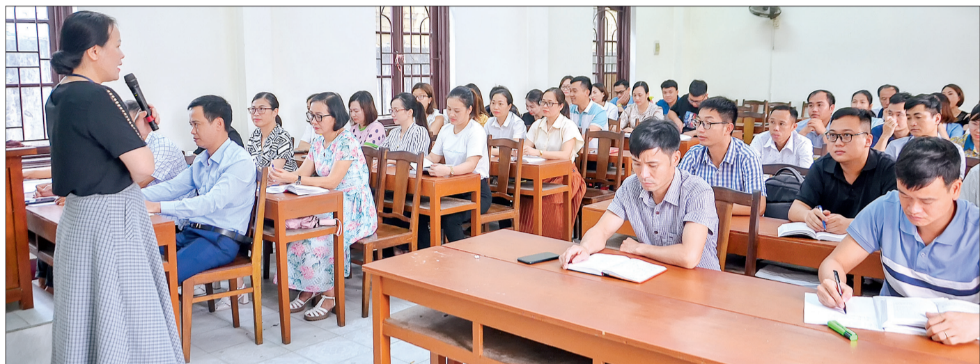
Trường Chính trị tỉnh thường xuyên đổi mới chương trình, nội dung đào tạo, bồi dưỡng theo hướng chọn lọc, thiết thực, phù hợp với từng đối tượng.

Quán triệt sâu sắc tư tưởng của Chủ tịch Hồ Chí Minh: “Huấn luyện cán bộ là việc gốc của Đảng” và nhiệm vụ trọng tâm Nghị quyết Đại hội Đảng bộ tỉnh lần thứ XX để ra, từ đầu nhiệm kỳ đến nay, cấp ủy, chính quyền các cấp trong tỉnh thường xuyên quan tâm, chú trọng công tác đào tạo, bồi dưỡng cán bộ, qua đó góp phần xây dựng đội ngũ cán bộ các cấp đủ phẩm chất, năng lực và uy tín, đáp ứng yêu cầu nhiệm vụ trong giai đoạn mới.