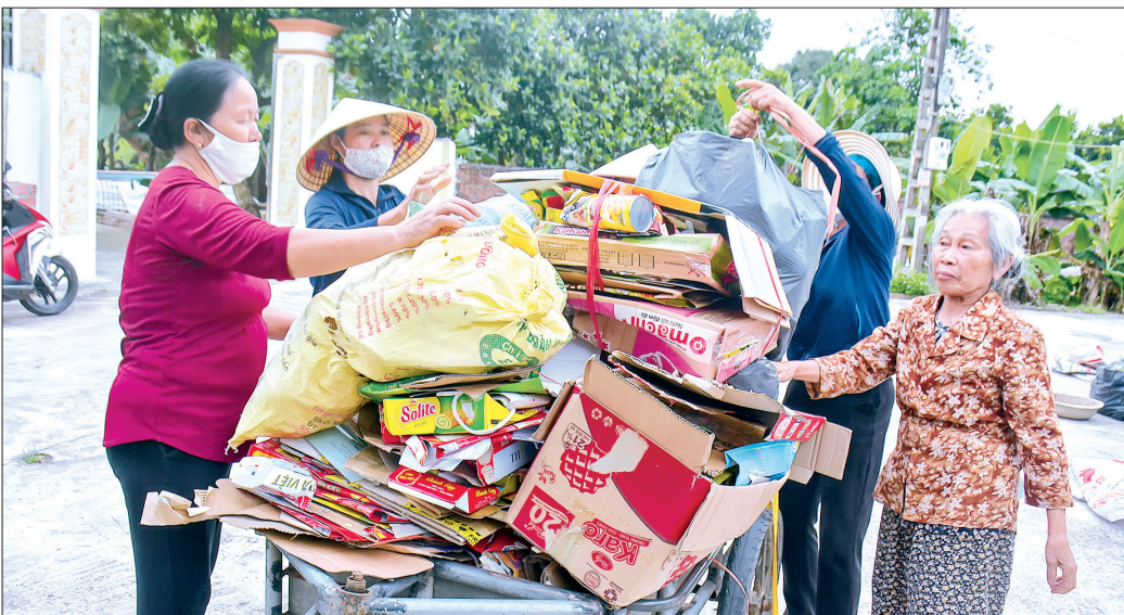
Phụ nữ thôn Cốc, xã Phú Châu (Đông Hưng) thực hiện mô hình biến rác thành tiền giúp trẻ mồ côi và phụ nữ có hoàn cảnh đặc biệt khó khăn.