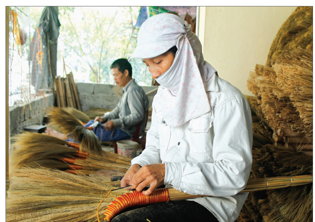
Nghề sản xuất chổi dót tạo việc làm, nâng cao thu nhập cho người dân Tam Quang (Vũ Thư).