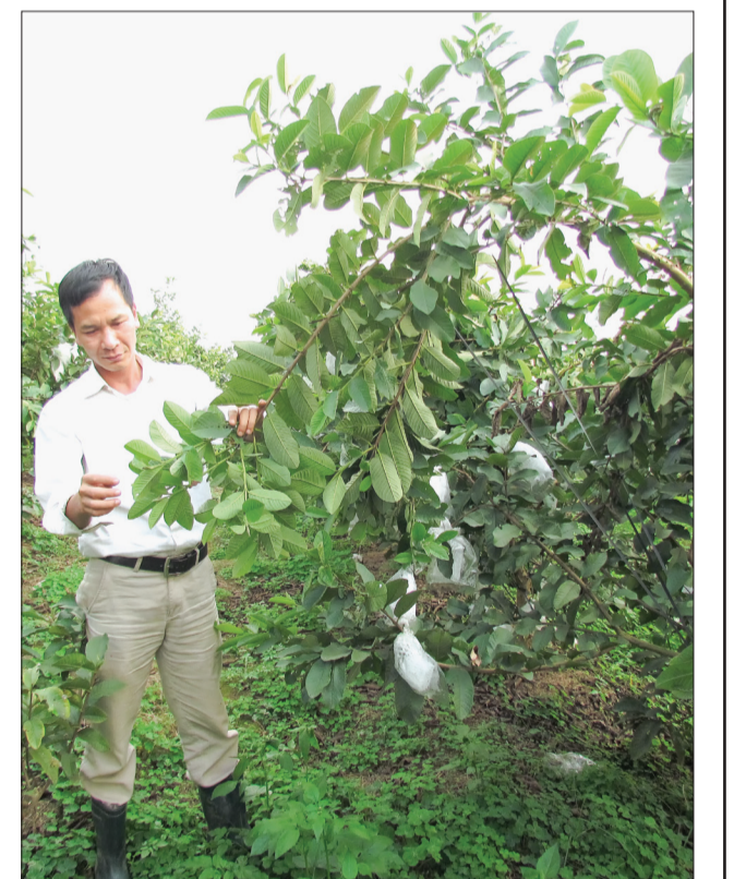
Nông dân xã Hồng An (Hưng Hà) sản xuất trên vùng đất bãi.