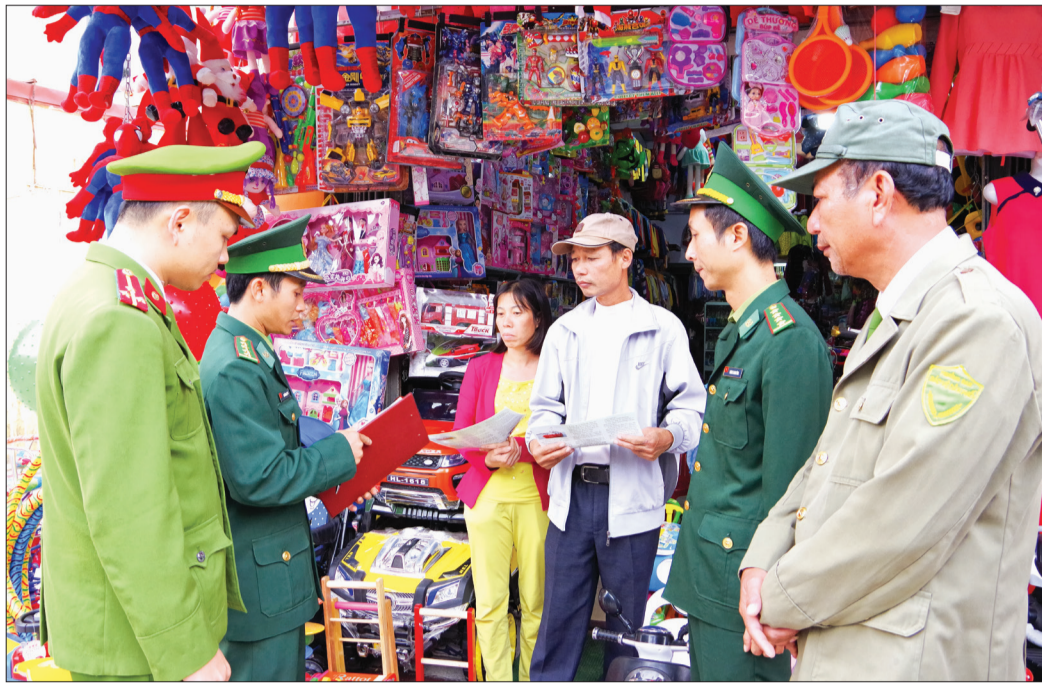
Bộ đội Biên phòng tỉnh phối hợp Công an huyện Thái Thụy vận động các hộ kinh doanh ký cam kết thực hiện Pháp lệnh số 16, Nghị định số 36.

Năm 2017, thực hiện phong trào thi đua quyết thắng với chủ đề "Hiệu quả, kỷ cương, quyết thắng" gắn với cuộc vận động phát huy truyền thống, cống hiến tài năng, xứng danh Bộ đội Cụ Hồ, đẩy mạnh học tập và làm theo tư tưởng, đạo đức, phong cách Hồ Chí Minh, Đảng ủy, Bộ Chỉ huy Bộ đội Biên phòng (BĐBP) tỉnh đã lãnh đạo, chỉ đạo các đơn vị trực thuộc đẩy mạnh phong