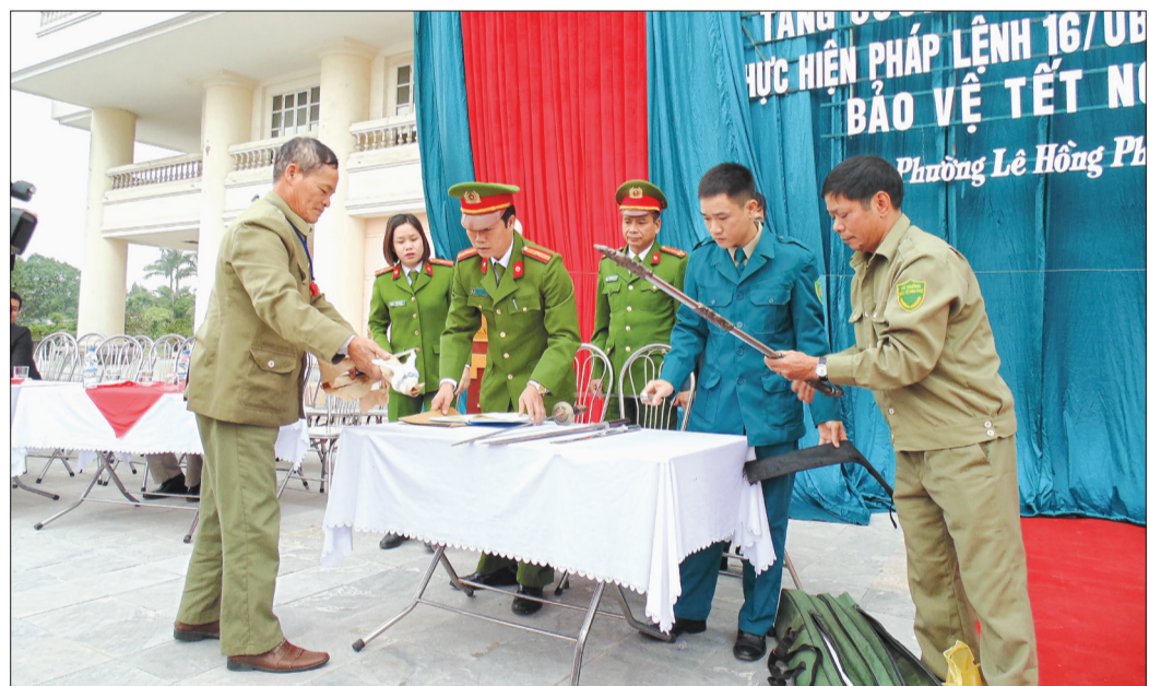
Lực lượng bảo vệ dân phố phường Lê Hồng Phong (thành phố Thái Bình) bàn giao vũ khí, vật liệu nổ cho cơ quan công an.