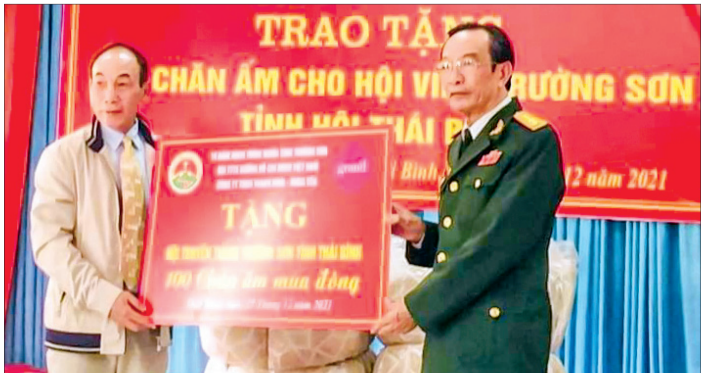
Hội Truyền thống Trường Sơn - Đường Hồ Chí Minh tỉnh Thái Bình tiếp nhận 100 chân ấm tình thương.

Ngày 19/5/1959, Thường trực Tổng Quân ủy chính thức giao nhiệm vụ cho “Đoàn công tác quân sự đặc biệt” làm nhiệm vụ mở đường vận chuyển hàng quân sự vào miền Nam, tổ chức đưa đón bộ đội, chuyển công văn, tài liệu từ miền Bắc vào miền Nam và ngược lại. Để hoàn thành nhiệm vụ, Tổng Quân ủy, Bộ Quốc phòng quyết định biên chế bước đầu của Đoàn là 500 cán bộ, chiến sĩ. Ngoài Đoàn bộ, Đoàn được tổ chức thành Tiểu đoàn vận tải bộ 301 và các bộ phận: Xây dựng kho, bao gói hàng, sửa chữa vũ khí, chế biến thực phẩm. Ra đi tháng 5/1959, Đoàn được mang phiên hiệu Đoàn 559. Con đường được khai sinh đúng ngày sinh của Bác Hồ kính yêu nên được mang tên đường Hồ Chí Minh.