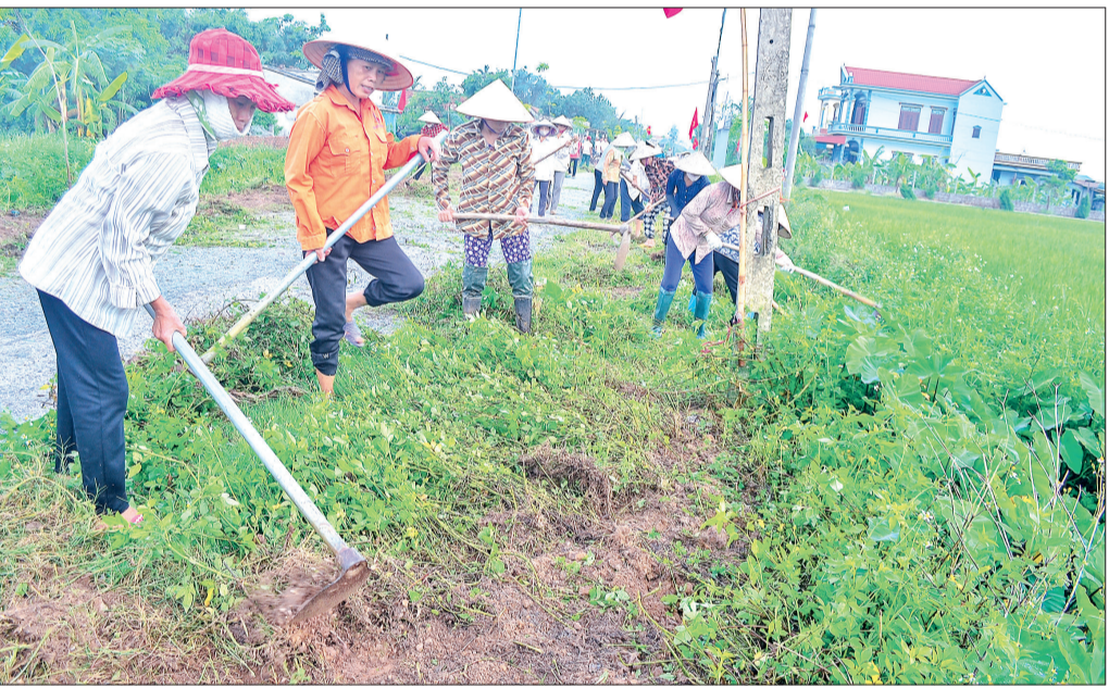
Vệ sinh đường làng ngõ xóm là việc làm thường xuyên của phụ nữ Thái Bình.