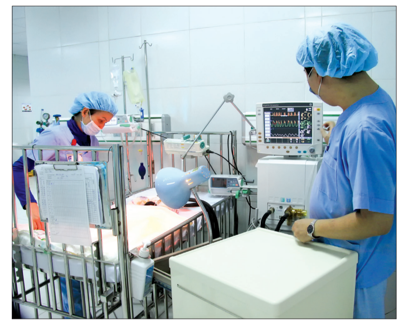
Bác sĩ Bệnh viện Nhi trung ương chuyển giao kỹ thuật mới cho bác sĩ Bệnh viện Nhi Thái Bình.

Từ chỗ chỉ thực hiện các kỹ thuật nội nhi, đến nay Bệnh viện đã thực hiện được 60% tổng số các kỹ thuật theo phân tuyến, ứng dụng nhiều dịch vụ kỹ thuật mới trong chẩn đoán, điều trị bệnh, bảo đảm hoạt động hiệu quả cả về nội, ngoại, ba chuyên khoa và cận lâm sàng. Khoa Ngoại - Phẫu thuật gây mê hồi sức là khoa luôn có nhiều bệnh nhân nặng, trước đây nhiều