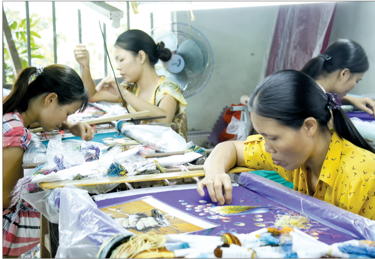
Nghề thủ góp phần nâng cao thu nhập cho người dân Minh Lăng.

Nằm bên dòng sông Trà Lý hiền hòa, mảnh đất Nội Lăng, Thu Trì xưa tựa như một cô gái đẹp nhưng sớm chịu cảnh đói rách, lâm than bởi sự giào xéo của phong kiến, thực dân. Nhờ giác ngộ cách mạng, một lòng kiên trung theo Đảng, diện mạo nông thôn Minh Lăng ngày nay đổi mới khang trang, đời sống vật chất và tinh thần của nhân dân được nâng cao rõ rệt.