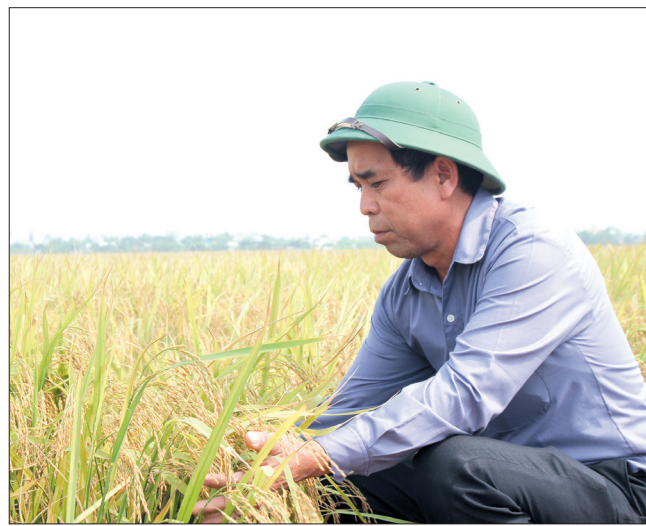
Nông dân xã Tây Tiến (Tiền Hải) kiểm tra giống lúa T10 có liên kết với doanh nghiệp sản xuất và bao tiêu sản phẩm.