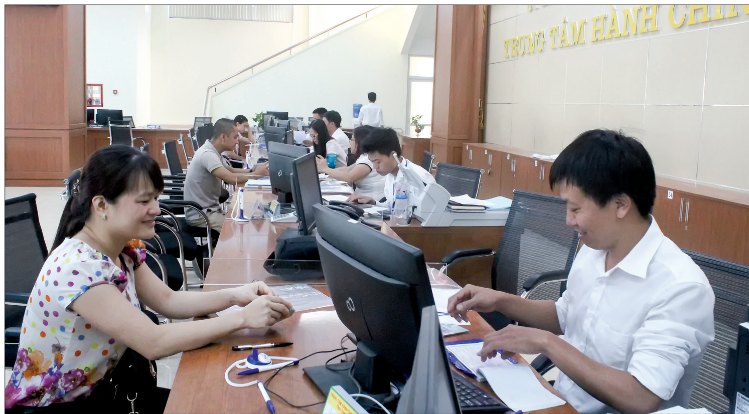
Cán bộ Trung tâm Hành chính công tỉnh hướng dẫn công dân hoàn thiện hồ sơ thủ tục hành chính.

Thực hiện chủ trương của Đảng, Nhà nước về cải cách tổ chức bộ máy hành chính nhà nước gắn với địa phương, những năm qua, Thái Bình đã tập trung rà soát vị trí, chức năng, nhiệm vụ, quyền hạn các cơ quan chuyên môn thuộc cấp tỉnh, cấp huyện. Tỉnh cũng chỉ đạo sắp xếp tổ chức bộ máy hành chính của UBND các cấp theo hướng tinh gọn, hiệu quả, nhờ đó cơ bản khắc phục được tình trạng chồng chéo, thực hiện tốt nhiệm vụ được giao.