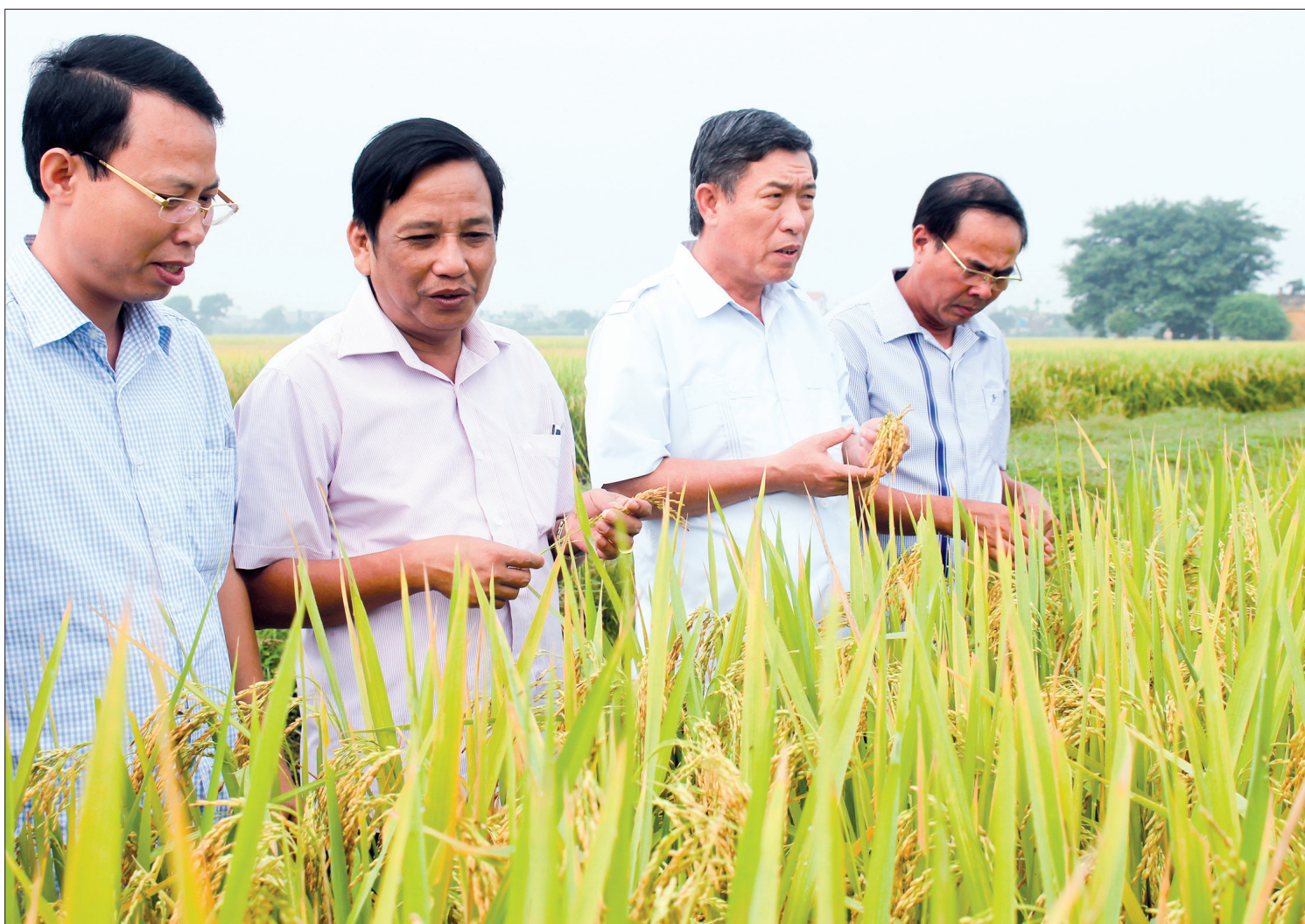
Các đồng chí lãnh đạo tỉnh, huyện Tiên Hải và doanh nghiệp kiểm tra giống lúa mới khảo nghiệm tại xã Bắc Hải (Tiên Hải).