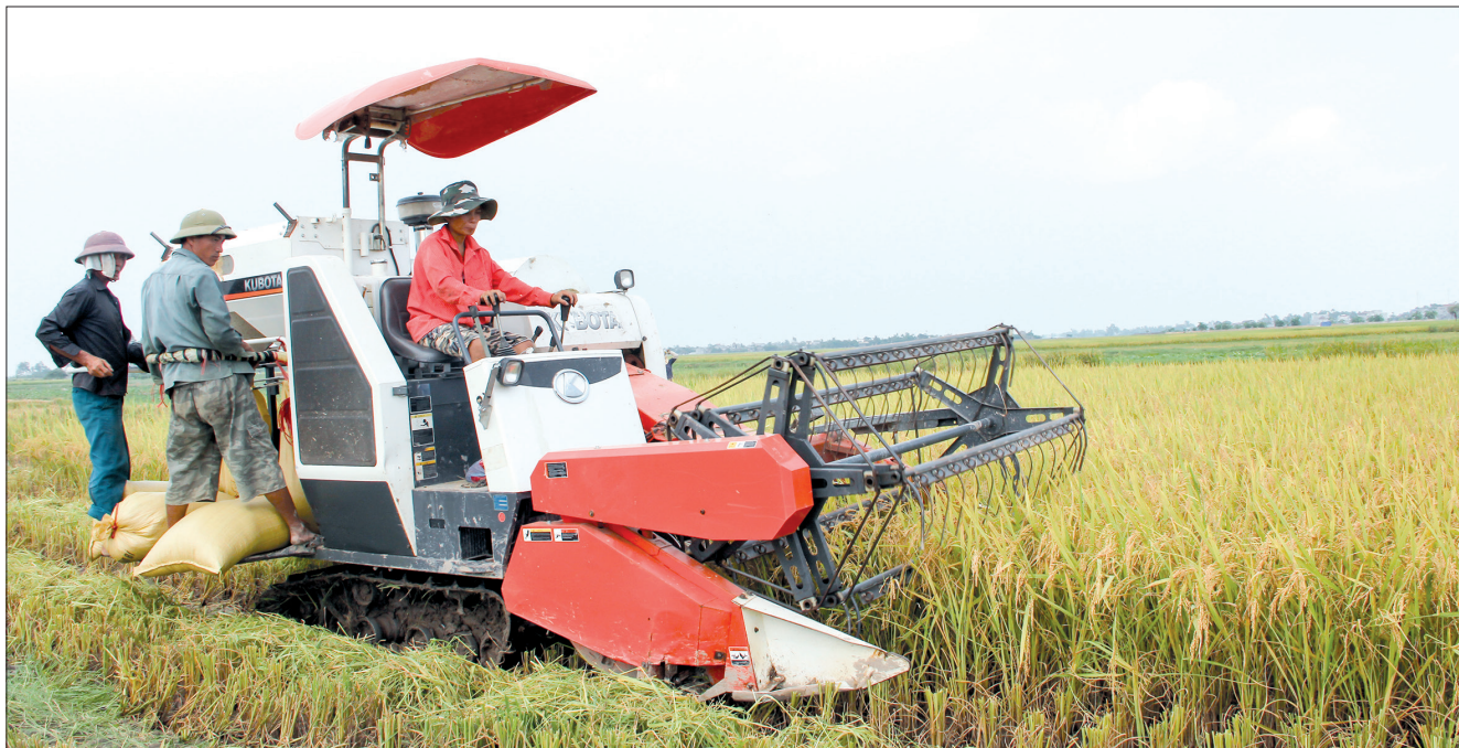
Nông dân xã Tây Đô (Hưng Hà) thu hoạch lúa.

biết: Thái Bình chưa xây dựng được thương hiệu gạo là do việc liên kết giữa các doanh nghiệp, hộ nông dân trong tổ chức sản xuất, tiêu thụ theo hợp đồng còn hạn chế dẫn đến khó khăn cho việc quản lý