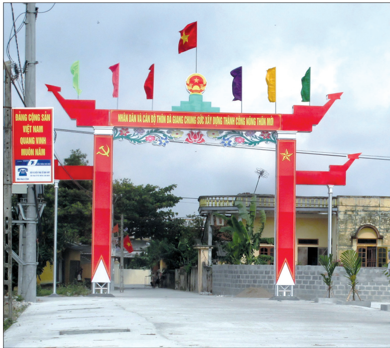
Diện mạo nông thôn mới xã Nguyên Xá (Dông Hưng).

Từ khi có Đảng, dân theo Đảng làm Cách mạng Tháng Tám, kháng chiến chống Pháp, chống Mỹ cứu nước. Sau ngày đất nước hòa bình, thống nhất, Đảng tiến hành công cuộc xây dựng và bảo vệ Tổ quốc. Trong kháng chiến chống Mỹ, bộ đội ta có câu: Tư tưởng không thông đeo bình tông không nổi, vượt Trường Sơn bằng đầu, bằng ý chí, nghị lực và quyết tâm, bằng lý tưởng cao đẹp của tuổi trẻ: "Cuộc đời đẹp nhất là trên trận tuyến đánh quân thù". Những năm 1985 - 1990, Liên Xô và Đông Âu tan rã, sụp đổ - đất nước ta vẫn trụ vững, thế và lực ngày một phát triển bởi dân đồng tình theo Đảng "Đổi mới": Đổi mới tư duy, đổi mới tư duy kinh tế trước. Hơn bao giờ hết, Đảng ta quan niệm: Công tác