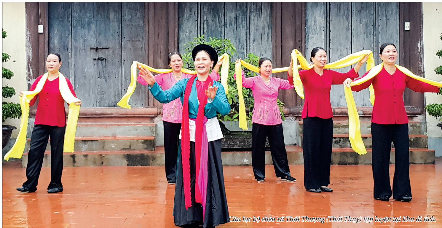
Câu lạc bộ chèo xã Thái Thượng (Thái Thụy) tập luyện tại khu di tích.

Với phương châm sống vui - sống khỏe - sống có ích, những năm qua, người cao tuổi tham gia ngày càng tích cực vào phong trào văn hóa văn nghệ tại địa phương. Điều đó không chỉ góp phần gìn giữ những giá trị văn hóa truyền thống, mà còn đem lại sức sống mới trong việc xây dựng đời sống văn hóa ở cơ sở.