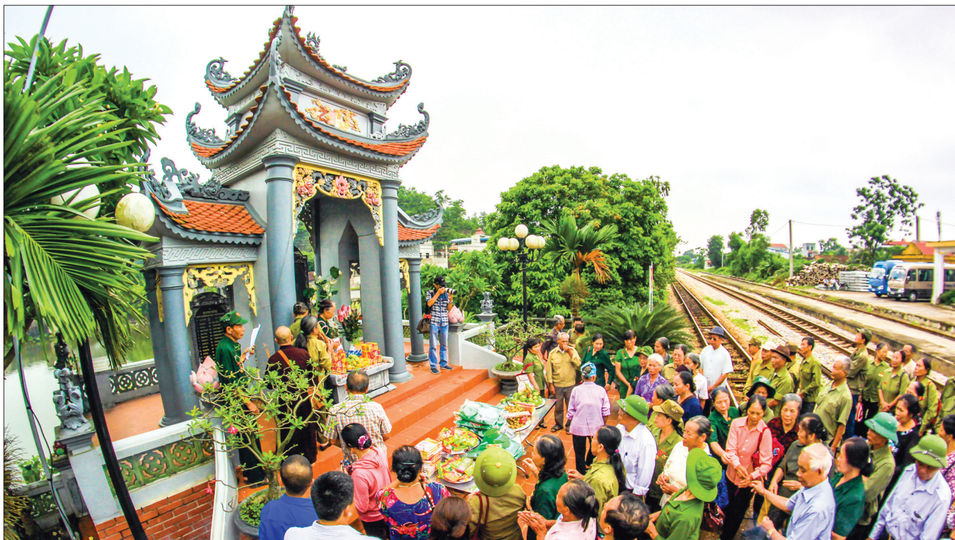
Đoàn Cựu thanh niên xung phong C895, N89 huyện Hưng Hà tưởng niệm các anh hùng liệt sĩ đã anh dũng hy sinh ngày 20/8/1966 tại ga Gôi (Nam Định) nhân kỷ niệm 70 năm ngày Thương binh - Liệt sĩ (27/7/1947 - 27/7/2017).

Thời điểm giữa thập kỷ 60 của thế kỷ XX, những thiếu nữ “tóc dài chấm lưng thon” nết na, xinh đẹp ở đất Diên Hà - Thần Khê nghe theo tiếng gọi thiêng liêng của Tổ quốc “Đâu cần thanh niên có, đâu khó có thanh niên” đã hăng hái tham gia thanh niên xung phong với mong muốn được hiến dâng sức trẻ của mình trên trận tuyến đánh quân xâm lược. Hơn 50 năm qua đi, có người nằm lại nơi chiến trường, có người “rẽ bước sang ngang” tu hành Phật pháp, có người yên phận về quê... Dẫu năm tháng phai pha mỗi người một hoàn cảnh, một số phận nhưng với họ, kỷ niệm giây phút sát cánh bên nhau sẵn sàng lấy thân mình che bom đạn quân thù cho đồng đội lại thổi bùng lửa thiêng rực cháy trong trái tim thanh niên xung phong...