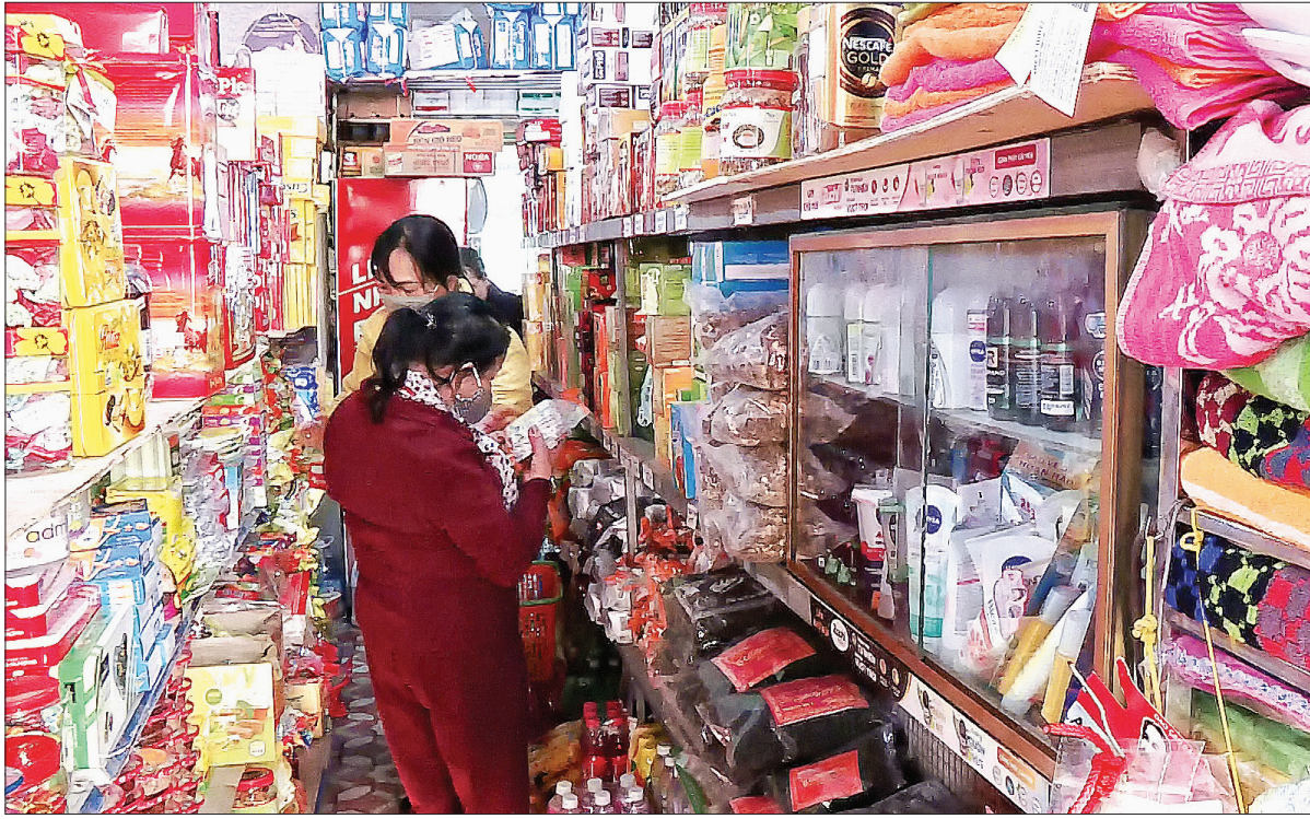
Còn gần 1 tháng nữa mới đến Tết Nguyên đán Tân Sửu 2021 nhưng thị trường đã bắt đầu sôi động.

Theo quy luật, dịp trước, trong và sau Tết Nguyên đán luôn là thời điểm nhạy cảm, tội phạm buôn lậu, gian lận thương mại và hàng giả có nguy cơ gia tăng gây xáo trộn thị trường và ảnh hưởng nghiêm trọng đến quyền lợi người tiêu dùng. Xác định được điều đó, các lực lượng chức năng đã sớm triển khai nhiều biện pháp đấu tranh hiệu quả.