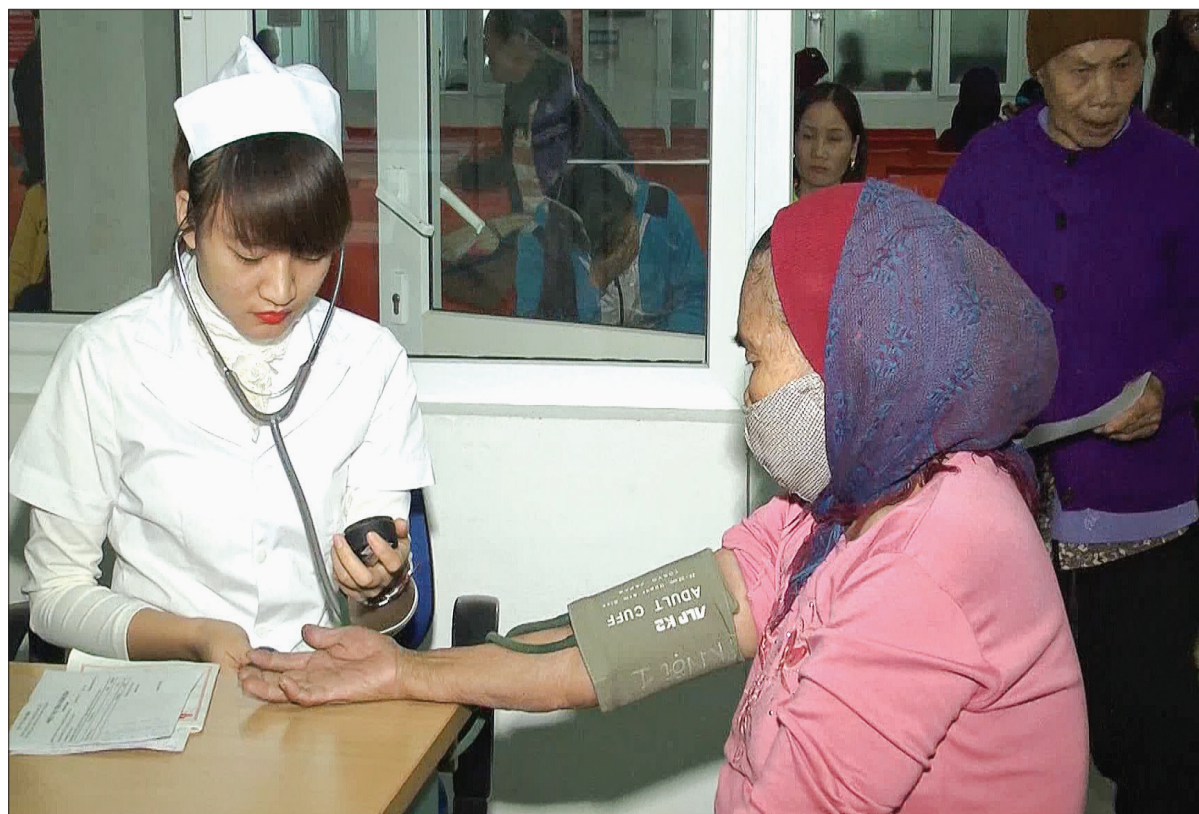
Kiểm tra sức khỏe cho người cao tuổi.

B ội chi quỹ khám chữa bệnh (KCB) bảo hiểm y tế (BHYT) không phải là vấn đề mới bởi việc này đã diễn ra trong nhiều năm. Tuy nhiên, khi số chi vượt quỹ ngày càng cao, đòi hỏi các cấp, các ngành, đơn vị, đặc biệt là ngành Bảo hiểm xã hội và ngành Y tế cần có những giải pháp quyết liệt hơn nữa. 9 tháng đầu năm 2017, toàn tỉnh đã chi vượt quỹ KCB BHYT khoảng 500 tỷ đồng, cao hơn mức bình quân chung của cả nước. Hầu hết các cơ sở KCB trong tỉnh đều chi vượt quỹ KCB BHYT. Theo Bảo hiểm xã hội tỉnh, có nhiều nguyên nhân dẫn đến tình trạng này như việc điều chỉnh giá dịch vụ y tế và chỉ định rộng rãi các xét nghiệm, chẩn đoán hình ảnh, các dịch vụ phục hồi chức năng... Một số trường hợp chỉ định bệnh nhân điều trị nội trú chưa đúng với tính chất của bệnh; việc lựa chọn và sử dụng thuốc, vật tư y tế chưa tiết kiệm. Thực hiện thông tuyến KCB cho người có thể BHYT nhằm tạo điều kiện thuận lợi cho người dân khi đi KCB song mặt trái là có những người đi khám nhiều lần tại các cơ sở KCB khác nhau. 9 tháng đầu năm, toàn tỉnh có 141 bệnh nhân khám và điều trị trên 10 lần, trong đó 1 bệnh nhân khám và điều trị 84 lần với số tiền trên 9 triệu đồng, 1 bệnh nhân khám và điều trị 58 lần với số tiền hơn 5,2 triệu đồng, 1 bệnh nhân khám và điều trị