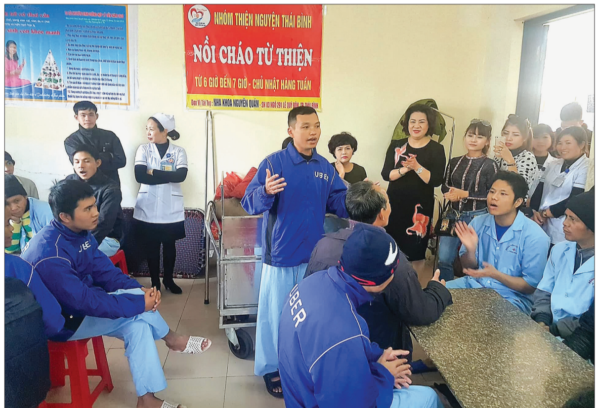
Đoàn từ thiện và bệnh nhân Bệnh viện Tâm thần Thái Bình cùng giao lưu văn nghệ nhân dịp tết dương lịch.