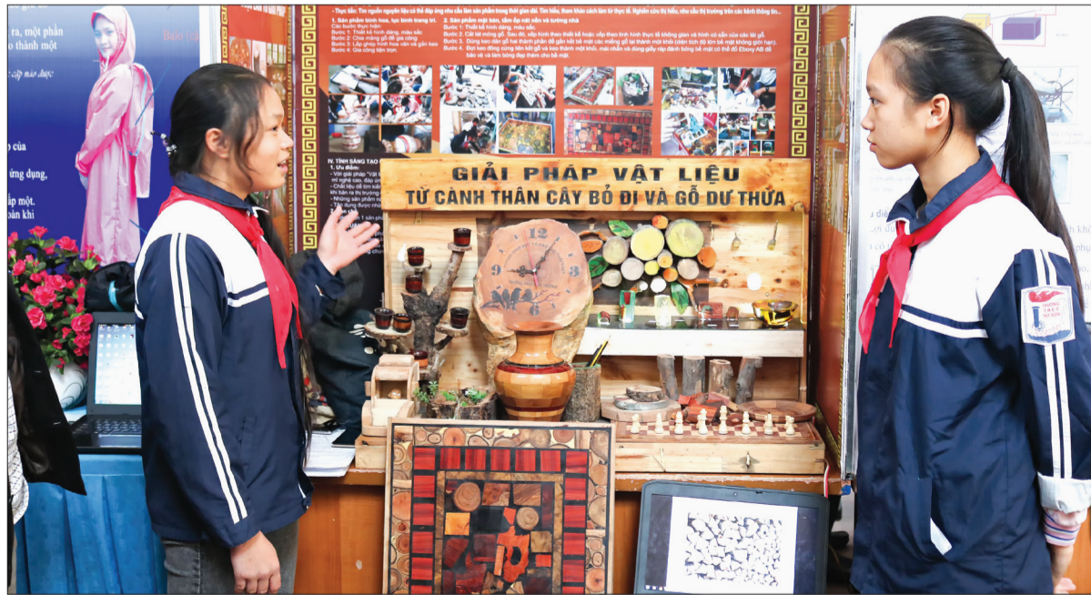
Giải pháp vật liệu từ cành cây, thân cây bỏ đi và gỗ dư thừa của nhóm học sinh Trường THCS Thụy Trường (Thái Thụy).