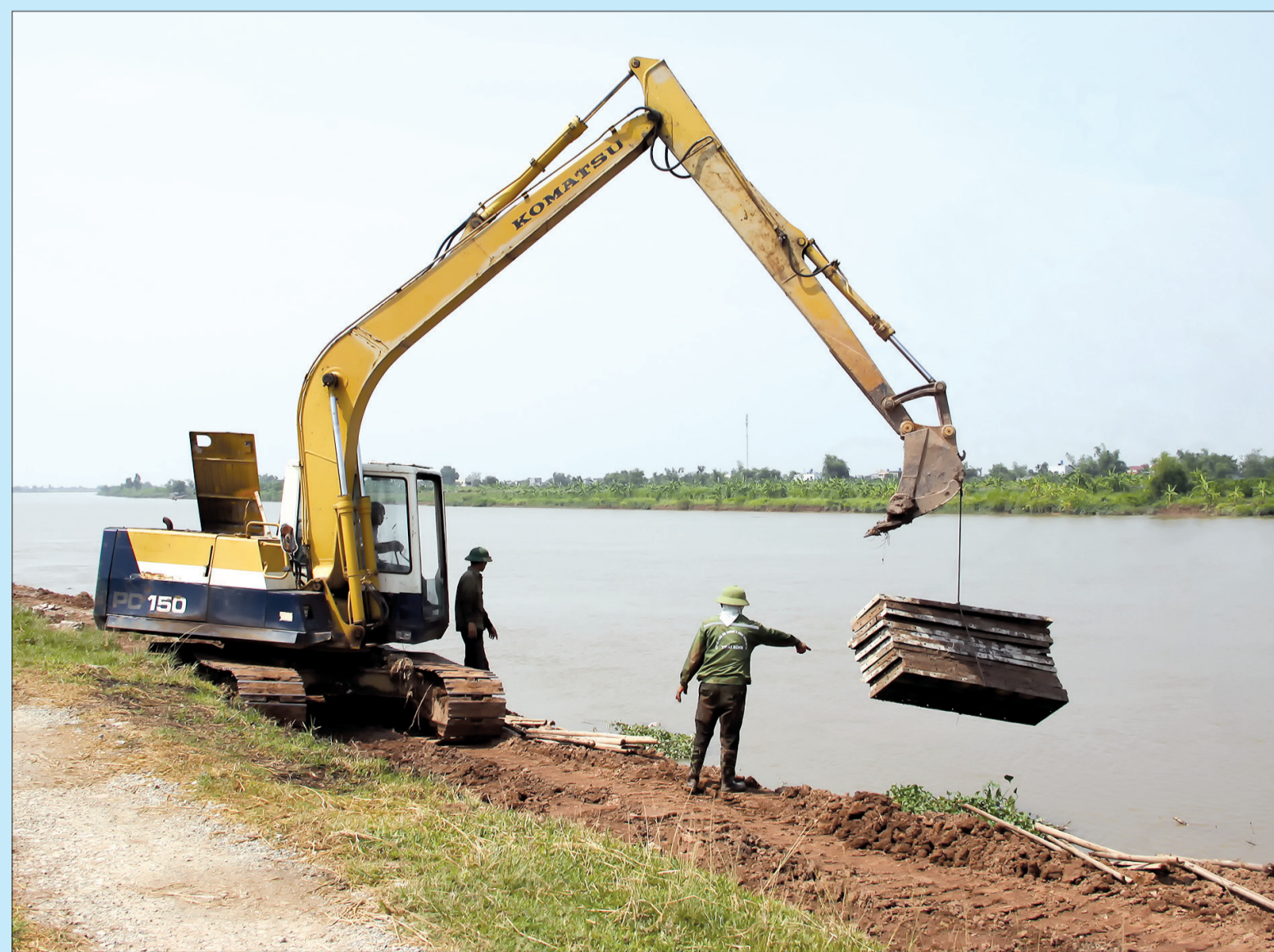
Thi công kè Thái Phúc, từ K46+650 đến K47+200 đề tài Trà Lý, đoạn qua địa phận xã Thái Phúc (Thái Thụy).