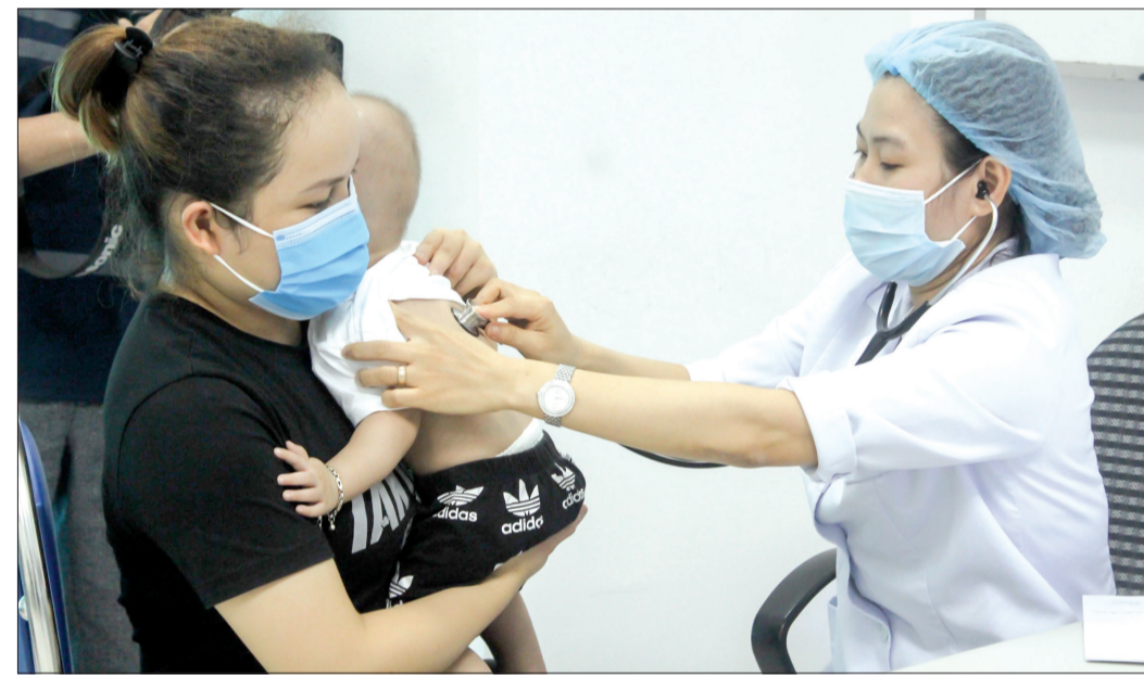
Khám chữa bệnh bảo hiểm y tế tại Bệnh viện Nhi Thái Bình.