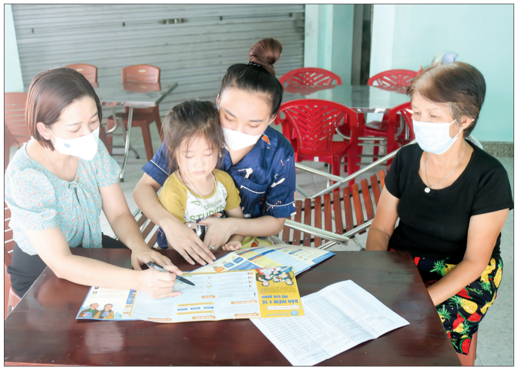
Cán bộ Bảo hiểm xã hội huyện Đông Hưng tuyên truyền chính sách bảo hiểm y tế hộ gia đình cho người dân.

Phát triển BHYT hộ gia đình được xem là một trong những giải pháp quan trọng để đạt được mục tiêu BHYT toàn dân. Để hoàn thành nhiệm vụ bao phủ BHYT theo đúng lộ trình kế hoạch được giao, thời gian qua, Bảo hiểm xã hội (BHXH) huyện Đông Hưng đã tích cực triển khai nhiều giải pháp để phát triển loại hình bảo hiểm này.