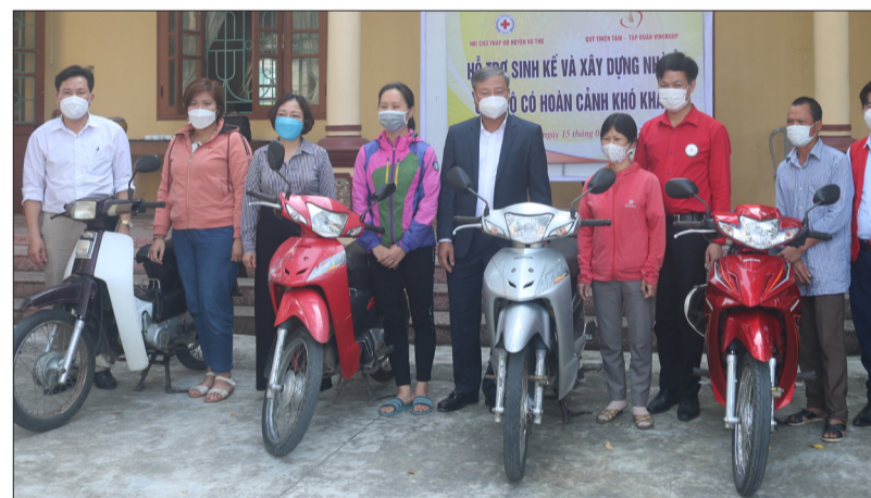
Đại diện các gia đình có hoàn cảnh khó khăn được nhận xe máy từ Quỹ Thiện Tâm (Tập đoàn Vingroup).

Sáng ngày 15/3, Hội Chữ thập đỏ huyện Vũ Thư tổ chức trao kinh phí hỗ trợ sinh kế và xây dựng nhà ở cho các gia đình có hoàn cảnh khó khăn tại 3 xã: Tân Hòa, Song An, Minh Quang. Căn cứ điều kiện thực tế của từng gia đình, Hội Chữ thập đỏ huyện Vũ Thư đã trao kinh phí hỗ trợ xây dựng, sửa chữa 5 ngôi nhà tổng trị giá 145 triệu đồng; 5 chiếc xe máy tổng trị giá 50 triệu đồng; 1 con bò giống và đàn gà giống tổng trị giá