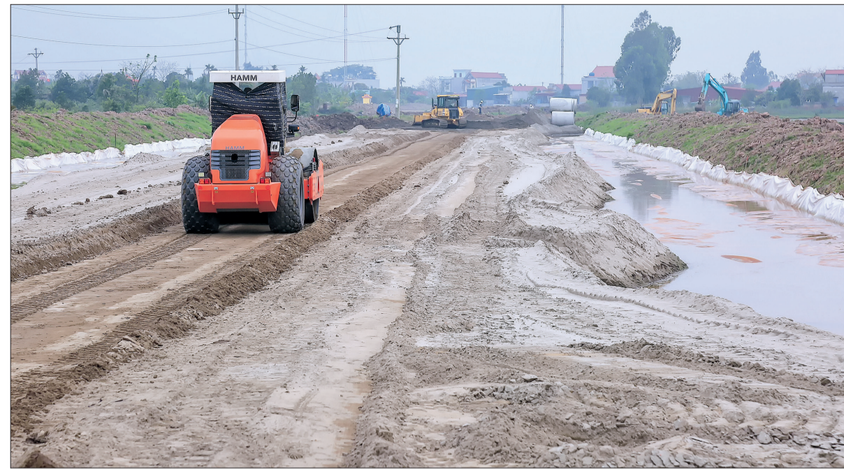
Tuyến đường từ thành phố Thái Bình đi cầu Nghìn đoạn qua địa bàn huyện Quỳnh Phụ đang được nhà thầu tập trung thi công.

các nhà thầu thi công, đồng chí Bí thư Tỉnh ủy đề nghị Ban Quản lý dự án thường xuyên cập nhật, bám sát tình hình thực tiễn, tham mưu UBND tỉnh kịp thời có biện pháp tháo gỡ.