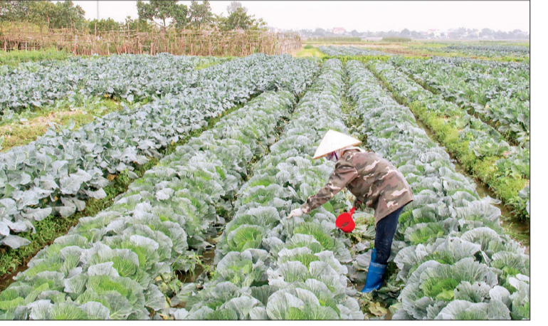
Cánh đồng sản xuất 4 vụ/năm của xã An Châu (Đồng Hưng) mang lại hiệu quả kinh tế cao.

Đến nay, huyện Đồng Hưng đã xây dựng được 37 cánh đồng lớn, cánh đồng sản xuất 4 vụ/năm với tổng diện tích gần 1.500ha, trong đó có 31 cánh đồng lớn với diện tích trên 1.400ha. Trên các cánh đồng lớn và cánh đồng sản xuất 4 vụ/năm, bà con nông dân trồng chủ lực các giống lúa chất lượng cao như BC15, TBR 225, Bắc thơm, cùng với đó là ngô, bí, ớt, khoai tây, bắp cải, su hào... Giá trị sản xuất trên cánh đồng lớn, cánh đồng sản xuất 4 vụ/năm hiệu quả gấp 2 - 3 lần cánh đồng sản xuất truyền thống. Huyện Đồng Hưng đang tập trung chỉ đạo, hướng dẫn xã Đông Tân triển khai thực hiện dự án xây dựng thí điểm mô hình nâng cao giá trị sản xuất lúa chất lượng cao phục vụ thị trường trong nước hướng tới xuất khẩu và xã Mê Linh triển khai thực hiện dự án xây dựng mô hình sản xuất cây khoai tây an toàn, phát triển sản phẩm OCOP. Các mô hình này không chỉ góp phần thực hiện đề án tái cơ cấu ngành nông nghiệp, đẩy mạnh tích tụ ruộng đất, tăng cường mối liên kết 4 nhà mà còn giúp nông dân trên địa bàn huyện biết đầu tư sản xuất nông nghiệp hàng hóa, thu lợi nhuận cao.