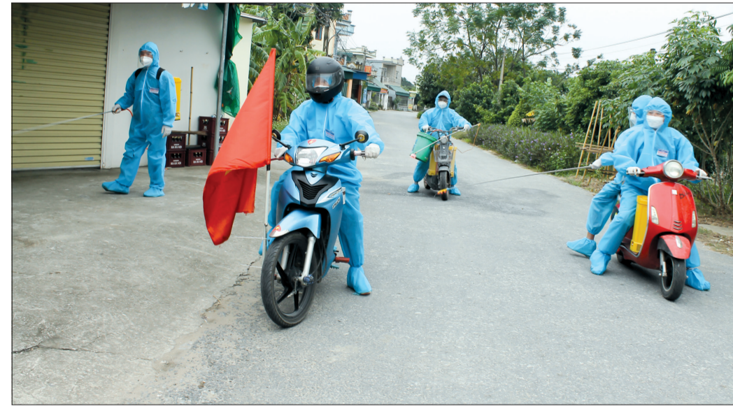
Đội tình nguyện phòng, chống dịch Covid-19 xóm Duy Nhất tổ chức phun khử khuẩn tại địa bàn thôn Kiến Xá.

Với số ca F0 nhiều, tăng nhanh trong cộng đồng, Nguyên Xá (Vũ Thư) là xã duy nhất của tỉnh thuộc "vùng đỏ" trên bản đồ phòng, chống dịch Covid-19. Nằm trong vùng tâm dịch nhưng người dân Nguyên Xá không hoang mang, ngược lại nhiều khu dân cư có cách làm sáng tạo, góp sức cùng cấp ủy, chính quyền triển khai hiệu quả các biện pháp phòng, chống dịch, bảo vệ sức khỏe, Quan. Các địa phương xây dựng phương án sẵn sàng thiết lập các khu thu dung F0 không triệu chứng đưa vào hoạt động khi cần. Các doanh nghiệp tiếp tục thực hiện nghiêm các biện pháp phòng, chống dịch, nhất là khuyến cáo "5K"; chủ động xét nghiệm sàng lọc Covid-19, đẩy nhanh tiến độ tiêm vắc-xin phòng Covid-19 mũi 2 cho người lao động.