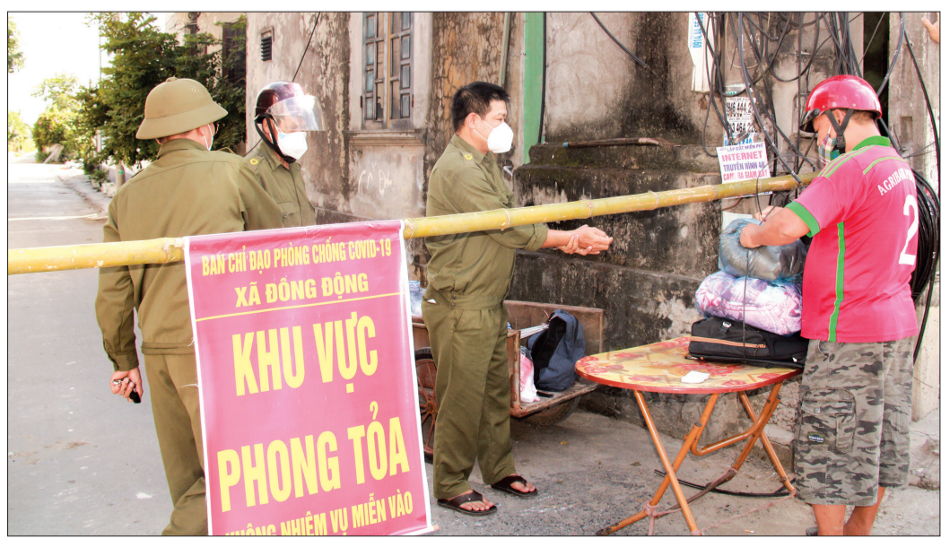
Các thành viên tổ Covid-19 cộng đồng tiếp nhận và chuyển đồ dùng vào khu phong tỏa.

phòng, chống dịch để sớm khống chế, đẩy lùi dịch. Ông Tô Xuân Thúc, Chủ tịch UBND huyện, Trưởng ban Chỉ đạo phòng, chống dịch Covid-19 huyện cho biết: Trước diễn biến khó lường của dịch, huyện chỉ đạo Công ty TNHH Đồ dùng du lịch Trung Bảo Thái Bình, các xã liên quan thần tốc truy vết, khoanh vùng dập dịch; tổ chức lấy mẫu xét nghiệm PCR cho tất cả các trường hợp có nguy cơ cao; thành lập 3 khu cách ly tập trung tại Trường Mầm non Đồng Động, Trường Mầm non Đồng Vinh, Công ty TNHH Đồ dùng du lịch Trung Bảo Thái Bình để cách ly F1. Chỉ đạo Công ty TNHH Châu Sơn gần Công ty TNHH Đồ dùng du lịch Trung Bảo Thái Bình tạm dừng hoạt động để bảo đảm công tác phòng, chống dịch. Bên cạnh đó, đẩy mạnh tuyên truyền, khuyến khích người dân tự nguyện xét nghiệm Covid-19, nhất là người lao động, làm việc ở khu vực đông người; các xã huy động nguồn xã hội hóa hỗ trợ người dân xét nghiệm Covid-19. Các khu cách ly tập trung của huyện sau khi công dân kết thúc cách ly sẽ đứng tiếp nhận F1, chuyển thành khu thu dung F0 không triệu chứng; đồng thời thành lập thêm khu thu dung F0 không triệu chứng tại xã Đông Quan. Các địa phương xây dựng phương án sẵn sàng thiết lập các khu thu dung F0 không triệu chứng đưa vào hoạt động khi cần. Các doanh nghiệp tiếp tục thực hiện nghiêm các biện pháp phòng, chống dịch, nhất là khuyến cáo "5K"; chủ động xét nghiệm sàng lọc Covid-19, đẩy nhanh tiến độ tiêm vắc-xin phòng Covid-19 mũi 2 cho người lao động.