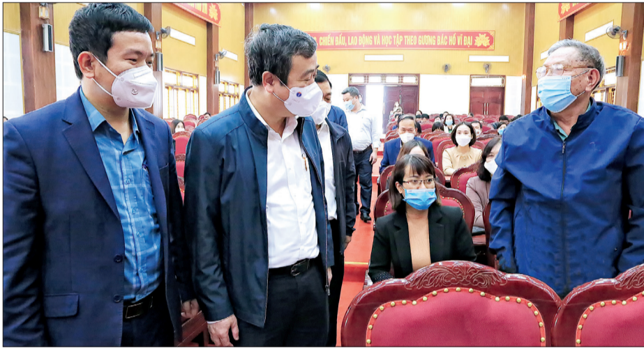
Đồng chí Ngô Đông Hải, Ủy viên Ban Chấp hành Trung ương Đảng, Bí thư Tỉnh ủy kiểm tra việc tập huấn, hướng dẫn cài đặt phần mềm “Sổ tay đảng viên điện tử” tại huyện Đông Hưng.