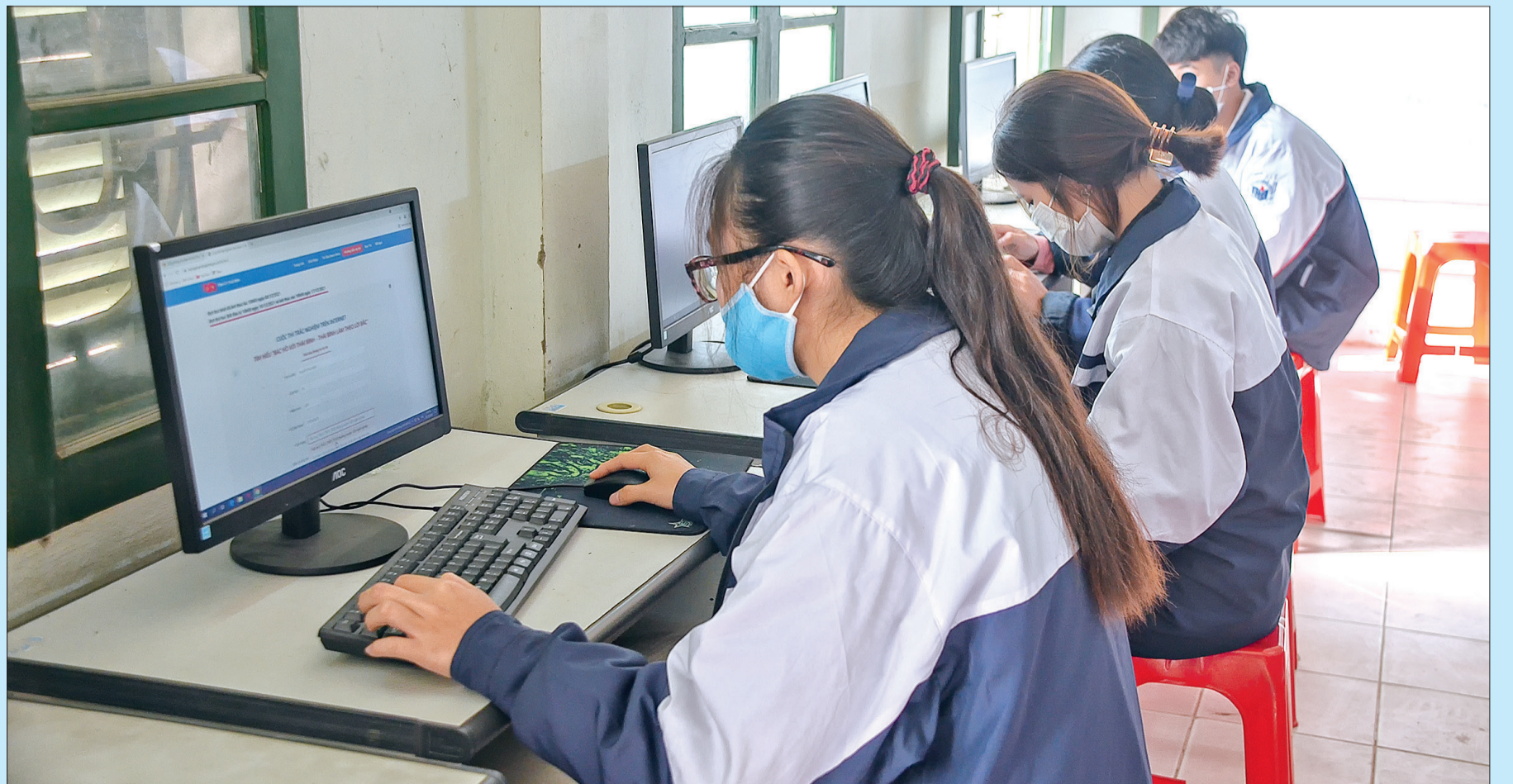
Học sinh Trường THPT Trần Hưng Đạo trả lời các câu hỏi trong đợt 2 của cuộc thi.