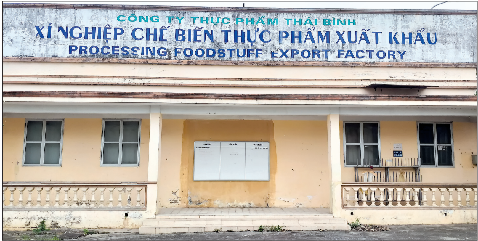
Công ty Cổ phần Thực phẩm Thái Bình đang trong tình trạng không hoạt động.

Sau nhiều tháng làm việc bị chủ doanh nghiệp nợ lương, hơn 1 năm nay công nhân của Công ty Cổ phần Thực phẩm Thái Bình lại không có việc làm, lương nợ vẫn nợ khiến cuộc sống gia đình công nhân bị đảo lộn. Điều họ mong muốn lớn nhất hiện nay là doanh nghiệp trả hết số lương đã nợ và chốt sổ BHXH để họ tìm việc làm mới.