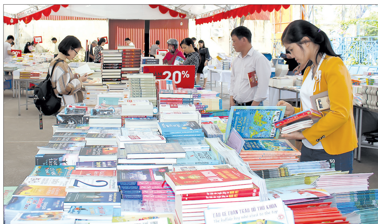
Đọc giả tại hội sách nửa giá năm 2019.

Để người đọc dễ dàng tiếp cận sách, việc xây dựng và phát triển mạng lưới thư viện, tủ sách cơ sở cũng được các ngành, địa phương đặc biệt quan tâm. Tính đến nay, toàn tỉnh có 1 thư viện cấp tỉnh, 8 thư viện huyện, thành phố, 25 thư viện cấp xã, 26 thư viện, tủ sách thôn làng, 18 tủ sách tư nhân có phục vụ cộng đồng, 14 tủ sách dòng họ... 5