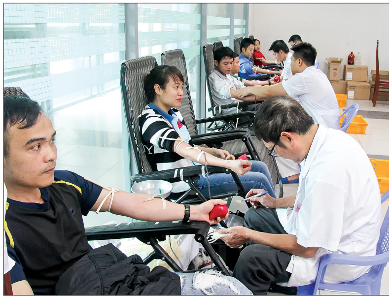
Đoàn viên thanh niên khối doanh nghiệp tỉnh tham gia hiến máu tình nguyện.

Để khắc phục tình trạng thiếu máu phục vụ cấp cứu và điều trị dịp sau tết Nguyên đán đồng thời tập dượt tổ chức hiến máu khẩn cấp khi có thảm họa