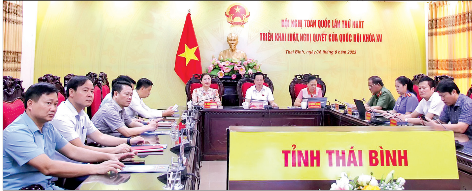
Các đại biểu dự hội nghị tại điểm cầu Thái Bình.

Ngày 6/9, tại nhà Quốc hội, Ủy ban Thường vụ Quốc hội tổ chức hội nghị toàn quốc lần thứ nhất triển khai luật, nghị quyết của Quốc hội khóa XV. Hội nghị được kết nối trực tuyến tới 62 điểm cầu tại các tỉnh, thành phố trong cả nước với khoảng 2.400 đại biểu tham dự. Đồng chí Vương Đình Huệ, Ủy viên Bộ Chính trị, Chủ tịch Quốc hội chủ trì hội nghị. Dự hội nghị có các đồng chí Ủy viên Bộ Chính trị, Bí thư Trung ương Đảng, Ủy viên Ban Chấp hành Trung ương Đảng, đại diện các bộ, ban, ngành trung ương. Về phía Đoàn đại biểu Quốc hội tỉnh Thái Bình có các đồng chí: Ngô Đông Hải, Ủy viên Ban Chấp hành Trung ương Đảng, Bí thư Tỉnh ủy, Trưởng đoàn đại biểu Quốc hội tỉnh; Đặng Thanh Giang, Ủy viên Ban Thường vụ Tỉnh ủy, Phó Chủ tịch thường trực HĐND tỉnh; Lại Văn Hoàn, Tỉnh ủy viên, Phó Chủ tịch UBND tỉnh cùng các đại biểu chuyên trách công tác tại trung ương. Tại điểm cầu Thái Bình, đồng chí Nguyễn Văn Huy, Tỉnh ủy viên, Phó Trưởng đoàn đại biểu Quốc hội chuyên trách tỉnh, các đại biểu Quốc hội, đại diện các sở, ngành, đơn vị tới dự.