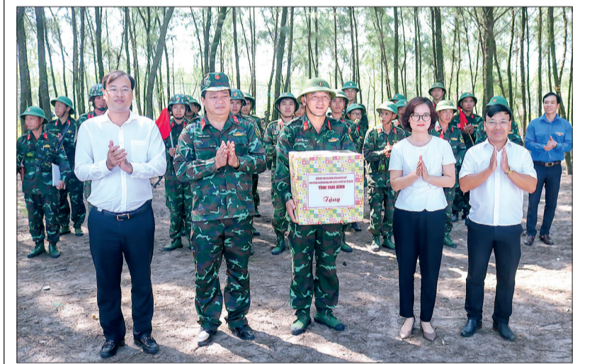
Trao quà cho cán bộ, chiến sĩ Trung đoàn 568 phục vụ diễn tập.

đẩy nhanh tiến độ xây dựng công sự, củng cố khu vực thực tiễn nhằm bảo đảm cho diễn tập tác chiến phòng thủ Quân khu thành công và an toàn tuyệt đối.