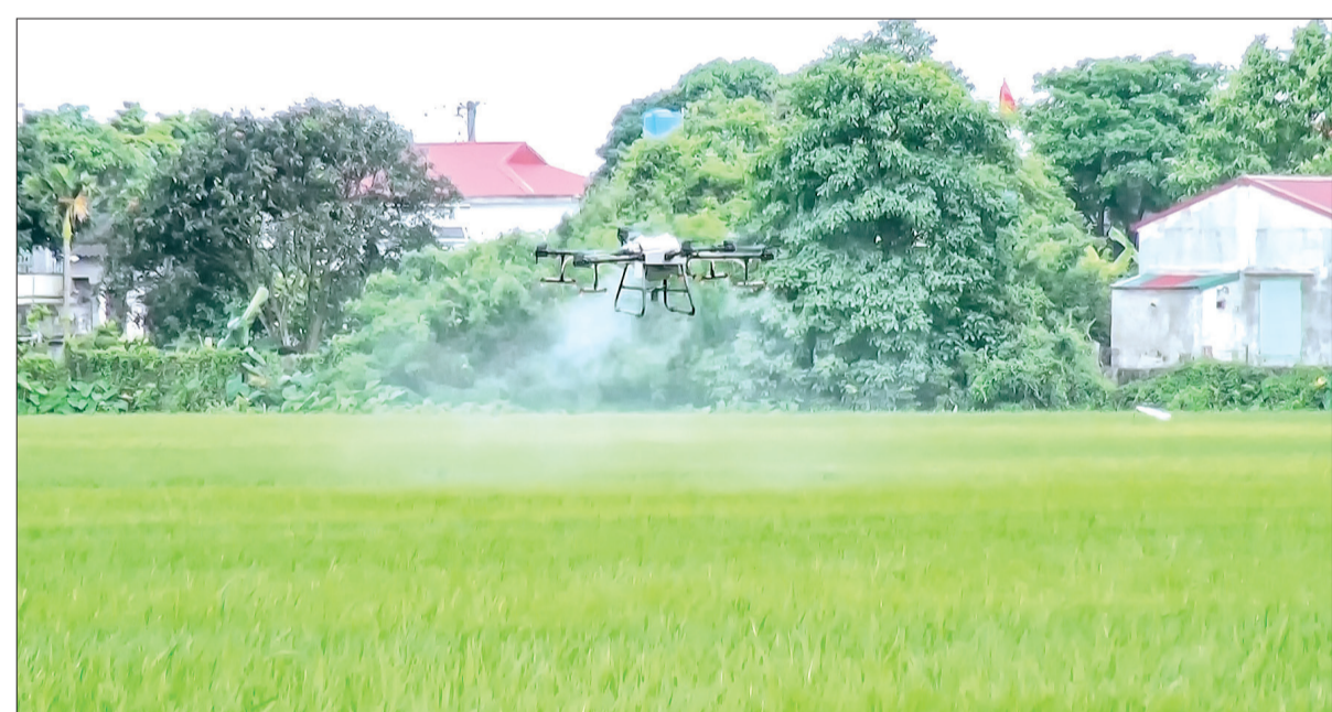
Nông dân huyện Tiên Hải phòng, trừ sâu bệnh cho lúa mùa bằng thiết bị bay.

Trước diễn biến phức tạp của các đối tượng sâu bệnh, huyện Tiên Hải yêu cầu các địa phương tăng cường tuyên truyền và phát động nông dân kiểm tra đồng ruộng, đồng thời theo dõi chặt chẽ diễn biến thời tiết, sâu bệnh để có biện pháp phun trừ khi tới ngưỡng và theo khuyến cáo của ngành chuyên môn. Tổ chức phun trừ sâu bệnh từ ngày 8 - 11/9 đối với sâu cuốn lá nhỏ, sâu đục thân, rầy các loại, bệnh khô vằn.