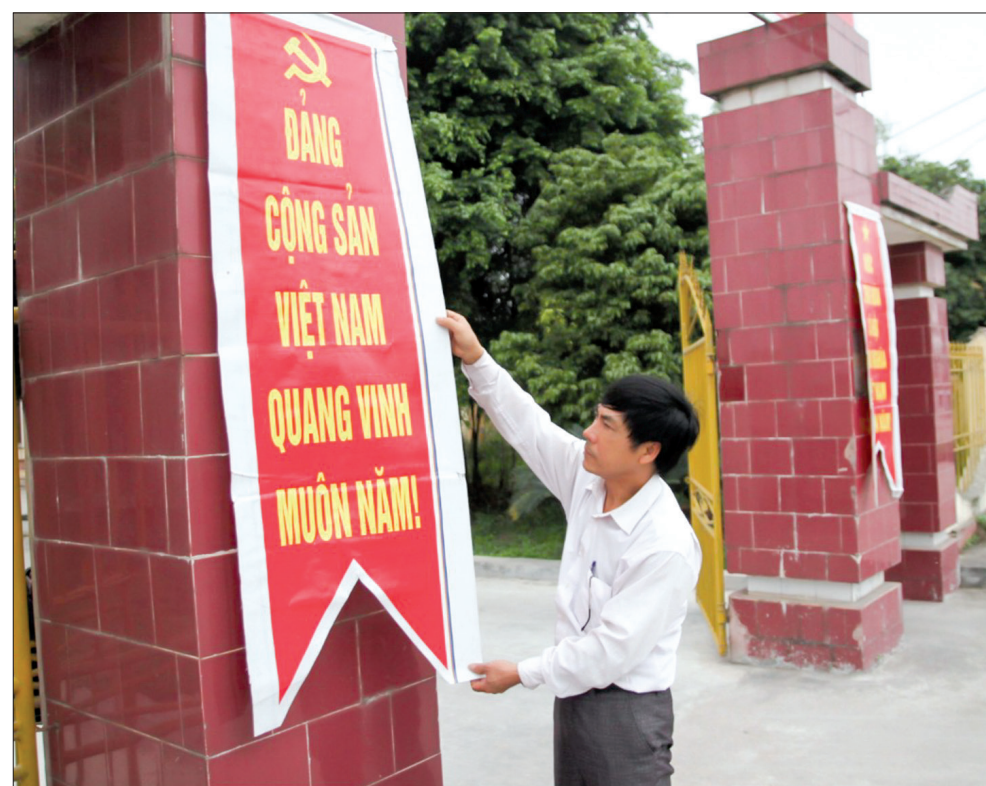
Xã Đông Hải (Quỳnh Phụ) trang trí khánh tiết chào mừng Đại hội.