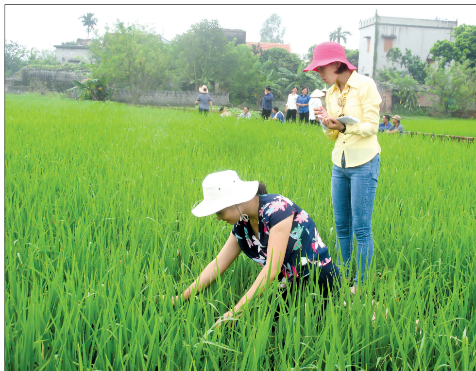
Cán bộ Trung tâm Khuyến nông tham gia giám sát các hoạt động dự thi theo đúng quy trình của cơ quan quản lý dự án.

Dự án bao gồm 2 giai đoạn: thử nghiệm (gồm 2 vụ: vụ mùa năm 2017, vụ xuân năm 2018), nhân rộng (4 vụ liên tiếp, từ vụ xuân năm 2019 đến vụ mùa năm 2020). Đến nay, giai đoạn nhân rộng các gói công nghệ đã thực hiện được 3 vụ: vụ xuân, vụ mùa năm 2019 và vụ xuân năm 2020 với 4 đơn vị dự thi: