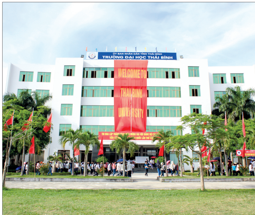
Khuôn viên Trường Đại học Thái Bình.