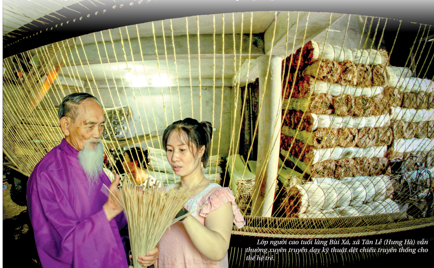
Lớp người cao tuổi làng Bùi Xá, xã Tân Lễ (Hưng Hà) vẫn thường xuyên truyền dạy kỹ thuật dệt chiếu truyền thống cho thế hệ trẻ.

Dân gian quen gọi “chi lưu” của sông Hồng chảy giữa ranh giới hai tỉnh Thái Bình và Hưng Yên là sông Luộc, còn sách “Dư địa chí” của Nguyễn Trãi gọi là sông Nông Kỳ và dòng sông này là một trong ba “kỳ quan” của trấn Sơn Nam. Bên bờ Nam sông Luộc có một làng cổ tên nôm Hải Hồ nằm kề ngã ba sông, tục gọi là làng Hới nổi tiếng nghề dệt chiếu cói. Làng có tên chữ là Hải Triều thuộc vùng đất đa hương cương thời thuộc Hán, huyện Chu Diên thời tiền Lý, phủ Thái Bình thời tiền Lê và lộ Long Hưng thời Trần.