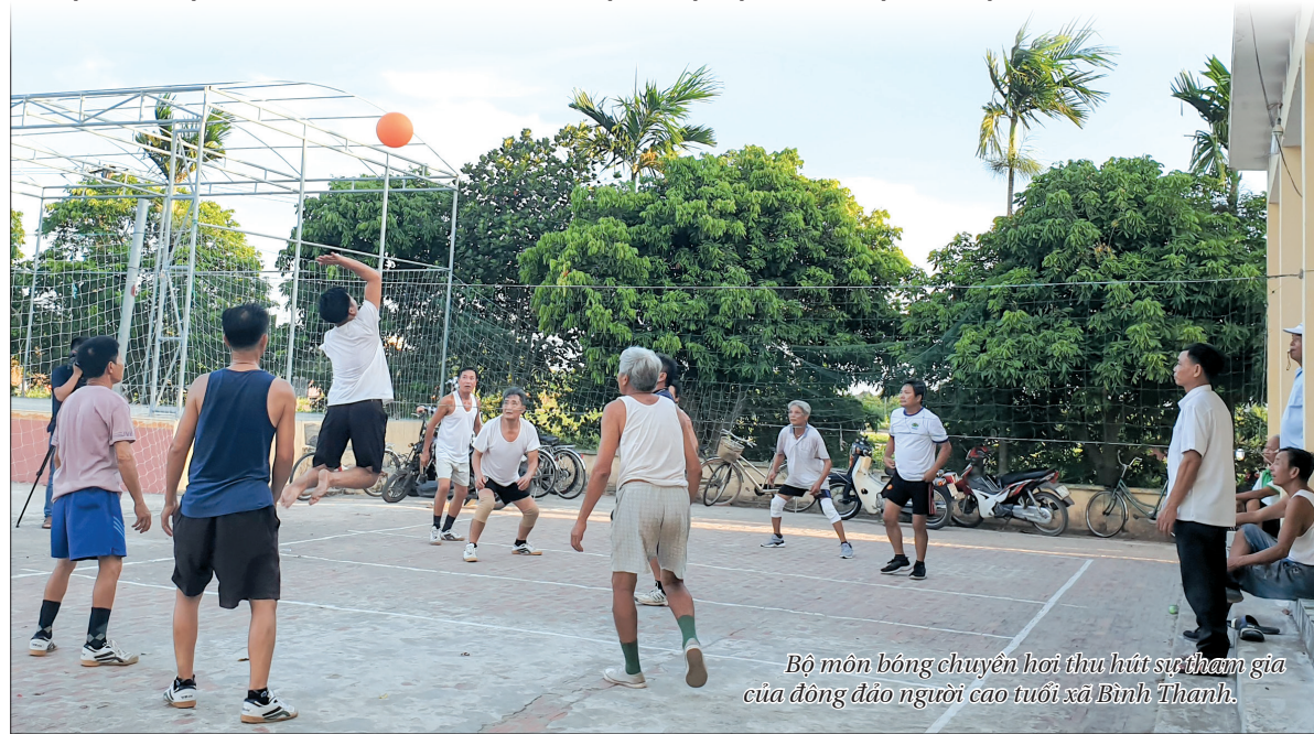
Bộ môn bóng chuyền hơi thu hút sự tham gia của đông đảo người cao tuổi xã Bình Thanh.

Từ 4 giờ chiều, các câu lạc bộ bóng chuyền, bóng bàn, yoga,... tại xã Bình Thanh (Kiến Xương) đã tấp nập người dân đến tập luyện, rộn rã tiếng cười nói, trò chuyện. Với mục tiêu xây dựng nông thôn mới nâng cao, chính quyền địa phương đang nỗ lực từng ngày trong việc cải thiện chất lượng cuộc sống của người dân, trong đó việc rèn luyện thân thể theo gương Bác Hồ vĩ đại là hoạt động luôn được chú trọng.