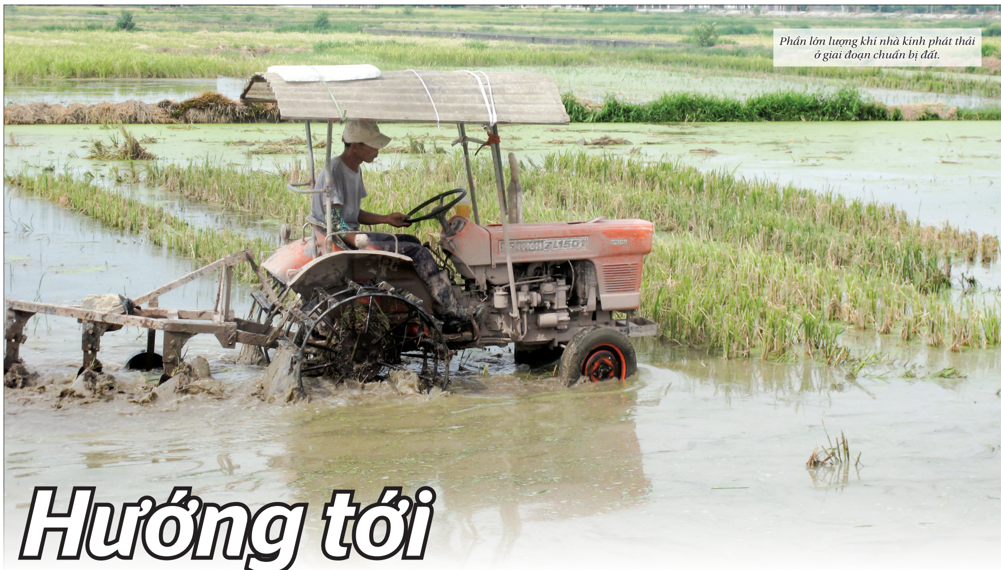
Phần lớn lượng khí nhà kính phát thải ở giai đoạn chuẩn bị đất.