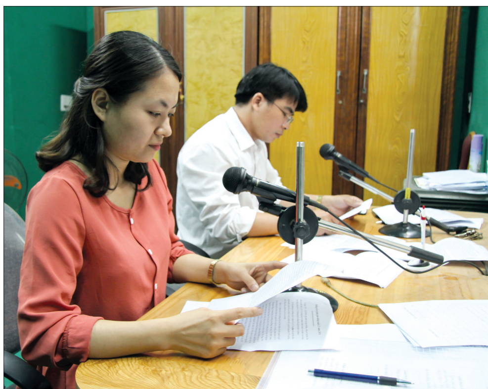
Phát thanh viên Đài Truyền thanh Truyền hình huyện Quỳnh Phụ thực hiện chương trình chào mừng Đại hội.

Với nhiều hoạt động tuyên truyền thiết thực, cán bộ, đảng viên và các tầng lớp nhân dân huyện Quỳnh Phụ đang hướng về Đại hội đại biểu Đảng bộ huyện Quỳnh Phụ lần thứ XVI với sự tin tưởng về thành công của Đại hội, tạo động lực mới, khí thế mới thi đua lập thành tích chào mừng Đại hội đại biểu Đảng bộ tỉnh lần thứ XX, Đại hội đại biểu toàn quốc lần thứ XIII của Đảng.