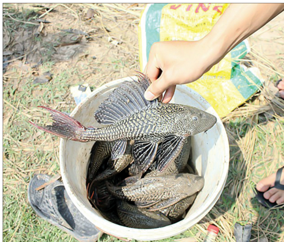
Cá dọn bể đang dần lấn chiếm nơi sinh sống và cạnh tranh thức ăn, gây hại cho các sinh vật bản địa.

kế lại dụng cụ này để phát huy những ưu điểm, tránh tính tận diệt. Thanh chia sẻ: Một bộ lồng bắt cá dọn bể dài khoảng 5 - 10m bao gồm nhiều khung lồng có dạng