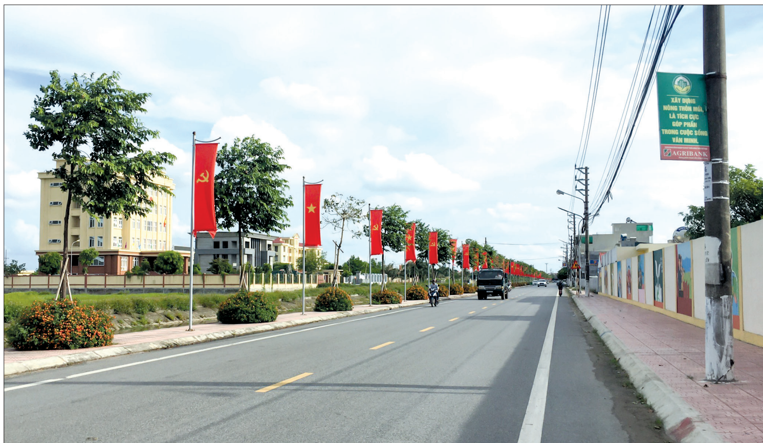
Đường Đào Đình Luyện (thị trấn Quỳnh Côi, huyện Quỳnh Phụ).

Theo kế hoạch, Đại hội đại biểu Đảng bộ huyện Quỳnh Phụ lần thứ XVI, nhiệm kỳ 2020 - 2025 tổ chức vào giữa tháng 7. Thời gian qua, huyện Quỳnh Phụ đã tổ chức nhiều hoạt động thông tin, tuyên truyền tạo khí thế thi đua sôi nổi, rộng khắp hướng về Đại hội.