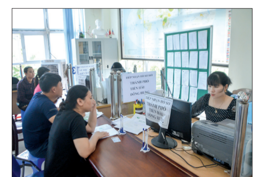
Người lao động nộp hồ sơ hưởng trợ cấp thất nghiệp tại Trung tâm Dịch vụ việc làm Thái Bình.

Do ảnh hưởng của dịch Covid-19, từ đầu năm đến nay số người đề nghị hưởng trợ cấp thất nghiệp có xu hướng tăng. Theo thống kê của Trung tâm Dịch vụ việc làm Thái Bình, 3 tháng đầu năm 2021, Trung tâm đã tiếp nhận và làm thủ tục cho 1.733 hồ sơ đủ điều kiện được hưởng trợ cấp thất nghiệp với tổng số tiền chi trả trên 25,7 tỷ đồng. So với cùng kỳ năm 2020 tăng 555 hồ sơ. Bên cạnh đó, Trung tâm đã tổ chức tư vấn, giới thiệu việc làm, hỗ trợ học nghề cho người lao động với tổng số tiền 104 triệu đồng. Việc giải quyết kịp thời trợ cấp thất nghiệp và hỗ trợ học nghề giúp người lao động có cơ hội sớm tìm được việc làm mới phù hợp.