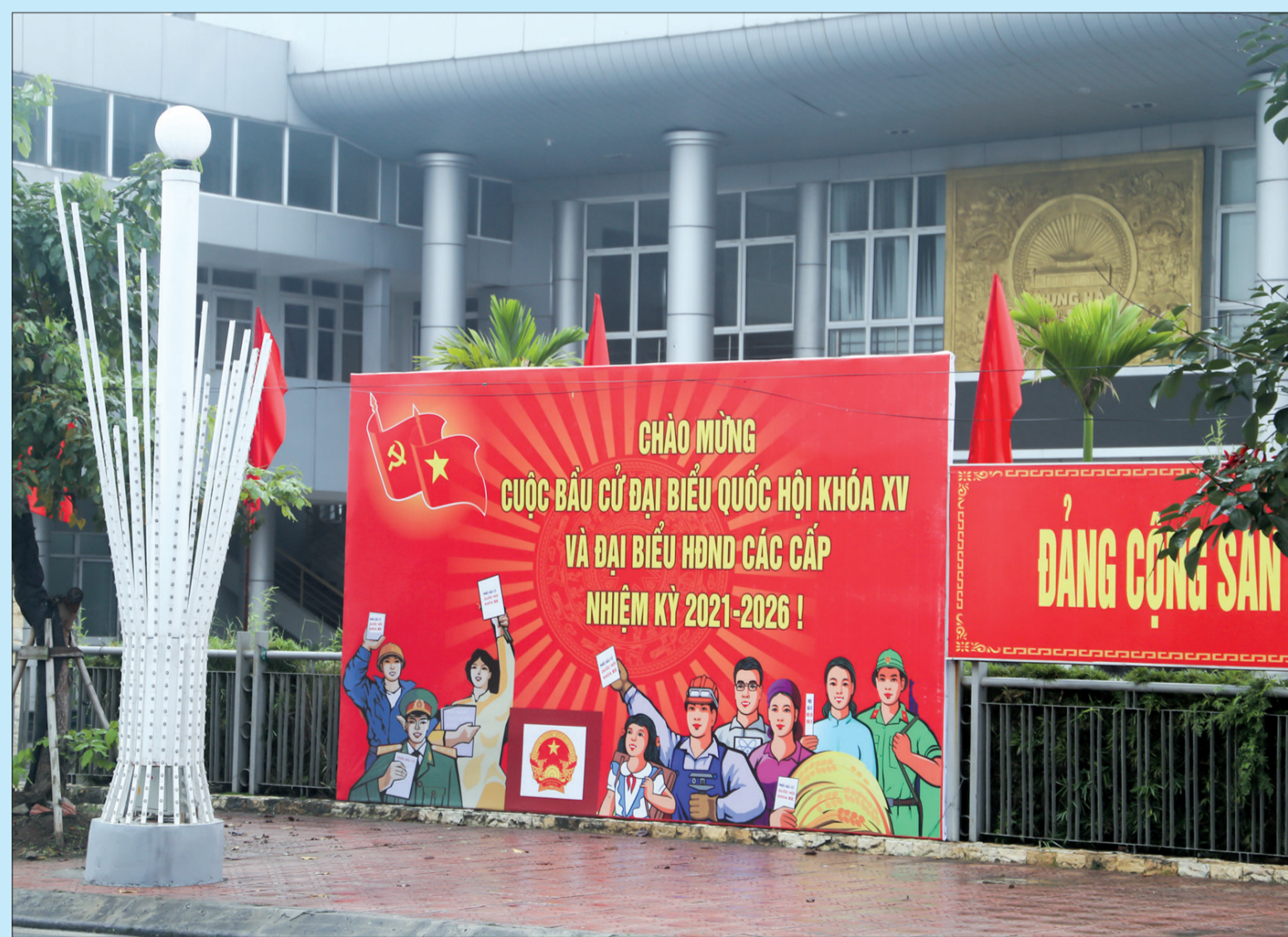
Tuyên truyền trực quan về cuộc bầu cử tại huyện Hưng Hà.