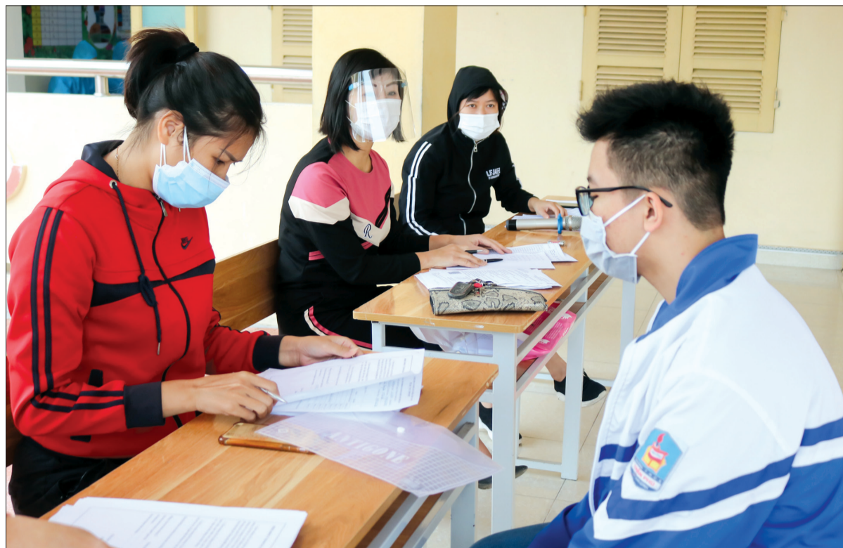
Cán bộ, giáo viên Trường THCS Trần Phú (thành phố Thái Bình) hỗ trợ công tác tiêm vắc-xin phòng Covid-19 cho học sinh.

Trước diễn biến phức tạp của dịch Covid-19, hàng trăm cán bộ, giáo viên, nhân viên ngành Giáo dục Thái Bình đã tình nguyện đảm nhận nhiều công việc hỗ trợ tuyến đầu chống dịch.