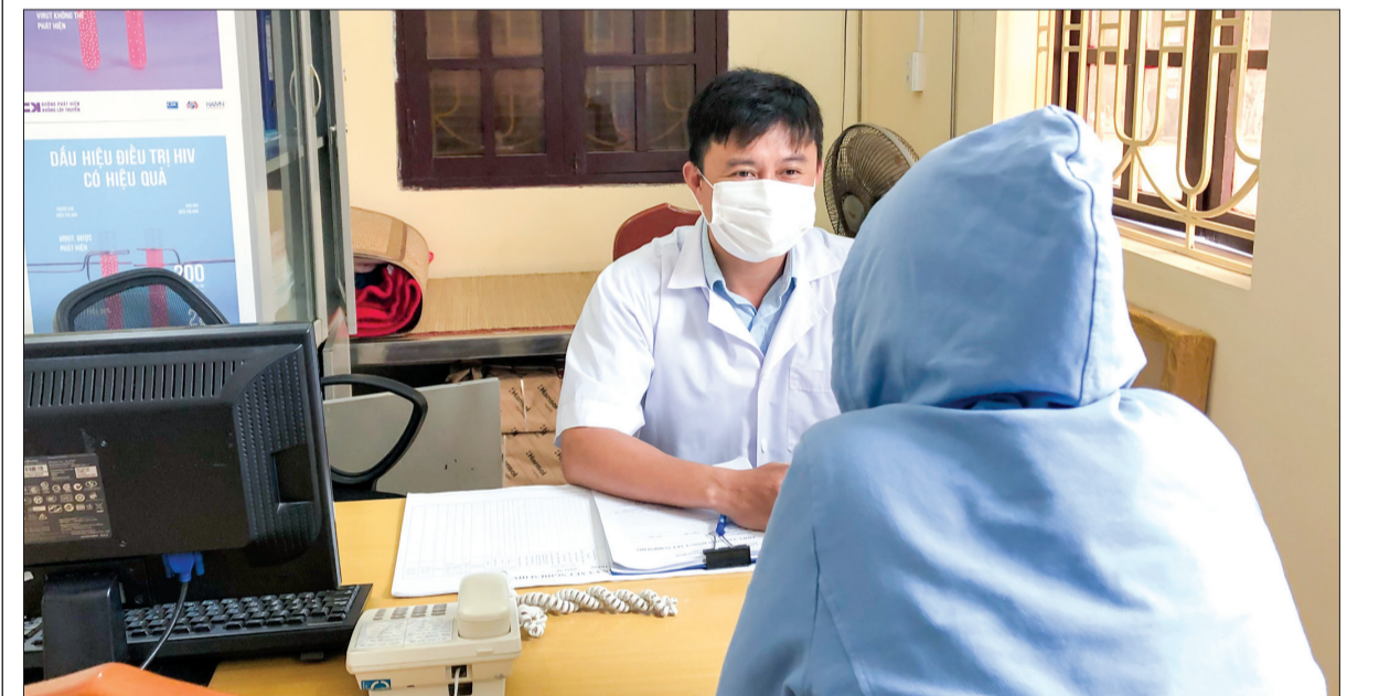
Nhân viên y tế tư vấn các biện pháp phòng tránh lây nhiễm HIV cho người dân.