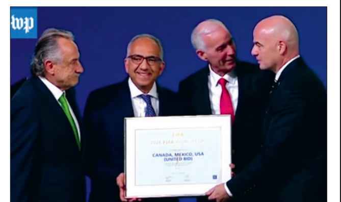
Chủ tịch FIFA Gianni Infantino trao chứng nhận quyền đăng cai World Cup 2026 cho Chủ tịch Liên đoàn Bóng đá Canada - Mexico - Mỹ.

Trận chung kết World Cup 2026 sẽ diễn ra trên sân vận động MetLife ở New Jersey, tiểu bang nằm giữa thủ đô Washington D.C và New York. Như vậy, sau kỳ World Cup lần thứ 22 diễn ra vào năm 2022 ở Qatar, trái bóng tròn World Cup sẽ lần trên sân cỏ ở Canada, Mexico và Mỹ vào mùa hè năm 2026.