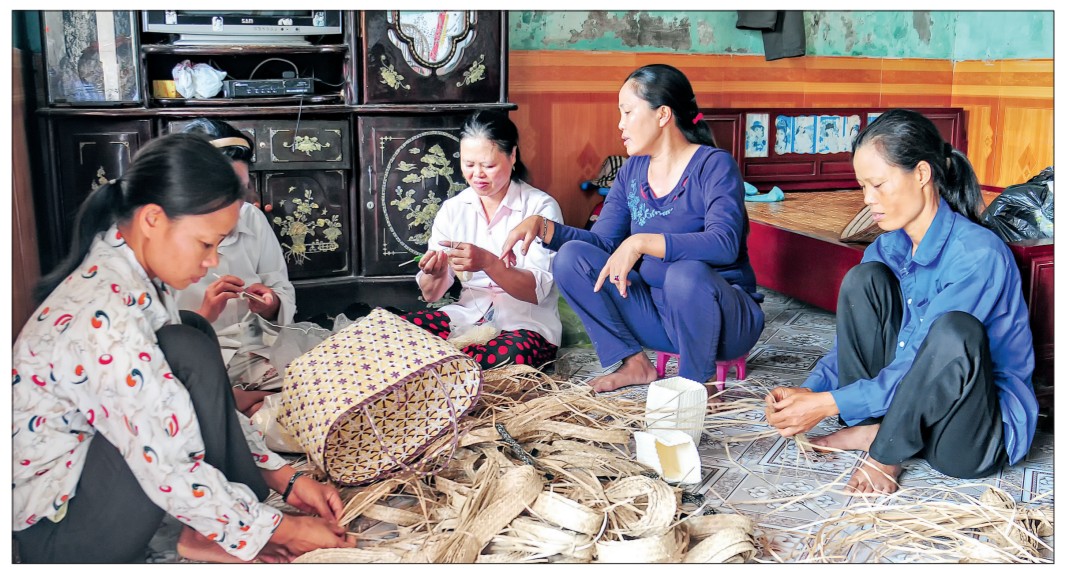
Day nghề, tạo việc làm giúp phụ nữ khẳng định vị trí, vai trò trong gia đình.