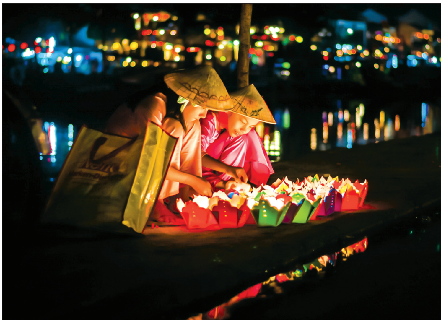
Thả hoa đăng trong lễ Vu Lan.