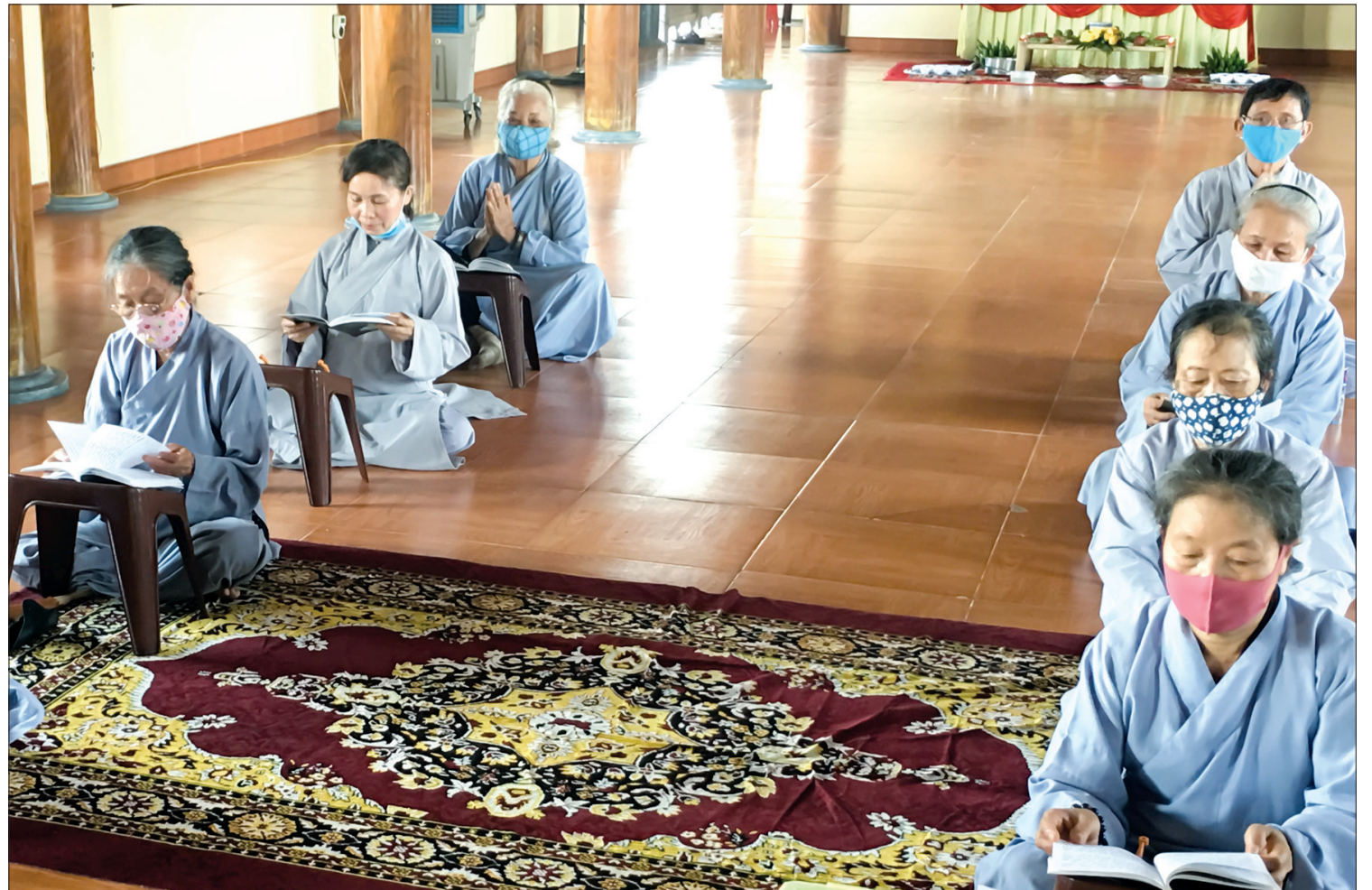
Chùa Từ Xuyên (phường Hoàng Diệu, thành phố Thái Bình) hạn chế số người tham gia một khóa tụng kinh, đồng thời giữ khoảng cách an toàn.