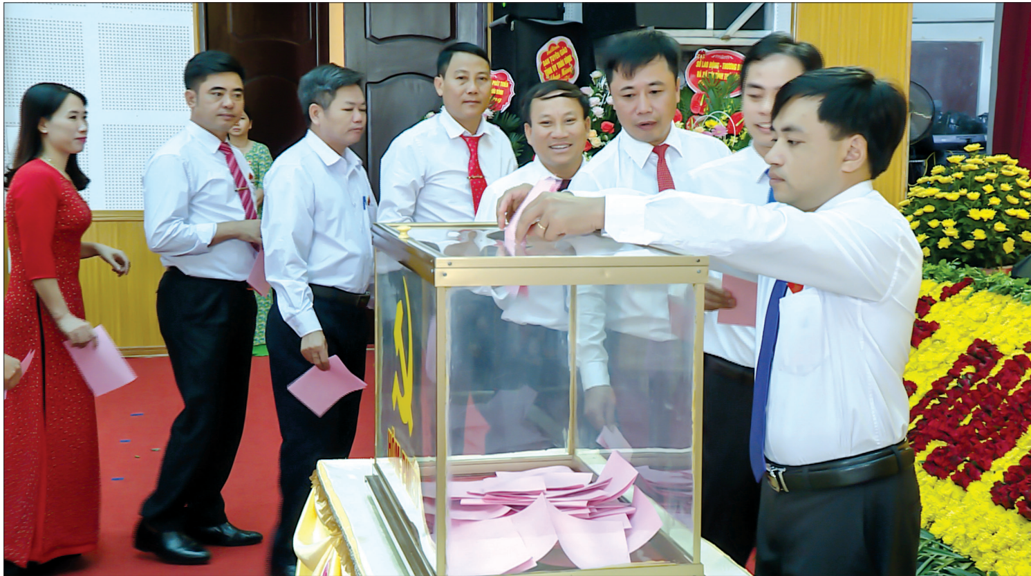
Các đại biểu bỏ phiếu bầu Ban Chấp hành Đảng bộ huyện tại Đại hội đại biểu Đảng bộ huyện Đông Hưng.

Bắt đầu tổ chức từ ngày 17/5/2020, đến ngày 11/8/2020 Thái Bình đã hoàn thành tổ chức đại hội đảng bộ cấp trên cơ sở, nhiệm kỳ 2020 - 2025 bảo đảm đủ 4 nội dung theo đúng tinh thần Chỉ thị số 35-CT/TW của Bộ Chính trị về đại hội đảng bộ các cấp tiến tới Đại hội đại biểu toàn quốc lần thứ XIII của Đảng.