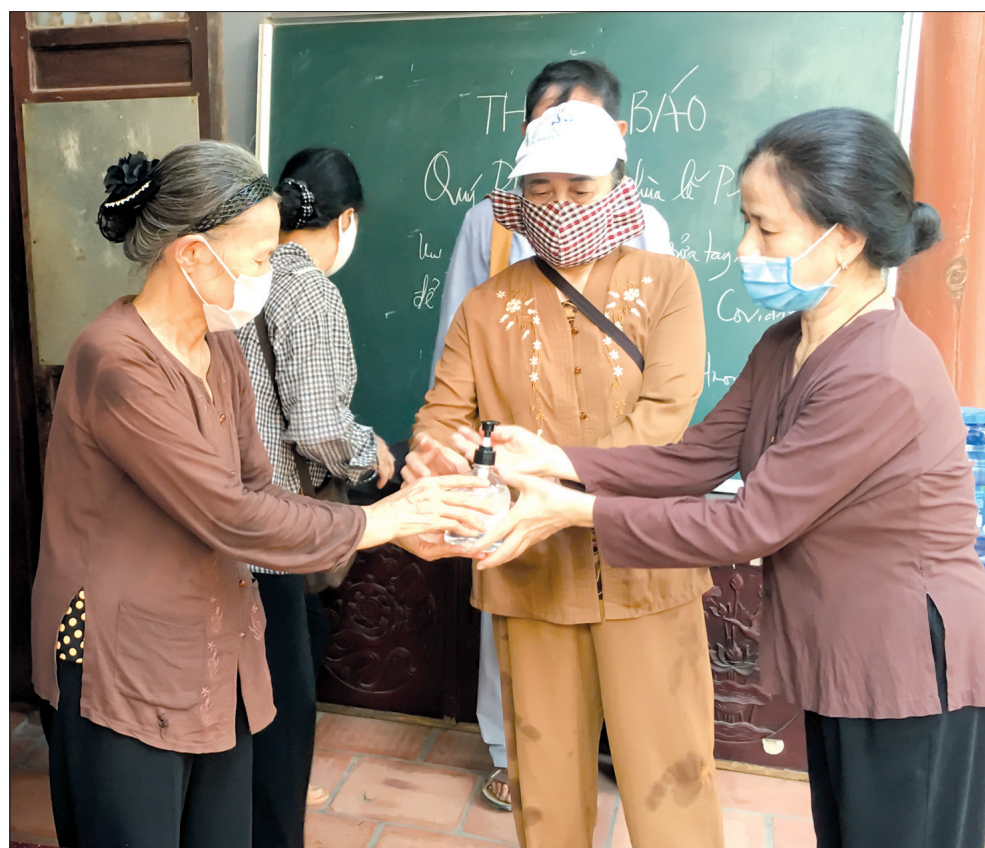
Phật tử đeo khẩu trang, sát khuẩn tay trước khi vào chùa Từ Xuyên (phường Hoàng Diệu, thành phố Thái Bình).

Với ý nghĩa nhân văn cao đẹp, Vu Lan từ một ngày lễ riêng của Phật giáo nay đã phổ biến rộng rãi trong nhân dân. Đây không chỉ là dịp để mọi người thể hiện lòng biết ơn đối với các đấng sinh thành, mà còn là dịp hướng các Phật tử trở về với cội nguồn, về truyền thống “Uống nước nhớ nguồn” của dân tộc.