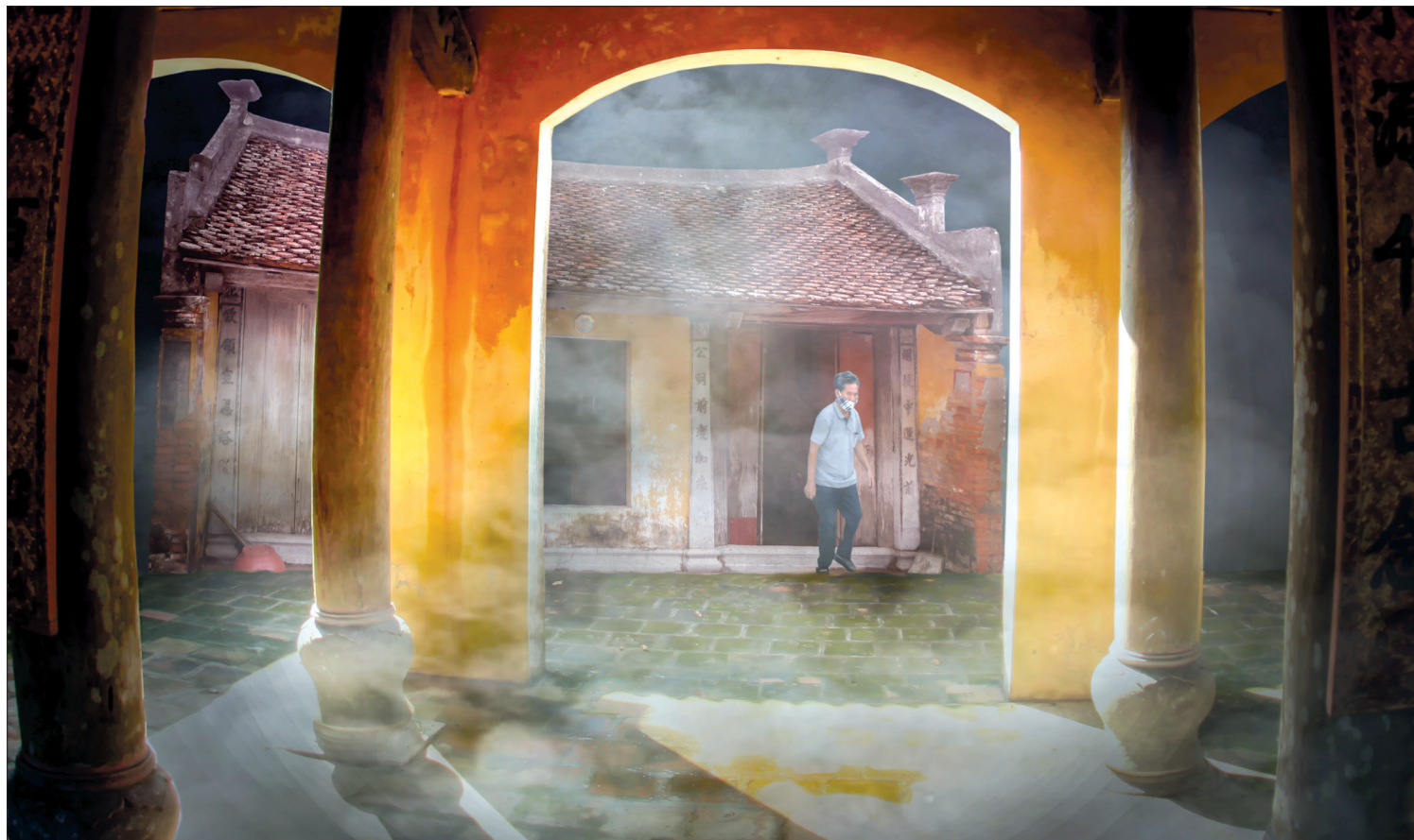
Từ đường Đình Danh ở làng Đùn Ngoại, xã Chi Lăng, huyện Hưng Hà còn lưu giữ được ba gian hậu cung từ 400 năm trước.