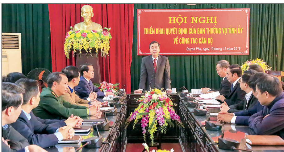
Đồng chí Ngô Đông Hải, Ủy viên dự khuyết Trung ương Đảng, Phó Bí thư thường trực Tỉnh ủy phát biểu tại hội nghị.