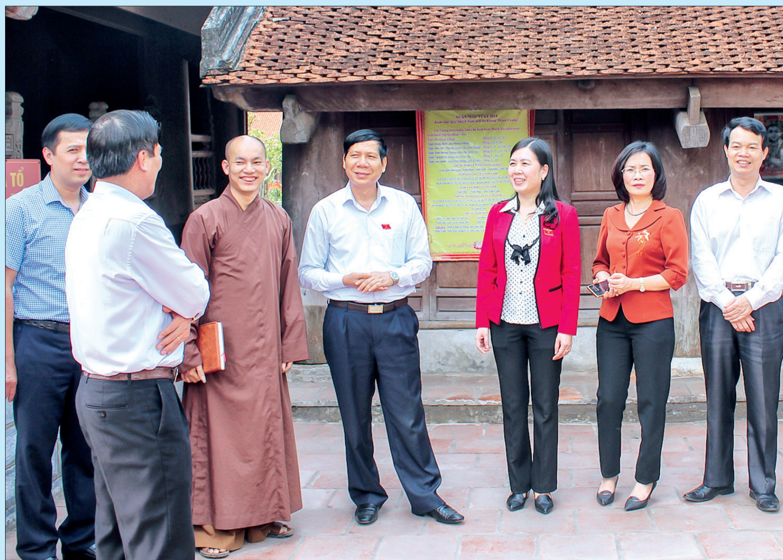
Ban Văn hóa - Xã hội, HĐND tỉnh giám sát việc quản lý, tổ chức lễ hội và tu bổ tôn tạo, phát huy giá trị các di tích cấp tỉnh, cấp quốc gia tại chùa Keo (xã Dục Nhất, huyện Vũ Thư).