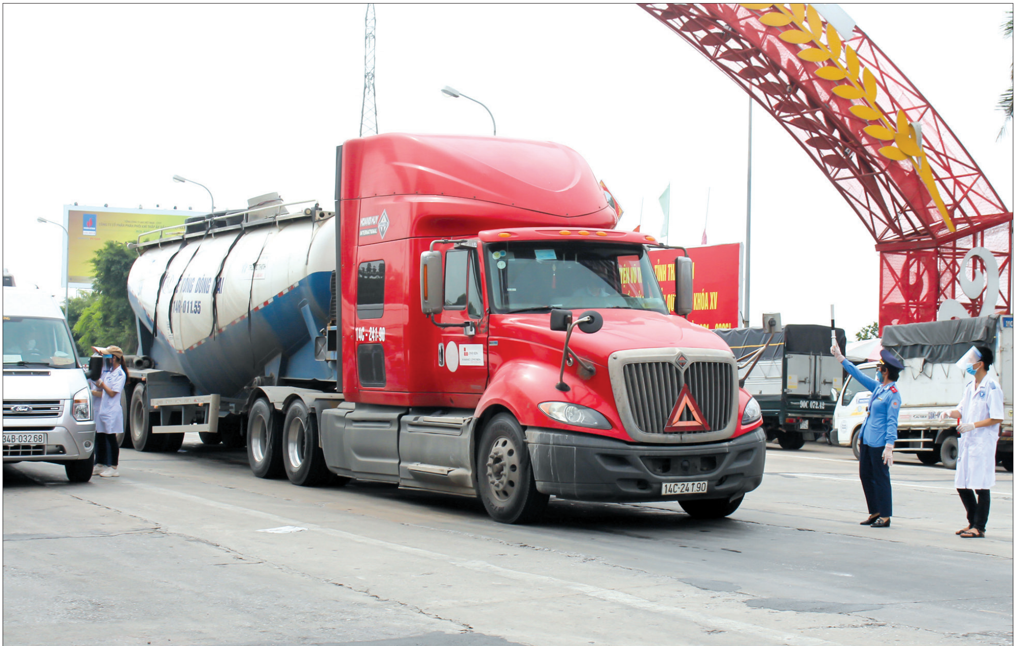
Lực lượng chức năng kiểm soát người vào tỉnh tại chốt kiểm soát dịch cầu Tân Đệ (Vũ Thư).

dịch, nhiều tháng nay, hàng trăm người thường xuyên thay nhau túc trực 24/24 giờ thực hiện kiểm soát chặt người vào tỉnh, không để lọt các trường hợp nguy cơ dù thời tiết nóng bức hay mưa đêm ướt lạnh. Bên cạnh đó, còn rất nhiều những hình ảnh vất vả của nhân viên y tế, lực lượng công an, quân đội... ở các khu cách ly. Nhiều ngày không được về nhà, công việc áp lực, vất vả và nguy cơ lây nhiễm cao song họ luôn cố gắng hết mình để giữ vững thành quả phòng, chống dịch, bảo đảm an toàn tính mạng, sức khỏe nhân dân. Tuy nhiên, trong lúc các cấp, ngành, địa phương, đơn vị, các lực lượng chức năng và người dân đang nỗ lực phòng, chống dịch vẫn còn có một bộ phận người dân đứng ngoài cuộc chiến chống dịch, chủ quan, thờ ơ trước dịch bệnh. Họ không biết rằng chỉ một lúc nào đó quên đeo khẩu trang ở nơi công cộng, một chút mãi vui tụ tập đông người... sẽ khiến mình có thể bị nhiễm bệnh, gia đình phải cách ly, thôn, xóm bị phong tỏa. Cùng với đó, rất nhiều người sẽ phải vất vả phòng, chống để dịch không lây lan, bùng phát. Chung tay phòng, chống dịch, ngay lúc này đây mỗi người dân hãy nâng cao ý thức, trách nhiệm, thực hiện nghiêm khuyến cáo "5K" vì sức khỏe của chính bản thân, gia đình và cộng đồng.