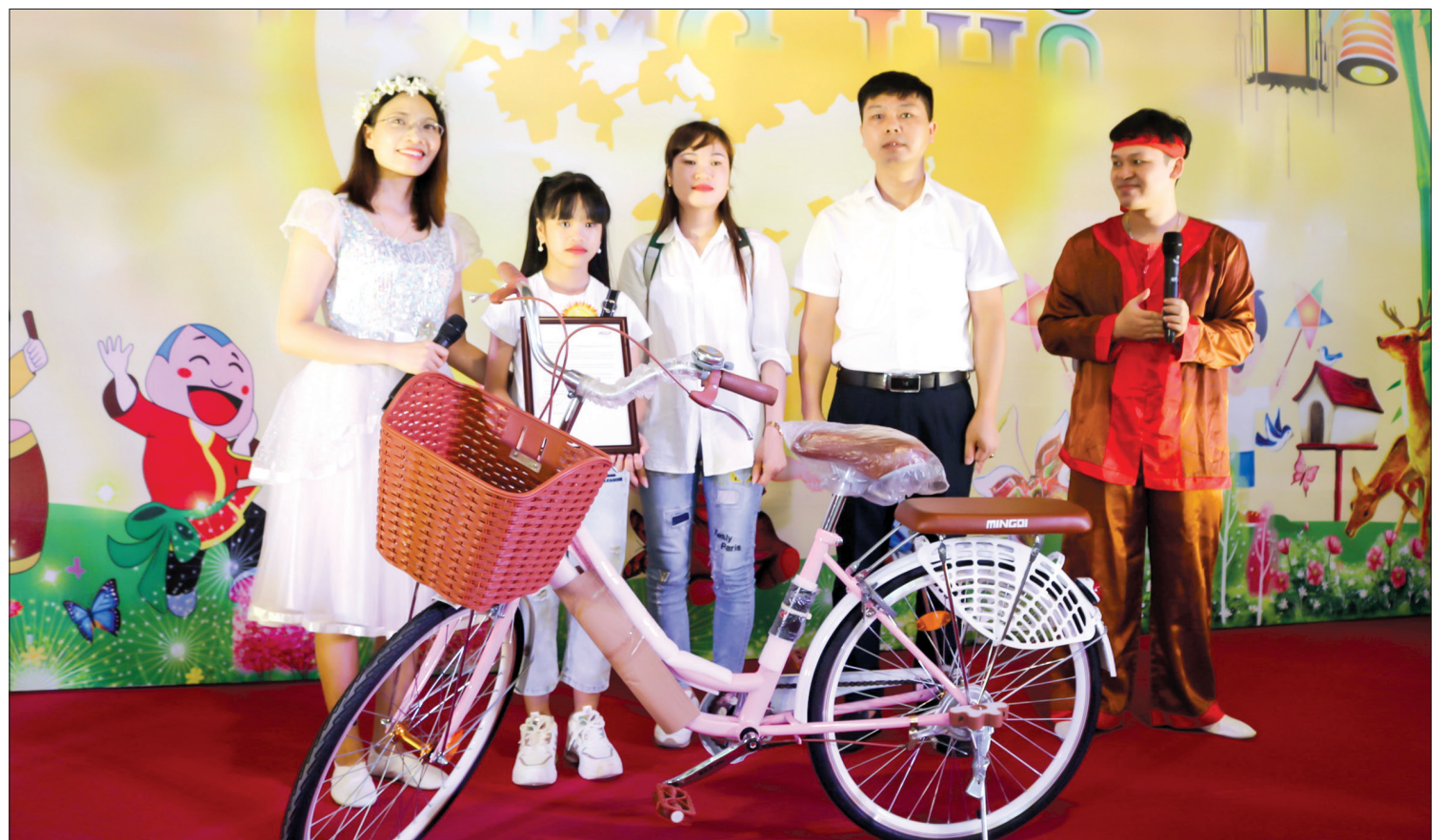
Chiếc xe Công ty Tân Đệ trao tặng là món quà ý nghĩa động viên con em người lao động.

Bận mải, ít có thời gian chăm sóc, giáo dục con cái là nỗi lo thường trực của nhiều gia đình mà bố mẹ là công nhân đang làm việc trong các nhà máy, xí nghiệp. Hiểu được tâm tư đó, thời gian qua, Công ty Cổ phần Sản xuất hàng thể thao Chi nhánh Thái Bình (Công ty Tân Đệ) đã có nhiều hoạt động chia sẻ với người lao động và có những cách làm sáng tạo trong công tác khuyến học, khuyến tài.