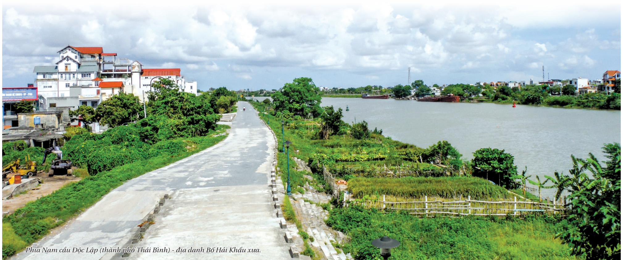
Phía Nam cầu Độc Lập (thành phố Thái Bình) - địa danh Bồ Hải Khẩu xưa.