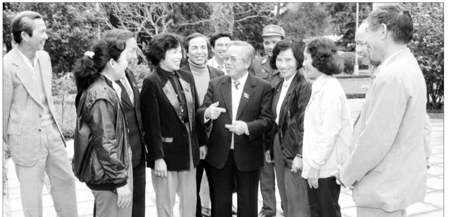
Chủ tịch Quốc hội Lê Quang Đạo gặp gỡ các đại biểu Quốc hội tại kỳ họp thứ 11 Quốc hội khóa VIII (1992).

Với phương châm đổi mới tư duy pháp lý, Quốc hội khóa VIII đã chương trình hóa việc xây dựng pháp luật và định ra quy trình làm luật nhanh chóng, bảo đảm xây dựng và hoàn thiện khuôn khổ pháp luật phục vụ công cuộc đổi mới. Dưới sự chủ trì của đồng chí Lê Quang Đạo, Quốc hội khóa VIII có nhiều kỳ họp nhất so với các Quốc hội khóa trước (11 kỳ họp); dành nhiều thời gian, trí tuệ bàn và giải quyết nhiều vấn đề quan trọng của đất nước; thông qua nhiều đạo luật có vai trò thể chế hóa, đưa đường lối đổi mới của Đảng vào cuộc sống ở vào thời điểm cái cũ vẫn tồn tại, cái mới bắt đầu xác lập chưa vững chắc, còn gặp nhiều lực cản, khó khăn, thách thức. Quốc hội khóa VIII đã ban hành hai bộ luật, 29 đạo luật và Hội đồng nhà nước ban hành 39 pháp lệnh. Số lượng văn bản được ban hành trong nhiệm kỳ này nhiều hơn cả số luật của bảy khóa trước cộng lại. Nhằm phục vụ việc chuyển sang nền kinh tế hàng hóa nhiều thành phần vận hành theo cơ chế thị trường có sự quản lý của nhà nước, góp phần phát huy mọi tiềm năng của đất nước, trọng tâm hoạt động lập pháp trong nhiệm kỳ Quốc hội khóa VIII là tập trung ban hành các luật và pháp lệnh quan trọng về kinh tế như Luật Đầu tư nước ngoài tại Việt Nam, Luật Doanh nghiệp tư nhân, Luật Công ty, Luật Đất đai, Pháp lệnh về hợp đồng kinh tế, các pháp lệnh về ngân hàng... Bên cạnh đó, Quốc hội và Hội đồng nhà nước cũng đã ban hành nhiều luật và pháp lệnh nhằm đổi mới hoạt động trong