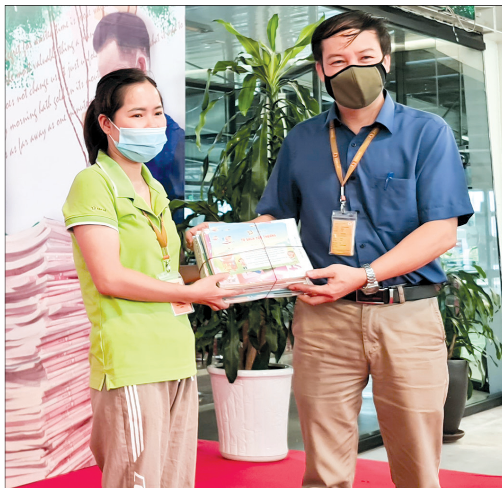
Công ty Tân Đệ trao tặng bộ sách giáo khoa từ chương trình “Tủ sách yêu thương” cho con em người lao động.

lưu, phát triển hoàn thiện nhân cách, rèn luyện đạo đức và văn hóa, phòng, tránh tai nạn, tệ nạn xã hội. Chính điều đó giúp các phụ huynh yên tâm làm việc và cảm