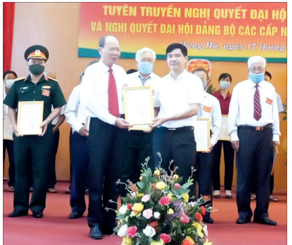
Lãnh đạo huyện Hưng Hà trao giải nhất cho báo cáo viên Đảng bộ xã Hồng An.

Thứ nhất , thí sinh tham dự hội thi phải là báo cáo viên của đảng bộ xã, thị trấn được cấp ủy ra quyết định công nhận. Trước khi hội thi diễn ra, Ban Tuyên giáo Huyện ủy và Trung tâm Chính trị huyện cần tổ chức tập huấn nghiệp vụ tuyên truyền miệng, nhất là