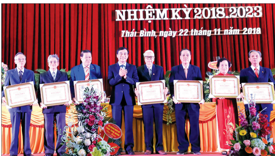
Đồng chí Đặng Trọng Thăng, Phó Bí thư Tỉnh ủy, Chủ tịch UBND tỉnh trao bằng khen cho tập thể, cá nhân đạt thành tích xuất sắc.