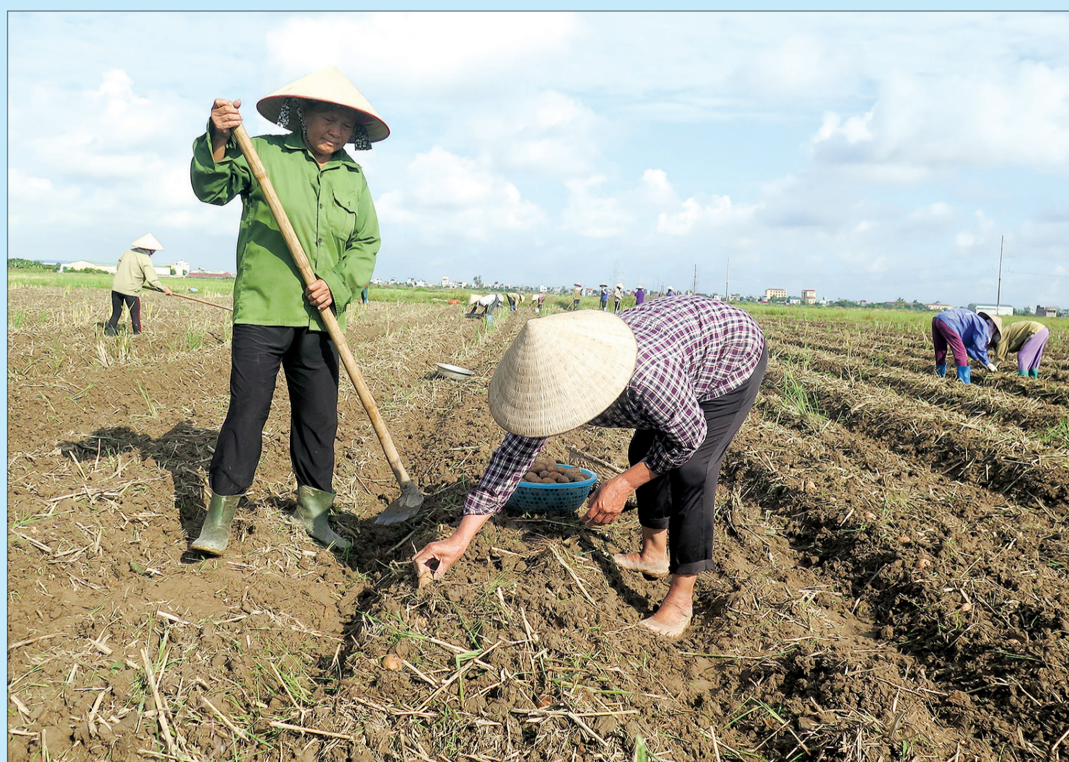
Trồng cây khoai tây ở thôn Hòa Bình, xã Vũ Ninh.