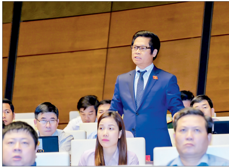
Đại biểu Đoàn đại biểu Quốc hội tỉnh chất vấn tại hội trường.