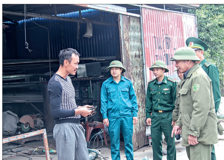
Phối hợp tuyên truyền, vận động chống tái lấn chiếm hành lang an toàn giao thông trên địa bàn.