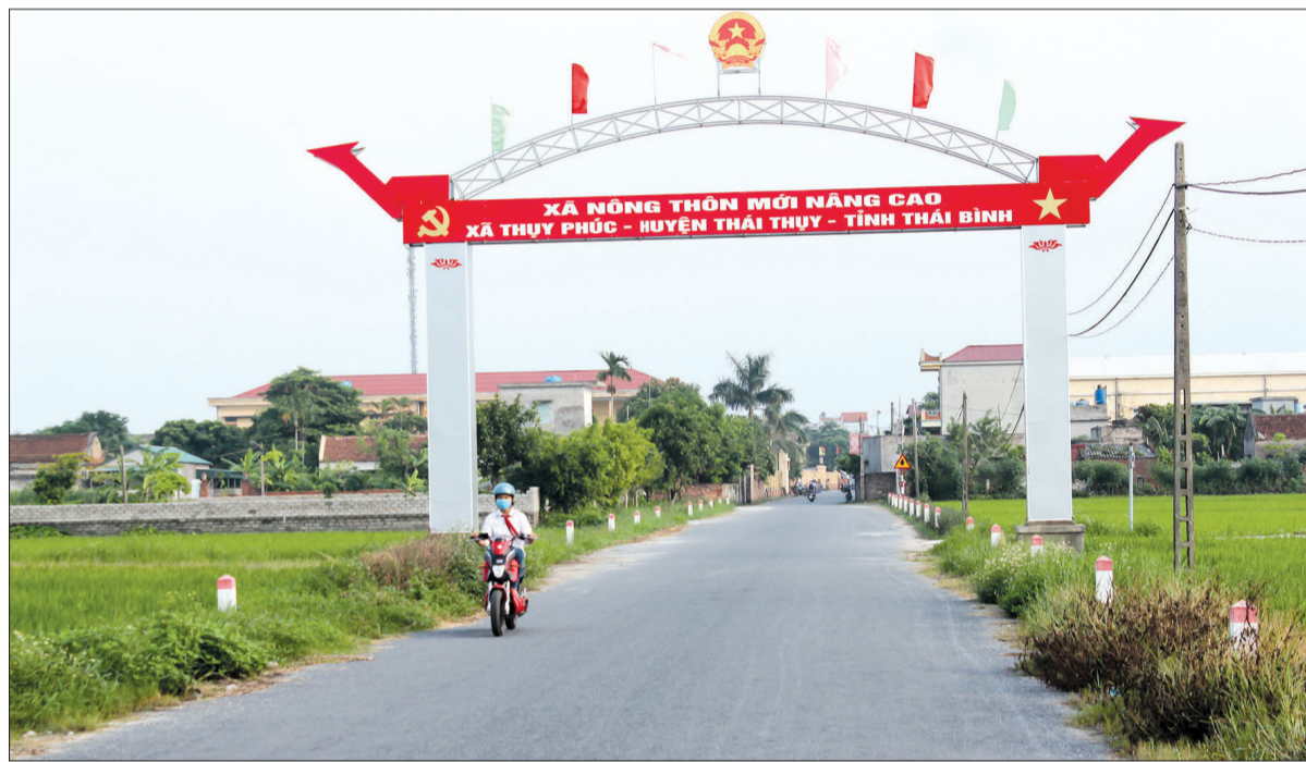
Theo kế hoạch, xã Thụy Phúc sẽ sáp nhập với xã Thụy Dương thành xã Dương Phúc.