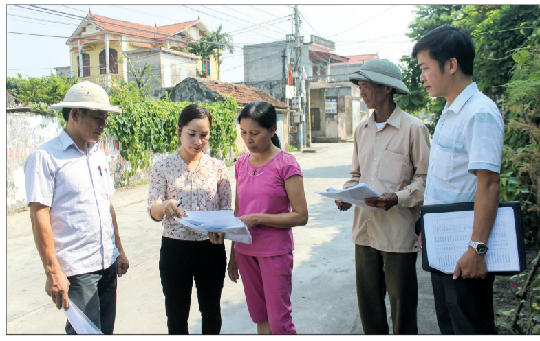
Tổ chức lấy ý kiến của cử tri về phương án sáp nhập đơn vị hành chính cấp xã tại xã Thụy Hà (Thái Thụy).