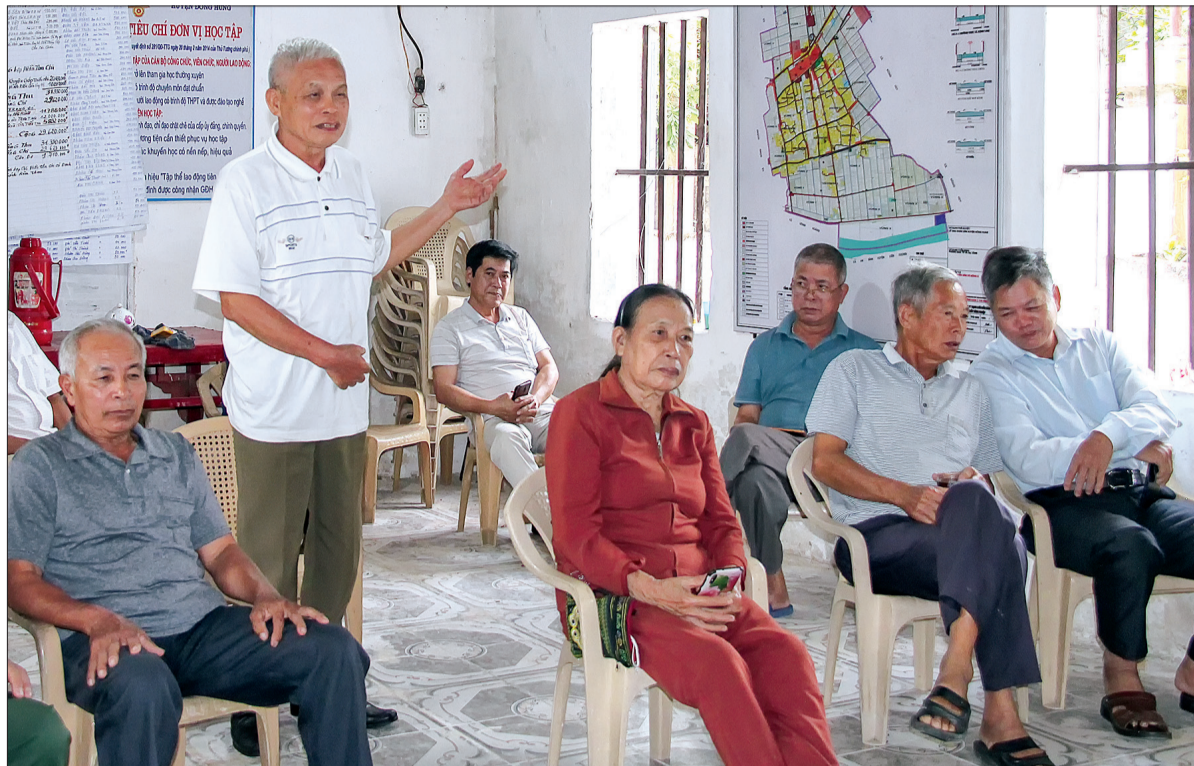
Xu hướng "già hóa" tại các chi bộ khối nông thôn.

Tại các chi bộ khối nông thôn hiện đảng viên đang có xu hướng "già hóa", tuổi đời đảng viên tham gia sinh hoạt bình quân từ 50 - 70. Mặc dù các cấp ủy, chính quyền đã có nhiều chủ trương, biện pháp lãnh đạo, chỉ đạo công tác phát triển đảng viên song vẫn trong tình trạng loay hoay tìm nguồn, không đạt chỉ tiêu đề ra.