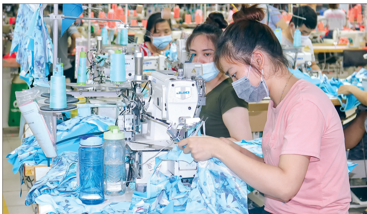
Hiện nay, phần lớn thanh niên khu vực nông thôn làm tại các công ty, xí nghiệp.

theo số lượng đơn thuần. Số lượng đảng viên của Đảng bộ tỉnh hàng năm tăng, bình quân xấp xỉ 2.000 đảng viên, song số lượng đảng viên mới kết nạp lại có xu hướng giảm.