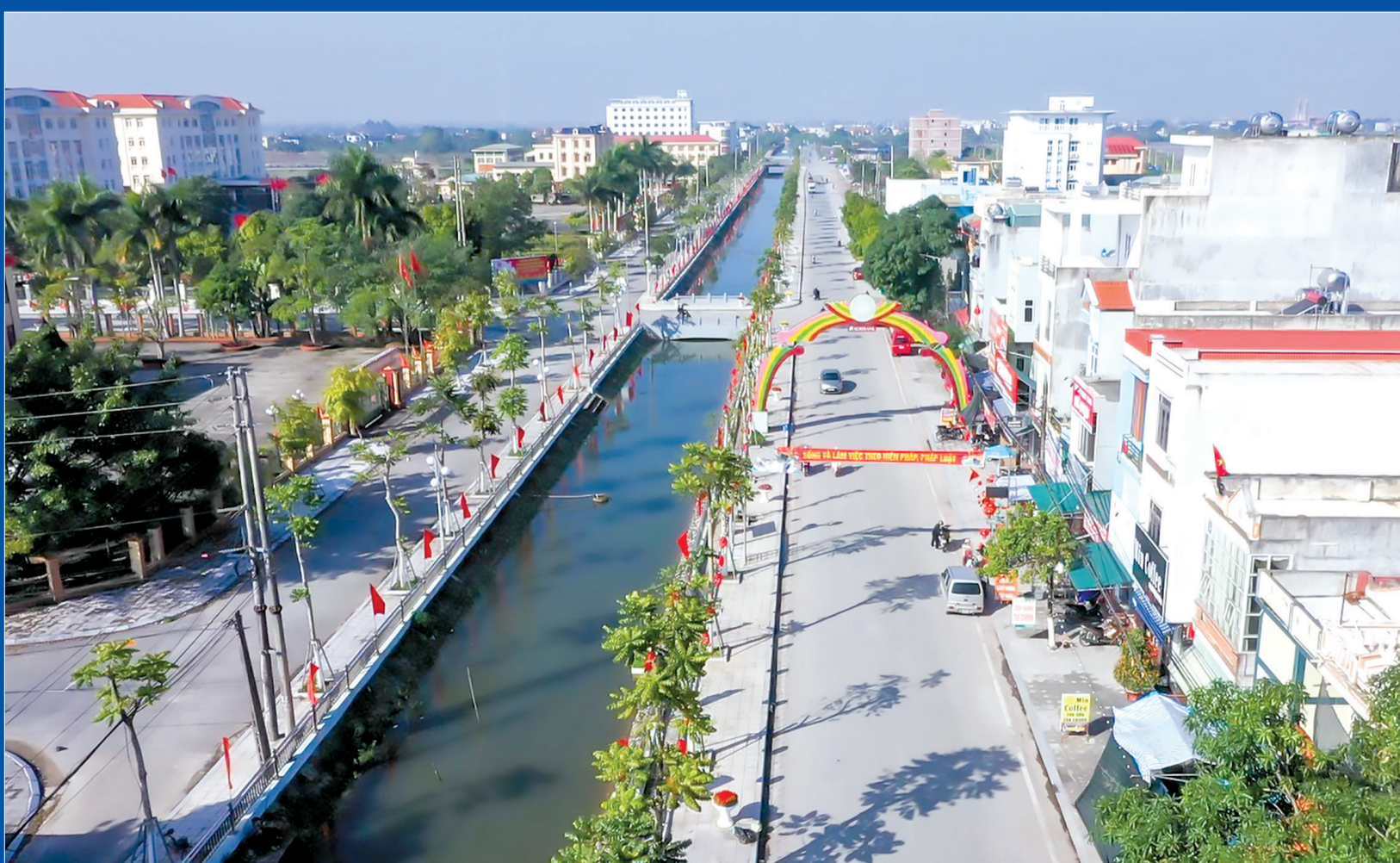
Thị trấn Kiến Xương (huyện Kiến Xương).