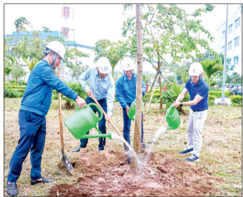
Lãnh đạo Công ty Nhiệt điện Thái Bình cùng đoàn viên, thanh niên trồng cây tại khuôn viên.

Sáng ngày 13/3, Đoàn Thanh niên Công ty Nhiệt điện Thái Bình tổ chức lễ phát động "Tết trồng cây năm 2024 - vì một nhà máy xanh".