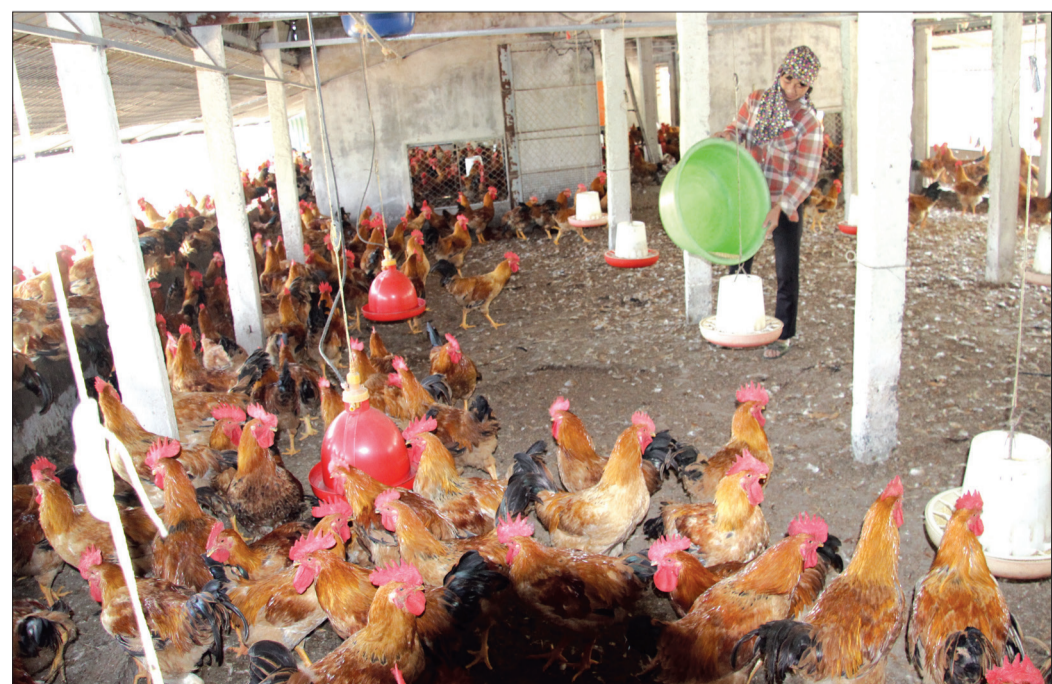
Chăn nuôi gà sử dụng đệm lót sinh học của hộ dân xã Minh Quang (Kiến Xương) góp phần an toàn dịch bệnh.