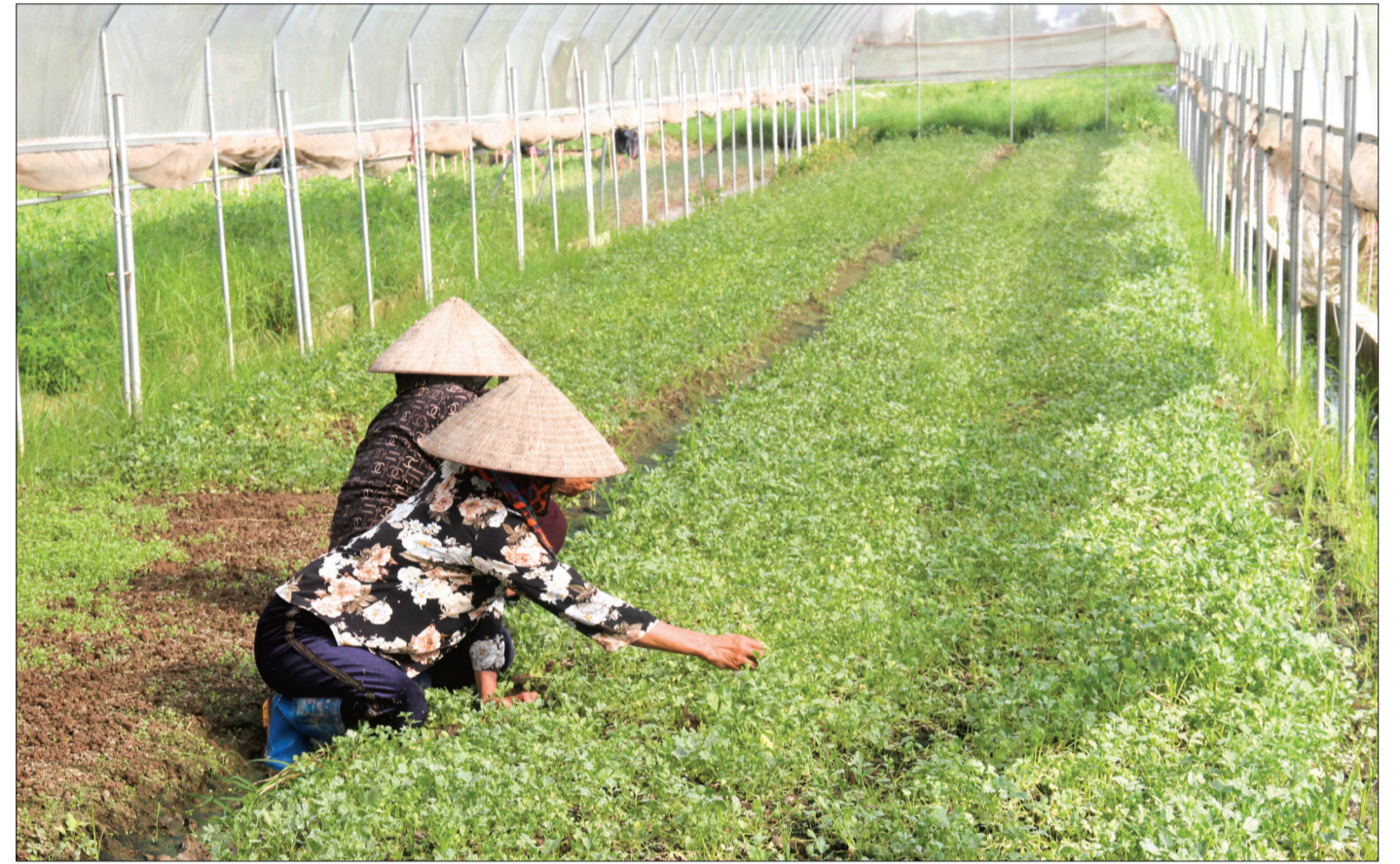
Vùng sản xuất rau VietGAP của HTX Nông nghiệp xanh Trung An (Vũ Thư).