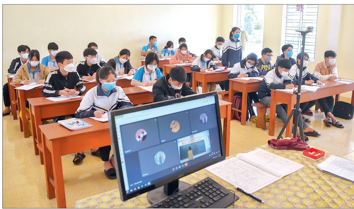
Trường Tiểu học và THCS Quỳnh Bảo (Quỳnh Phụ) duy trì việc dạy học trực tiếp và trực tuyến.

Trước những diễn biến phức tạp của dịch Covid-19, với quyết tâm không để học sinh mắc Covid-19 bị hồng kiến thức, các trường học trên địa bàn huyện Quỳnh Phụ đã triển khai nhiều phương án vừa phòng, chống dịch hiệu quả vừa hoàn thành chương trình học cho các em.