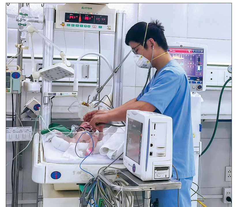
Bác sĩ Bệnh viện Nhi Thái Bình thăm khám bệnh nhân.