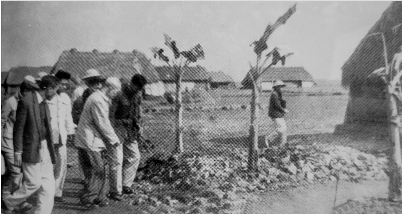
Chủ tịch Hồ Chí Minh về thăm bà con nông dân Hợp tác xã Nam Cường, ngày 26/3/1962.

Vinh dự, tự hào được đón Bác Hồ về thăm cách đây 60 năm (26/3/1962 - 26/3/2022), khắc ghi những lời căn dặn của Người, các thế hệ cán bộ, đảng viên và nhân dân xã Nam Cường (Tiền Hải) đã đoàn kết, chung sức đồng lòng, kiên cường vượt mọi khó khăn, biến vùng đất hoang vu, sinh lý trở thành vùng quê trù phú, ngày càng phát triển.