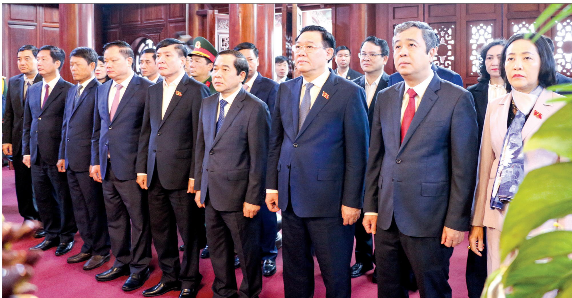
Đồng chí Vương Đình Huệ, Ủy viên Bộ Chính trị, Chủ tịch Quốc hội cùng thành viên đoàn công tác và các đồng chí lãnh đạo tỉnh dâng hương tại Đền thờ Bác Hồ.

Sáng ngày 20/1, đồng chí Vương Đình Huệ, Ủy viên Bộ Chính trị, Chủ tịch Quốc hội cùng đoàn công tác Trung ương về thăm và làm việc tại Thái Bình. Cùng đi có các đồng chí Ủy viên Ban Chấp hành Trung ương Đảng: Bùi Văn Cường, Tổng Thư ký Quốc hội, Chủ nhiệm Văn phòng Quốc hội; Nguyễn Thúy Anh, Chủ nhiệm Ủy ban Xã hội của Quốc hội; Lê Quang Mạnh, Chủ nhiệm Ủy ban Tài chính - Ngân sách của Quốc hội; Nguyễn Đắc Vinh, Chủ nhiệm Ủy ban Văn hóa, Giáo dục của Quốc hội; Nguyễn Thị Thanh, Trưởng ban Công tác đại biểu thuộc Ủy ban Thường vụ Quốc hội, Phó Trưởng ban Tổ chức Trung ương; Dương Thanh Bình, Trưởng ban Dân nguyện thuộc Ủy ban Thường vụ Quốc hội; Nguyễn Thanh Nghị, Bộ trưởng Bộ Xây dựng; lãnh đạo các Bộ: Kế hoạch và Đầu tư, Tài chính, Nông nghiệp và Phát triển nông thôn, Công Thương, Tài nguyên và Môi trường, Giao thông Vận tải.