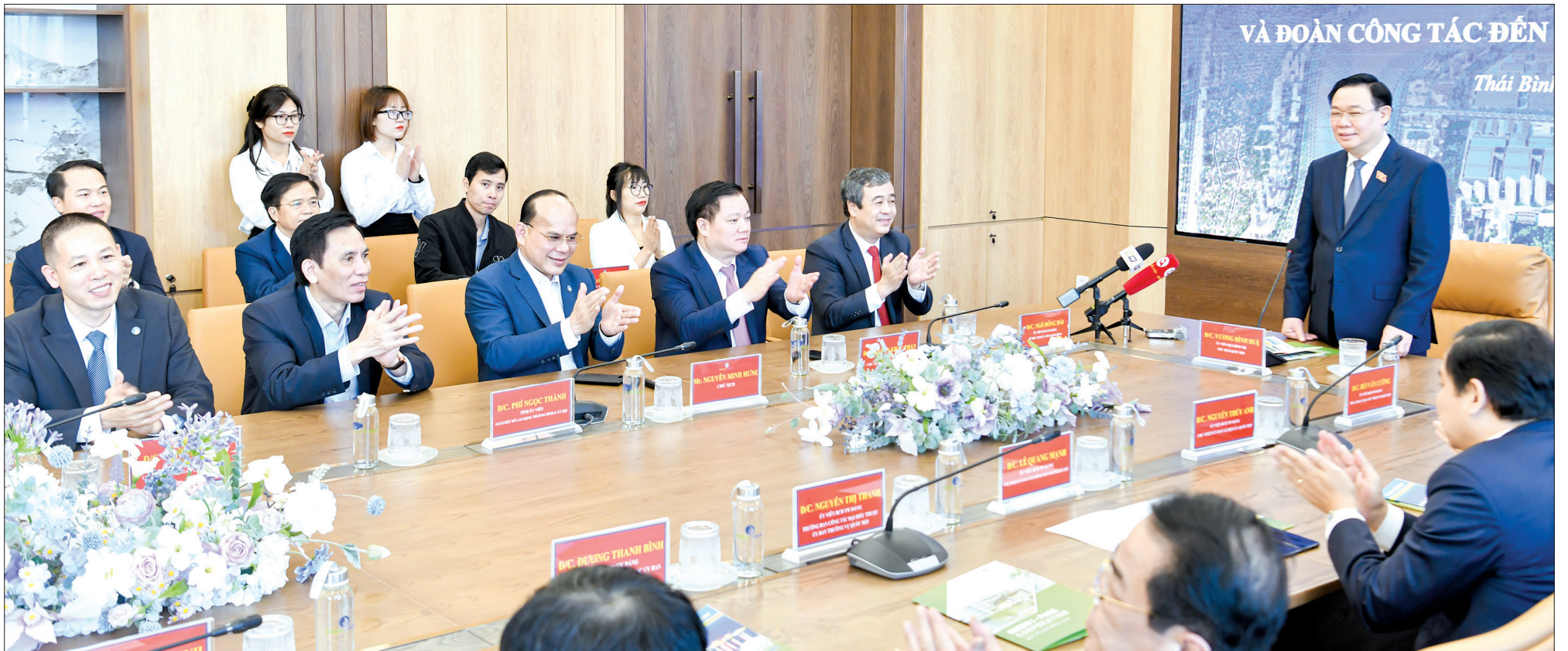
Đồng chí Vương Đình Huệ, Ủy viên Bộ Chính trị, Chủ tịch Quốc hội phát biểu tại buổi làm việc tại khu công nghiệp Liên Hà Thái (Thái Thụy).