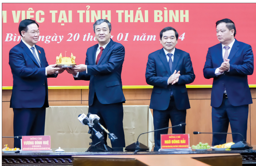
Đồng chí Vương Đình Huệ, Ủy viên Bộ Chính trị, Chủ tịch Quốc hội tặng quà lưu niệm các đồng chí lãnh đạo tỉnh.