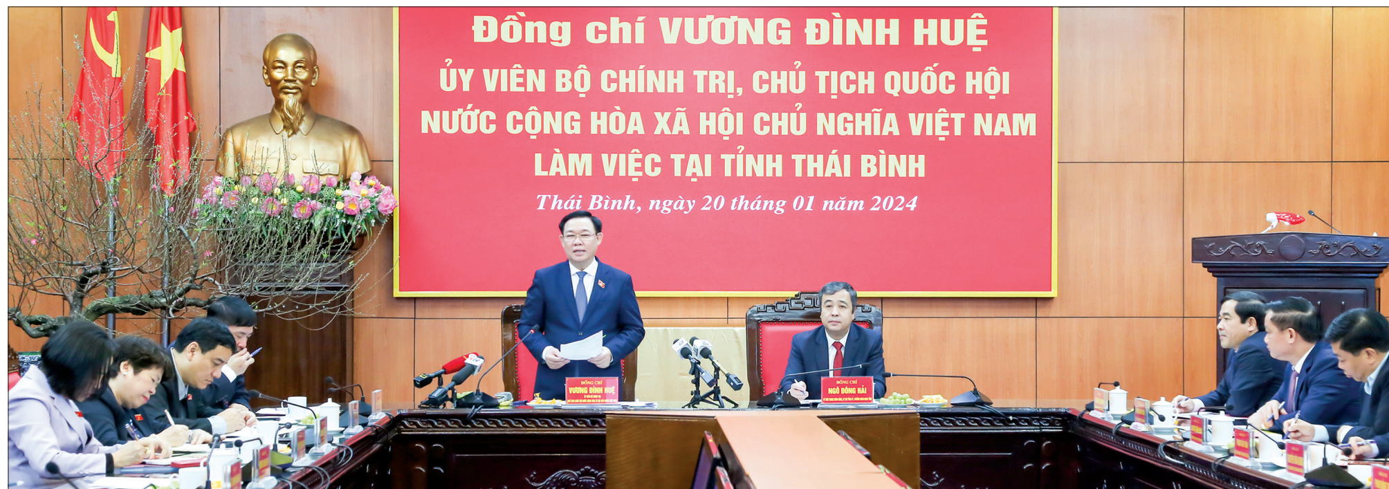
Đồng chí Vương Đình Huệ, Ủy viên Bộ Chính trị, Chủ tịch Quốc hội phát biểu tại buổi làm việc với Ban Thường vụ Tỉnh ủy Thái Bình.

Hồ Chí Minh; kế thừa, phát huy truyền thống tốt đẹp, thành tựu to lớn của Quốc hội qua các thời kỳ, tiếp tục đổi mới phương thức, nâng cao chất lượng và hiệu quả hoạt động của Quốc hội vì mục tiêu tối thượng là phụng sự lợi ích của quốc gia, dân tộc, vì hạnh phúc của nhân dân, góp phần thực hiện thắng lợi Nghị quyết Đại hội XIII của Đảng, xứng đáng với niềm tin của cử tri và các tầng lớp nhân dân. Đảng bộ, chính quyền và nhân dân Thái Bình luôn khắc ghi những tình cảm đặc