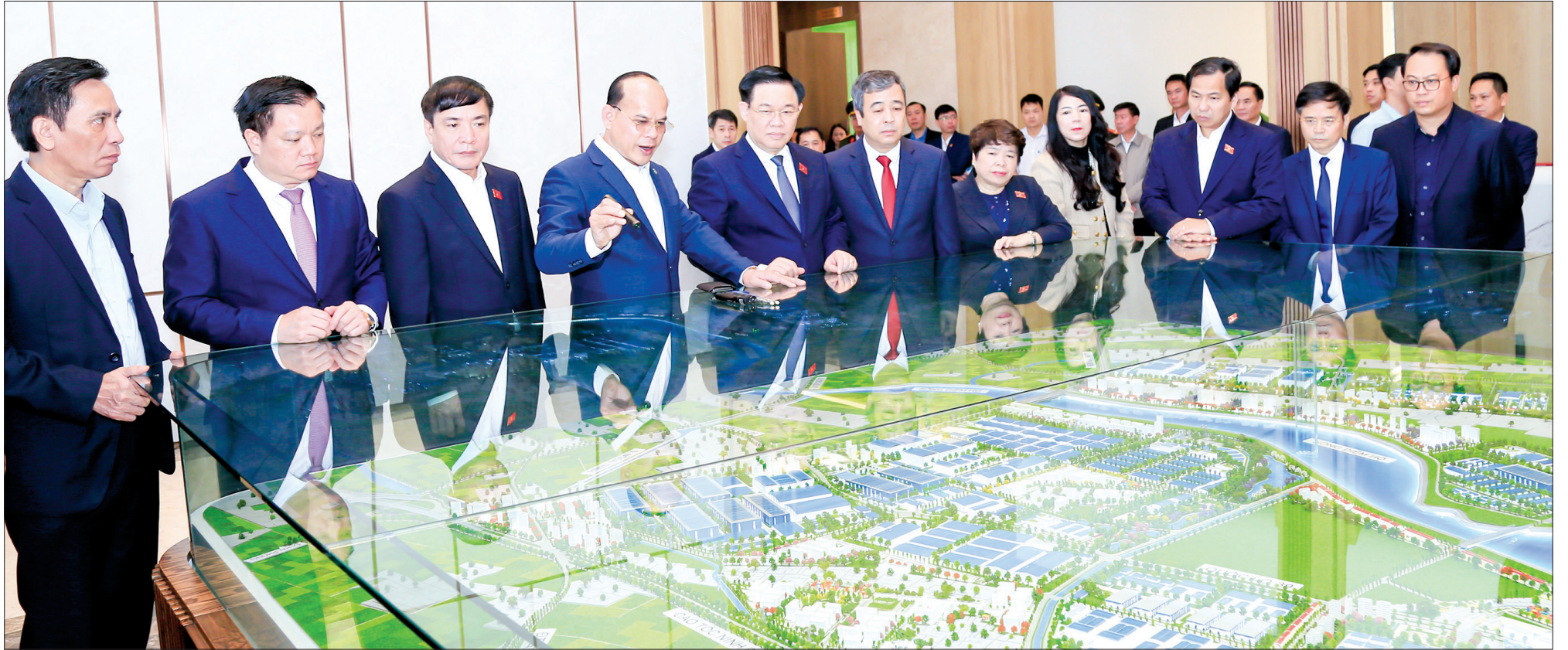
Đồng chí Vương Đình Huệ, Ủy viên Bộ Chính trị, Chủ tịch Quốc hội cùng đoàn công tác và các đồng chí lãnh đạo tỉnh Thái Bình nghe đại diện Công ty Cổ phần Green i-Park báo cáo quá trình đầu tư hạ tầng khu công nghiệp Liên Hà Thái.