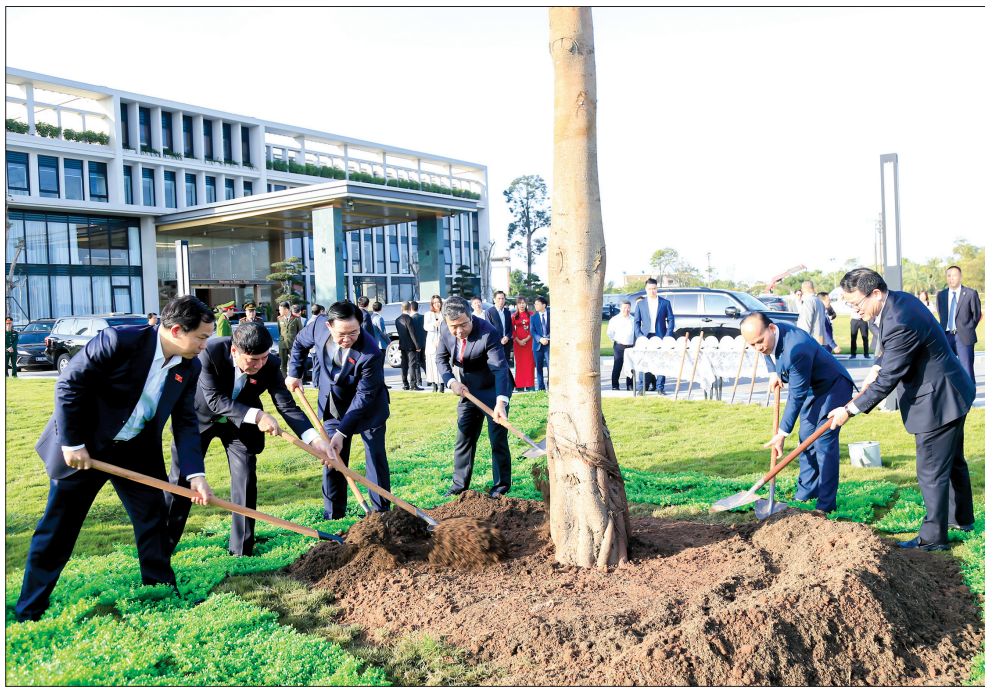
Đồng chí Vương Đình Huệ, Ủy viên Bộ Chính trị, Chủ tịch Quốc hội cùng các đồng chí lãnh đạo Trung ương và tỉnh Thái Bình trồng cây lưu niệm tại khu công nghiệp Liên Hà Thái.