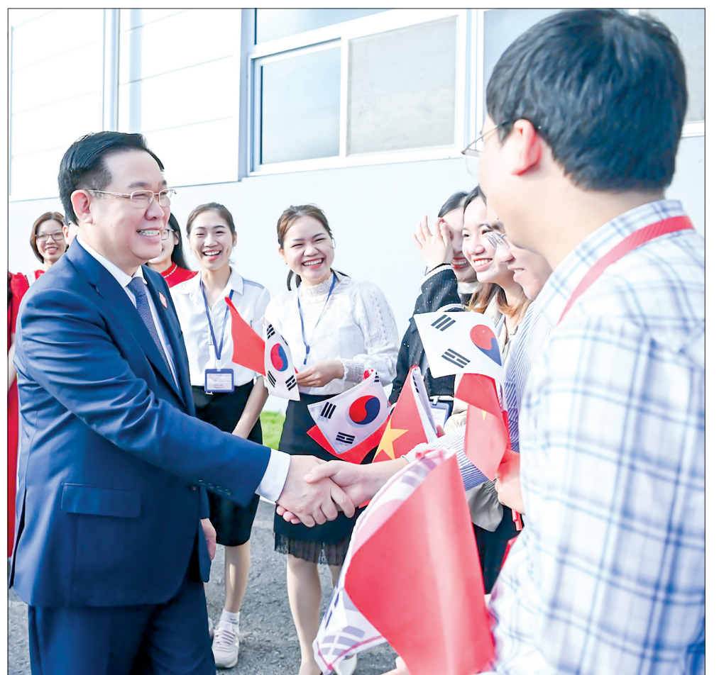
Đồng chí Vương Đình Huệ, Ủy viên Bộ Chính trị, Chủ tịch Quốc hội với cán bộ, nhân viên, người lao động Công ty Ohsung Vina Thái Bình.

Chủ tịch Quốc hội Vương Đình Huệ cùng đoàn công tác và các đồng chí lãnh đạo tỉnh Thái Bình đã đến thăm, kiểm tra tình hình sản xuất của Công ty TNHH Ohsung Vina Thái Bình (KCN Liên Hà Thái) - doanh nghiệp sản xuất linh kiện chuyên sản xuất tất cả các bộ phận dành cho màn hình LED/OLED do LG Display sản xuất. Chủ tịch Quốc hội mong muốn Công ty tiên phong trong việc xây dựng hệ sinh thái, liên kết với các doanh nghiệp trong và ngoài nước để tạo ra những sản phẩm công nghiệp phụ trợ, xây dựng chuỗi giá trị, tiếp tục có bước phát triển mới, tăng doanh thu, tạo việc làm cho nhiều lao động, đóng góp vào sự phát triển của Khu kinh tế Thái Bình nói riêng, kinh tế - xã hội của tỉnh Thái Bình nói chung.