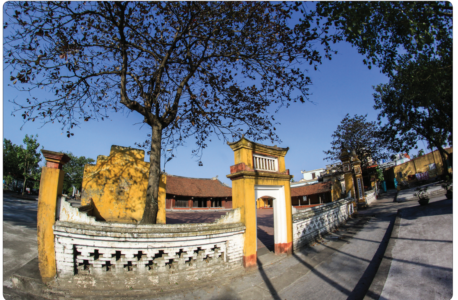
Đình La Miên (La Vân) thờ Quốc sư triều Lý Nguyễn Chí Thành, di tích lịch sử văn hóa cấp quốc gia, nơi lưu giữ di sản Hán Nôm vào loại lớn nhất tỉnh Thái Bình.

Cụm di tích đình, đền, chùa La Vân (còn gọi là La Miên), xã Quỳnh Hồng (Quỳnh Phụ) được xếp hạng di tích lịch sử văn hóa cấp quốc gia năm 1995, thờ Quốc sư Nguyễn Minh Không (tên gọi khác là Nguyễn Chí Thành) thế kỷ XII, ông là cao tăng được vua nhà Lý phong Quốc sư và là người có công lao to lớn với vương triều Lý trong việc trị thủy, chống giặc ngoại xâm và mở mang vùng đất lưu vực sông Hồng. Ông còn được tôn vinh là vị tổ sư của nghề đúc đồng và bèo hoa dâu nổi tiếng La Vân. Quần thể kiến trúc đa thần giáo của làng La Miên xưa, La Vân nay còn bảo lưu khá nhiều tác phẩm nghệ thuật độc đáo như điêu khắc trên đá và trên gỗ.