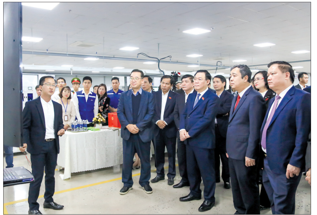
Đồng chí Vương Đình Huệ, Ủy viên Bộ Chính trị, Chủ tịch Quốc hội cùng đoàn công tác và các đồng chí lãnh đạo tỉnh nghe đại diện Công ty Ohsung Vina Thái Bình giới thiệu về hoạt động của Công ty.

👉 nền tảng thúc đẩy kinh tế - xã hội phát triển nhanh hơn, tạo nền tảng để Thái Bình bước sang giai đoạn phát triển mới, vì vậy cần phải tận dụng cơ hội này để bứt phá vươn lên. Trong đó, cần tiếp tục đẩy mạnh phát triển kinh tế để đạt tốc độ tăng trưởng 2 con số; huy động các nguồn lực đầu tư xây dựng, hoàn thiện hạ tầng kinh tế - xã hội.