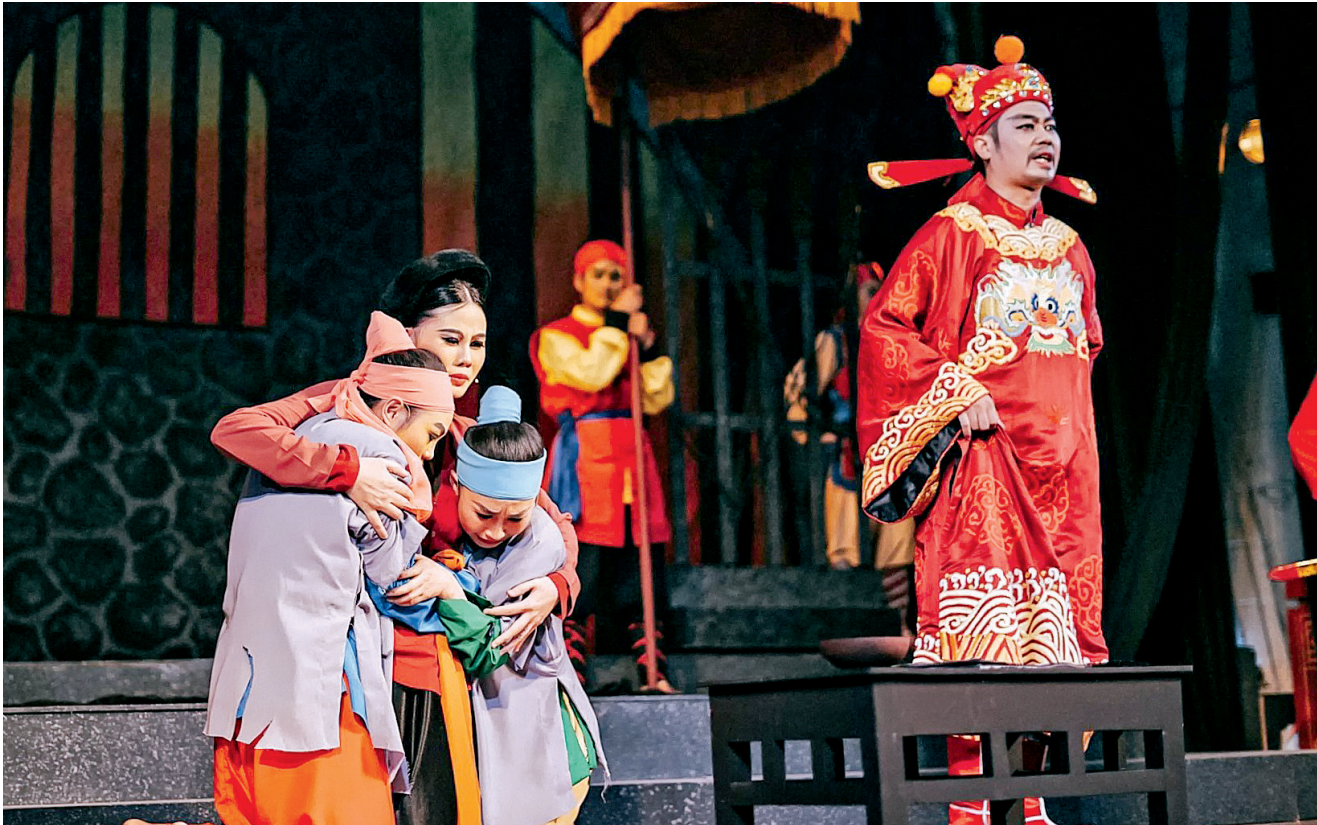
Với phương châm bảo tồn nghệ thuật chèo bằng con người, nhiều trích đoạn chèo cổ được phục dựng để các nghệ sĩ trẻ hiểu và gìn giữ giá trị truyền thống.

Trong thời điểm sân khấu chưa thể “sáng đèn” vì dịch Covid-19, các nghệ sĩ của Nhà hát Chèo Thái Bình vẫn hằng say chia ca tập luyện, vừa bảo đảm phòng, chống dịch bệnh vừa trau dồi chuyên môn, chuẩn bị khi dịch bệnh được khống chế có thể mang đến cho công chúng những chương trình nghệ thuật ấn tượng, hấp dẫn nhất.