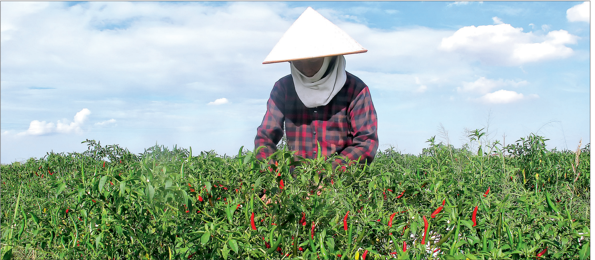
Vùng trồng ớt tập trung tại huyện Quỳnh Phụ giá trị sản xuất đạt 120 triệu đồng/ha/vụ.