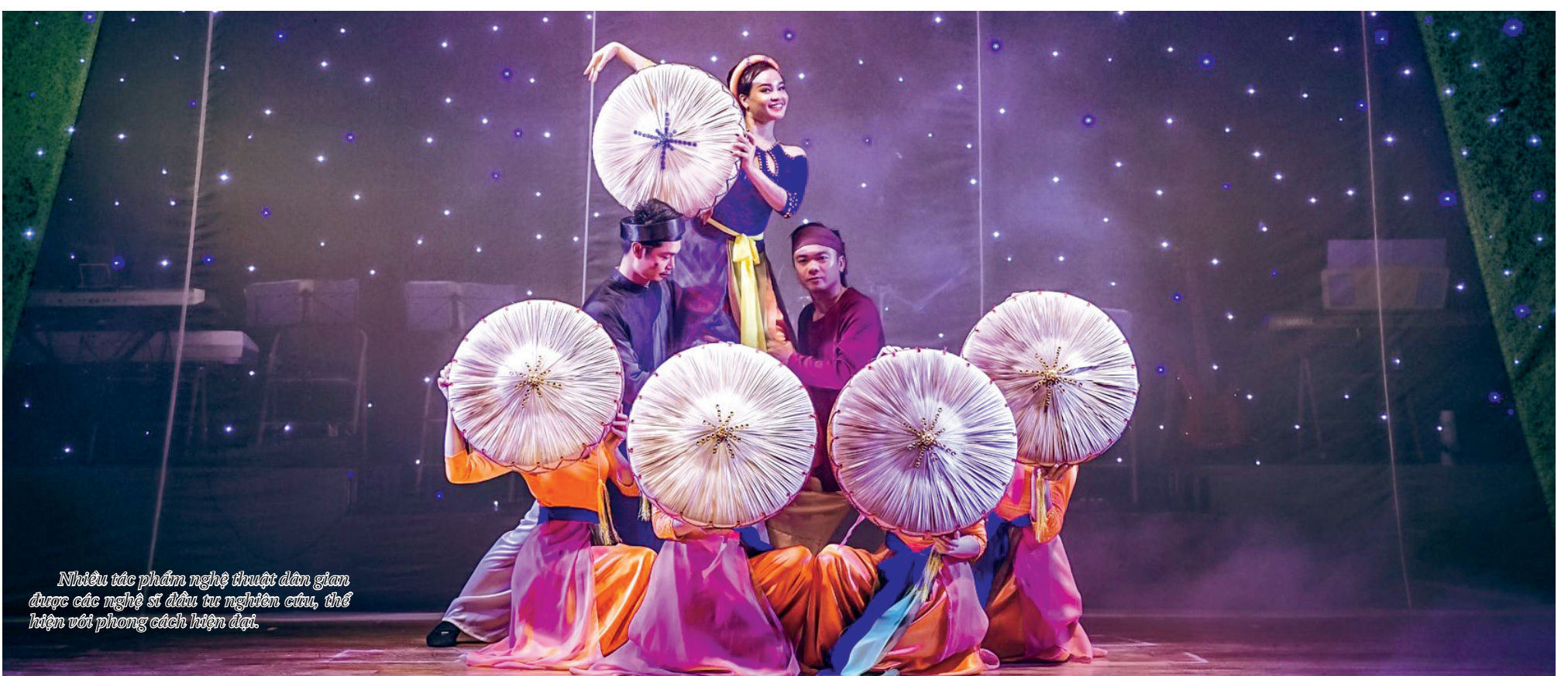
Nhiều tác phẩm nghệ thuật dân gian được các nghệ sĩ đầu tư nghiên cứu, thể hiện với phong cách hiện đại.

Vượt qua những khó khăn do ảnh hưởng của dịch Covid-19, các nghệ sĩ, ca sĩ, nhạc công của Nhà hát Chèo Thái Bình đều mong mỗi một ngày gần nhất có thể đưa đến công chúng yêu nhạc trong tỉnh những vở chèo cổ được phục dựng lại và những tác phẩm âm nhạc mới về quê hương Thái Bình.