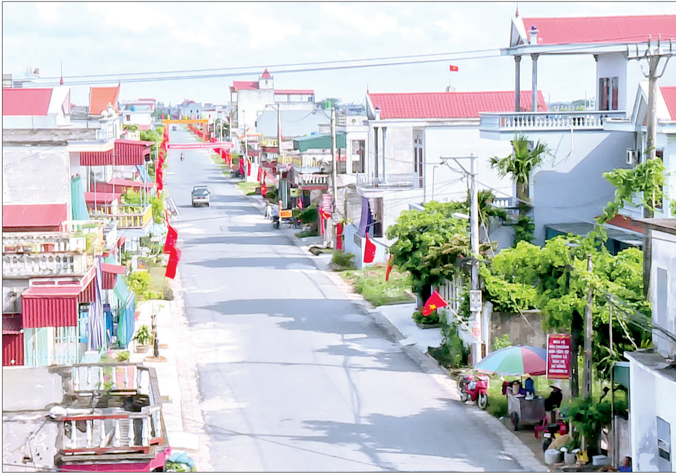
Diện mạo nông thôn mới xã Dương Phúc (Thái Thụy).