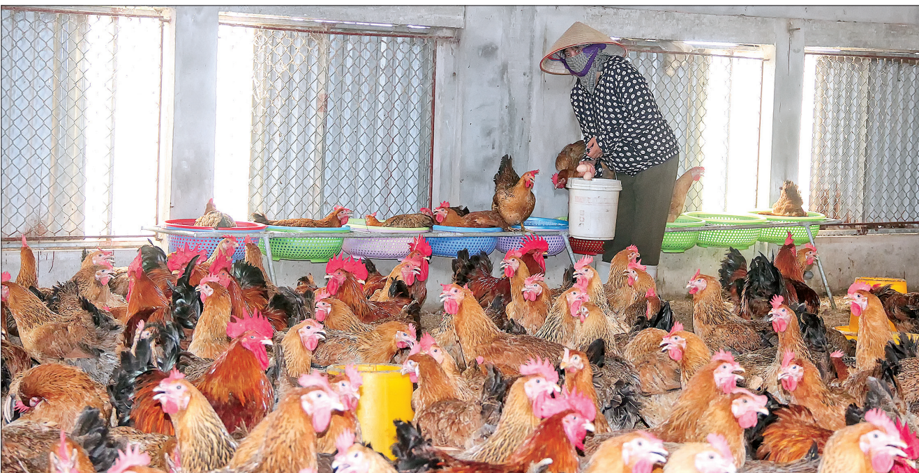
Tổng đàn gia cầm toàn tỉnh hiện đạt trên 14 triệu con.

Cùng với các chính sách của Trung ương, Thái Bình đã chủ động ban hành nhiều chính sách hỗ trợ phát triển nông nghiệp, nông thôn. Tận dụng các chính sách này cùng với tinh thần lao động cần cù, sáng tạo của nông dân đã góp phần đẩy nhanh quá trình chuyển dịch cơ cấu kinh tế nông nghiệp, bước đầu hình thành một số vùng sản xuất nông nghiệp tập trung theo hướng sản xuất hàng hóa cho hiệu quả kinh tế cao.