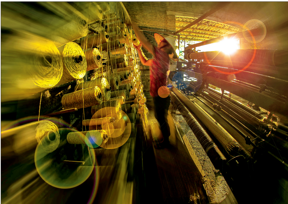
Người dân làng Hải Triều, xã Tân Lễ, huyện Hưng Hà vẫn cần mẫn với nghề dệt chiếu.

Giá trị to lớn của làng nghề thủ công truyền thống không chỉ ở chỗ tạo ra được nhiều việc làm, sản xuất ra nhiều hàng hóa phục vụ nhu cầu trong nước và xuất khẩu mà quan trọng hơn là làng nghề đang lưu giữ những giá trị văn hóa truyền thống quý báu trao truyền qua nhiều thế hệ những tinh hoa nghệ thuật, kỹ thuật dân gian, kinh nghiệm sản xuất, phong tục tập quán, văn hóa tâm linh và sinh hoạt tín ngưỡng của cộng đồng.