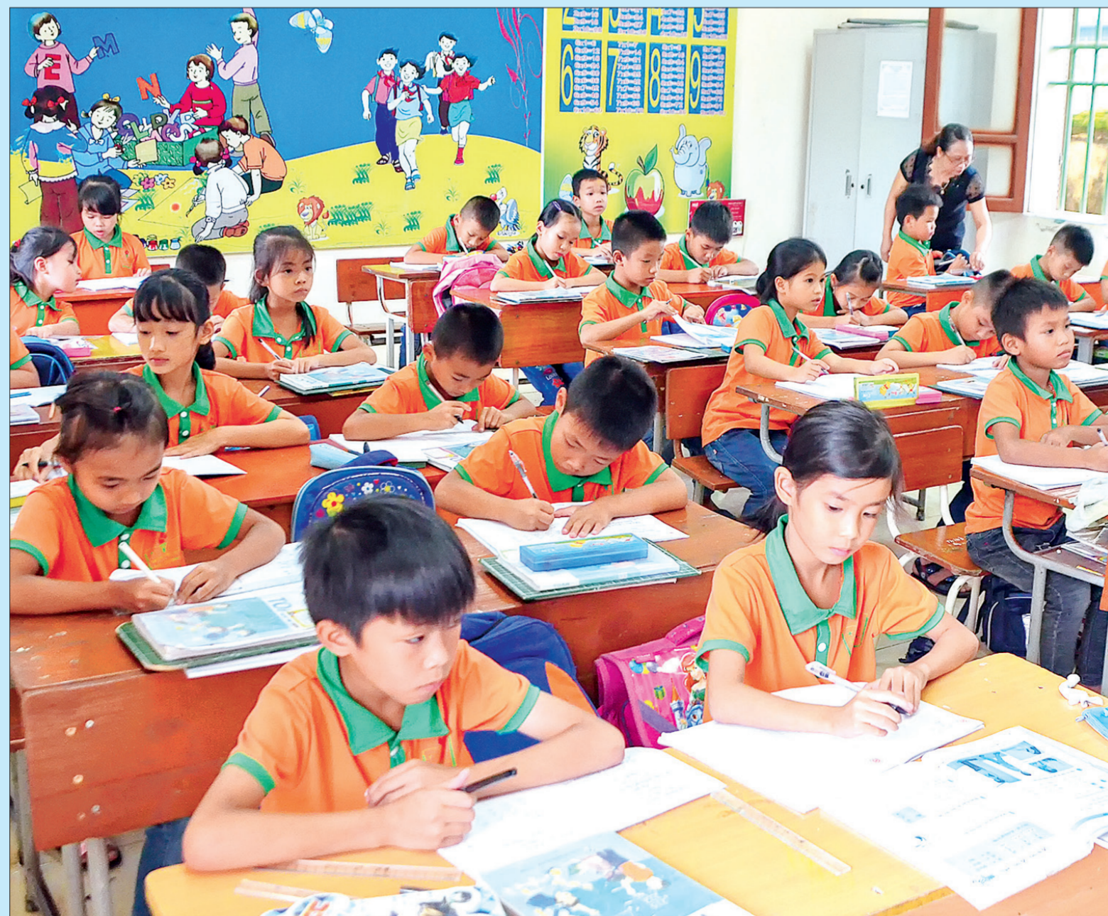
Học sinh Trường Tiểu học Tây Lương (Tiền Hải).