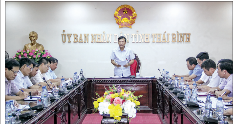
Đồng chí Đặng Trọng Thăng, Phó Bí thư thường trực Tỉnh ủy, Chủ tịch UBND tỉnh phát biểu tại cuộc họp.

Chiều ngày 1/10, UBND tỉnh họp nghe Ban Quản lý dự án đầu tư xây dựng các công trình giao thông tỉnh báo cáo tiến độ thực hiện dự án đầu tư xây dựng tuyến đường bộ ven biển tỉnh Thái Bình. Đồng chí Đặng Trọng Thăng, Phó Bí thư thường trực Tỉnh ủy, Chủ tịch UBND tỉnh chủ trì cuộc họp. Dự họp có các đồng chí Ủy viên Ban Thường vụ Tỉnh ủy, lãnh đạo UBND tỉnh, lãnh đạo một số sở, ngành, địa phương.