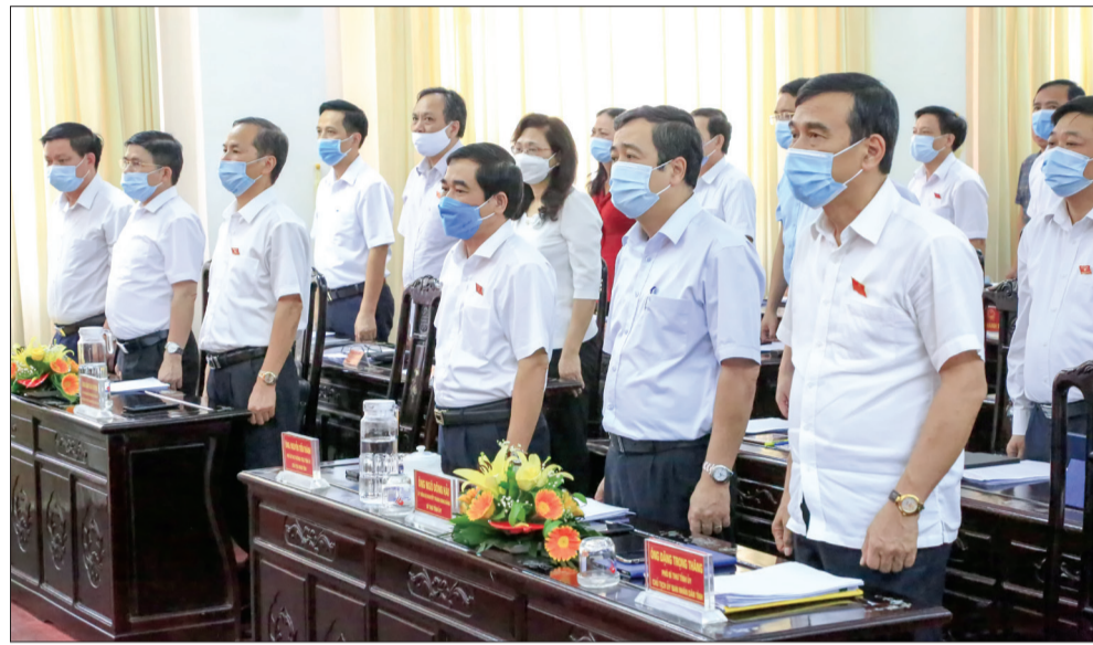
Các đồng chí lãnh đạo tỉnh và đại biểu dự khai mạc kỳ họp.