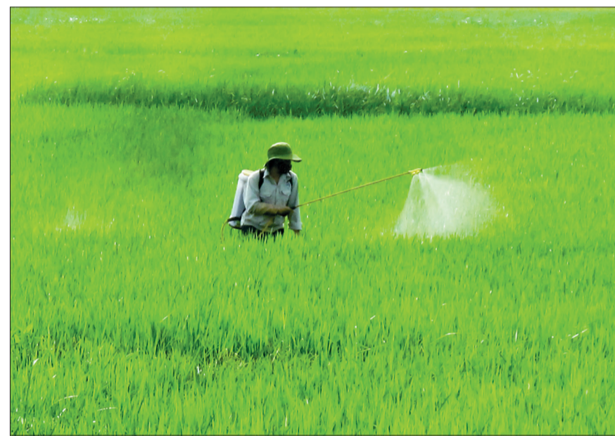
Nông dân huyện Tiền Hải phun thuốc trừ sâu cho lúa mùa.