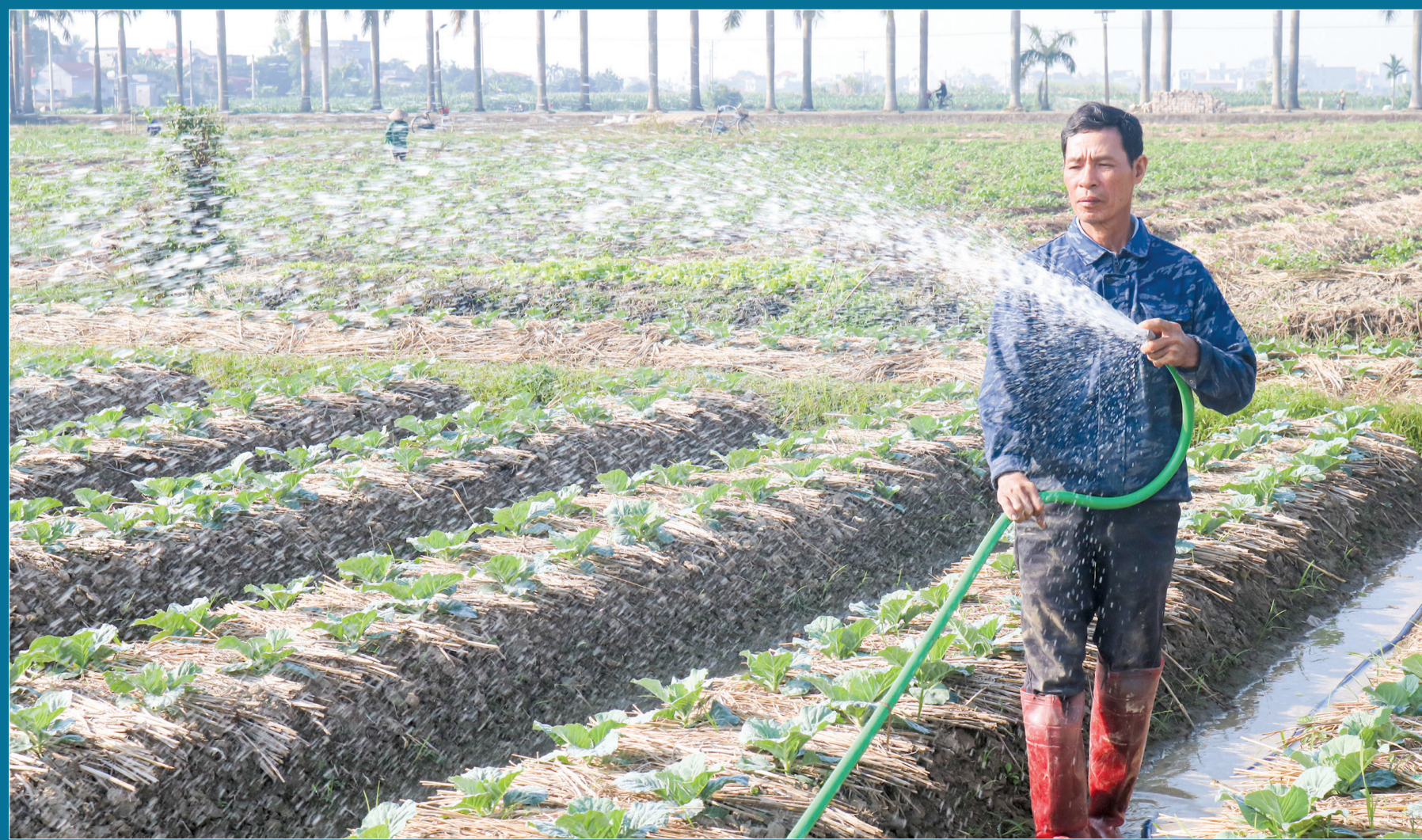
Vùng liên kết sản xuất bắp cải tại xã Quỳnh Nguyên (Quỳnh Phụ).