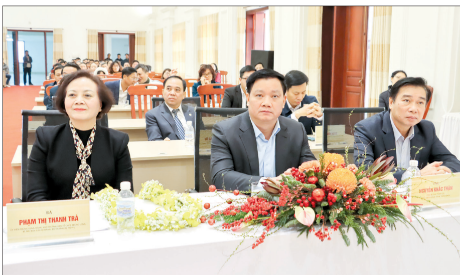
Đồng chí Phạm Thị Thanh Trà, Ủy viên Ban Chấp hành Trung ương Đảng, Bộ trưởng Bộ Nội vụ, Phó Trưởng ban Tổ chức Trung ương cùng các đồng chí lãnh đạo tỉnh chúc mừng lễ Giáng sinh 2023 tại Tòa Giám mục Giáo phận Thái Bình.