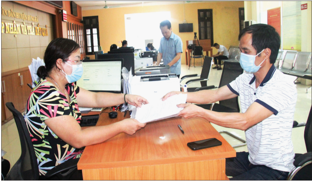
Cán bộ Văn phòng đăng ký đất đai huyện Hưng Hà giải quyết thủ tục hành chính cho người dân.

Với mục tiêu "lấy sự hài lòng của người dân làm thước đo hiệu quả công việc", thời gian qua, huyện Hưng Hà đã có nhiều giải pháp cải cách thủ tục hành chính (TTHC), qua đó tạo thuận lợi cho tổ chức, cá nhân khi đến giao dịch và từng bước rút ngắn TTHC trong quá trình giải phóng mặt bằng (GPMB) để thực hiện các dự án.