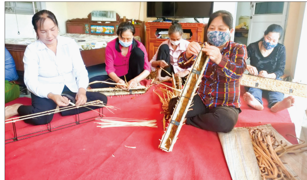
Nghề đan bèo tây xuất khẩu mang lại nguồn thu nhập ổn định và giải quyết việc làm trong lúc nông nhàn cho phụ nữ xã Quỳnh Xá (Quỳnh Phụ).