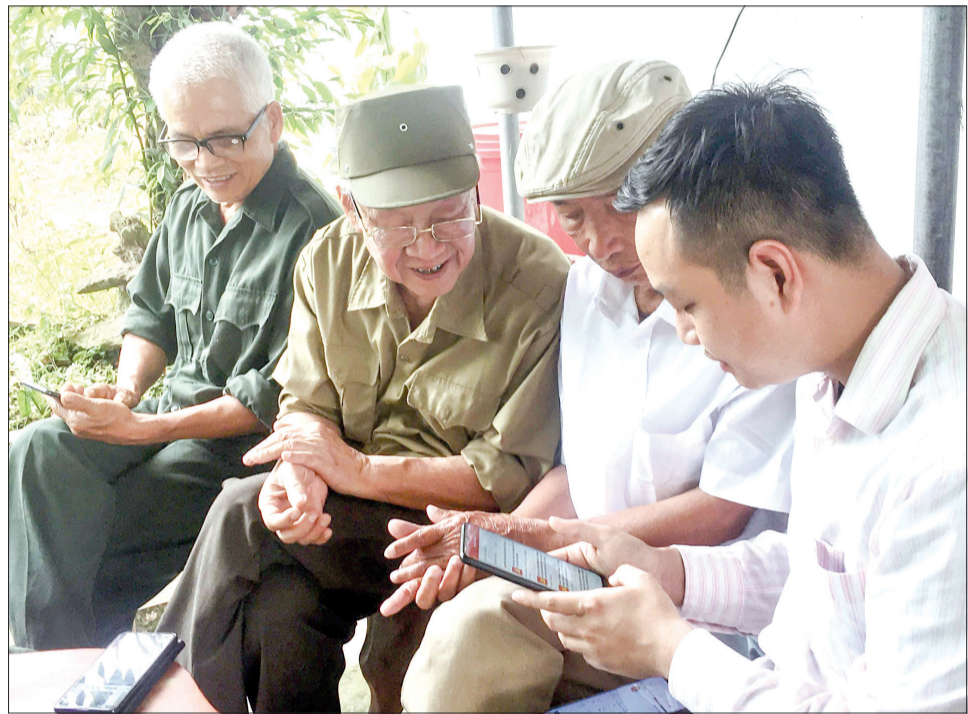
Đảng viên trẻ hướng dẫn đảng viên cao tuổi sử dụng phần mềm “Sổ tay đảng viên điện tử”.

Sau gần nửa năm triển khai phần mềm “Sổ tay đảng viên điện tử” trong toàn Đảng bộ, đến nay 100% tổ chức cơ sở đảng ở Vũ Thư đã khai thác, sử dụng phần mềm. Đối với đảng viên trẻ tuổi, việc sử dụng phần mềm không có gì khó khăn nhưng với những đảng viên tuổi cao, để tiếp cận, sử dụng phần mềm lại không hề đơn giản. Tuy nhiên, nếu cao tình thân gương mẫu đi đầu, nhiều đảng viên cao tuổi, nhất là ở chi bộ nông thôn đã không ngại học hỏi, tiếp cận công nghệ thông tin để sử dụng được phần mềm.