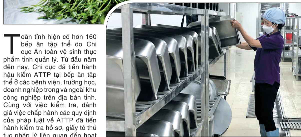
Bếp ăn Công ty Tân Đề bảo đảm an toàn vệ sinh thực phẩm.

Toàn tỉnh hiện có hơn 160 bếp ăn tập thể do Chi cục An toàn vệ sinh thực phẩm tỉnh quản lý. Từ đầu năm đến nay, Chi cục đã tiến hành kiểm tra ATTP tại bếp ăn tập thể ở các bệnh viện, trường học, doanh nghiệp trong và ngoài khu công nghiệp trên địa bàn tỉnh. Cùng với việc kiểm tra, đánh giá việc chấp hành các quy định của pháp luật về ATTP đã tiến hành kiểm tra hồ sơ, giấy tờ thủ tục pháp lý liên quan đến hoạt động phục vụ ăn uống của cơ sở, điều kiện về cơ sở vật chất, trang thiết bị dụng cụ chế biến, ăn uống; điều kiện về kiến trúc ATTP, sức khỏe của người trực tiếp chế biến thực phẩm; nguồn gốc nguyên liệu thực phẩm sử dụng trong chế biến phục vụ ăn uống... Bên cạnh đó, Chi cục đã lấy mẫu, test nhanh đối với một số thực phẩm có nguy cơ cao và các dụng cụ sử dụng chế biến, đựng thực phẩm tại bếp ăn tập thể.