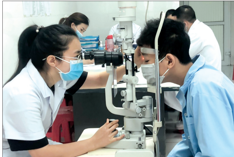
Bệnh nhân viêm kết mạc điều trị tại Bệnh viện Mắt Thái Bình.

Không chỉ gây bệnh về đường hô hấp, Adeno virus còn là nguyên nhân khiến nhiều người mắc bệnh viêm kết mạc (đau mắt đỏ). Thời gian gần đây, số lượng bệnh nhân đến khám, điều trị viêm kết mạc tại Bệnh viện Mắt Thái Bình gia tăng.