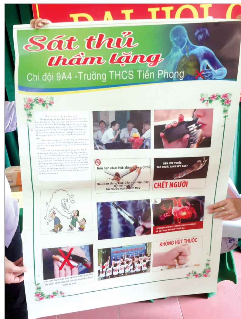
Tác phẩm tuyên truyền phòng, chống tác hại của thuốc lá của giáo viên, học sinh Trường THCS Tiên Phong (thành phố Thái Bình).

khí phong trào được phát động, các em đã ý thức rất rõ về tác hại của thuốc lá. Trong trường không có hiện tượng học sinh hút thuốc lá. Phương pháp truyền thông của Trường THCS Tiên Phong đã thực sự lôi cuốn học sinh, giúp các em cùng nhau tìm hiểu thông tin về tác hại của thuốc lá, có thêm kỹ năng tuyên truyền, thuyết phục người thân, bạn bè nói không với thuốc lá. Mô hình tuyên truyền này cần tiếp tục được duy trì và nhân rộng bởi ở độ tuổi học sinh luôn có những thay đổi về tâm lý rất nhanh, nhiều em muốn chứng tỏ mình đã trưởng thành nên bắt đầu thử hút thuốc. Thuốc lá rất dễ nghiện nhưng đã nghiện lại rất khó bỏ. Chính các em học sinh sẽ thấy rõ tầm quan trọng khi được sống trong môi trường trong lành, không khói thuốc lá. Tại thành phố, học sinh dễ tiếp cận với thuốc lá, nhất là thuốc lá điện tử nên nhiều trường học đã tập trung triển