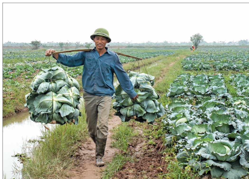
Nông dân xã Vũ Văn thu hoạch bắp cải.