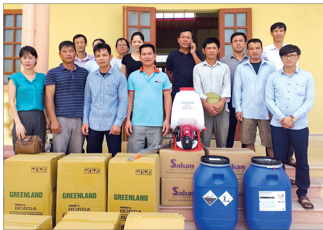
Chi cục Chăn nuôi và Thú y cấp vật tư hỗ trợ cho các cơ sở chăn nuôi tham gia mô hình.

C hăn nuôi lợn hiện nay đang đối mặt với một số dịch bệnh nguy hiểm, đòi hỏi người chăn nuôi phải áp dụng quy trình chăn nuôi an toàn dịch bệnh. Để góp phần thúc đẩy sản xuất chăn nuôi phát triển bền vững, hiệu quả, thời gian qua, Chi cục Chăn nuôi và Thú y (Sở Nông nghiệp và Phát triển nông thôn) đã