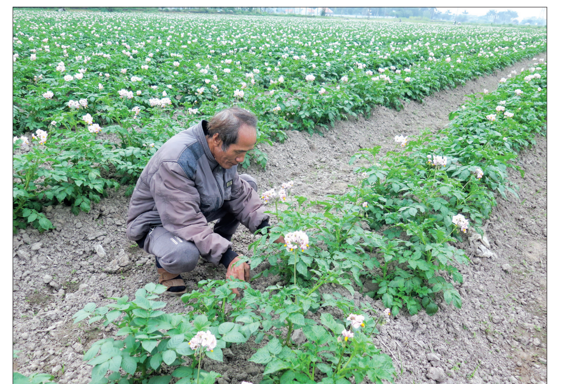
Vùng khoai tây liên kết hơn 6ha ở xã Vũ Ninh.