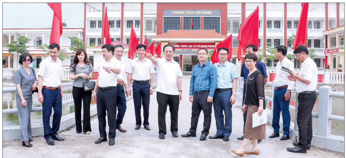
Đoàn công tác khảo sát tại Trường THCS Tây Giang (Tiền Hải).

chiến lược quan trọng trong phát triển kinh tế - xã hội của tỉnh. Thị trấn Tiên Hải là thị trấn huyện lỵ của huyện Tiên Hải, cách thành phố Thái Bình 21km, cách thị trấn Kiến Xương (Kiến Xương) 7,5km và cách thị trấn Diêm Điền (Thái Thụy) 16km; là