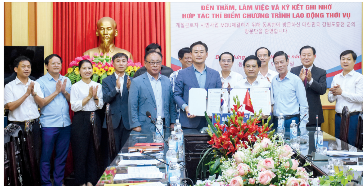
Huyện Đông Hưng và quận Hongcheon ký kết bản ghi nhớ thỏa thuận hợp tác thí điểm chương trình lao động thời vụ.

Chiều cùng ngày, đoàn công tác quận Hongcheon có buổi làm việc với huyện Đông Hưng, ký kết bản ghi nhớ thỏa thuận hợp tác thí điểm chương trình lao động thời vụ giữa huyện Đông Hưng và quận Hongcheon.